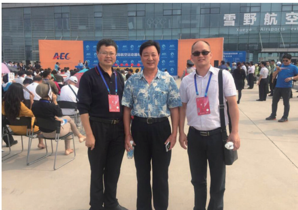
参加 2015 中国（莱芜）国际航空体育节