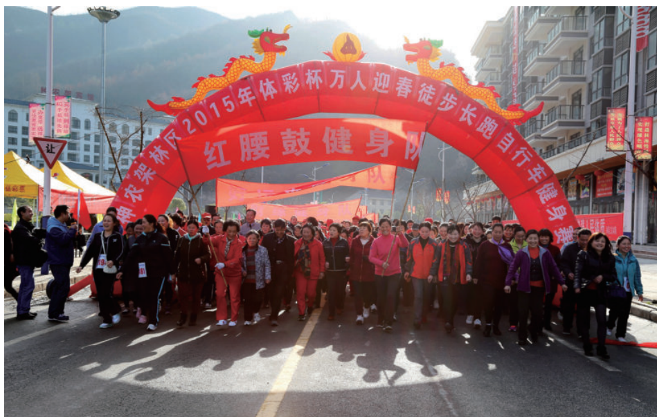
2015 体彩杯万人迎春徒步长跑自行车健身赛