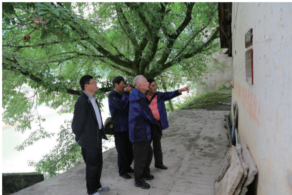
川鄂古盐道溯源考察