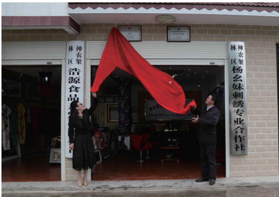
省级文化产业“堂纺叠绣”生产性保护基地揭牌