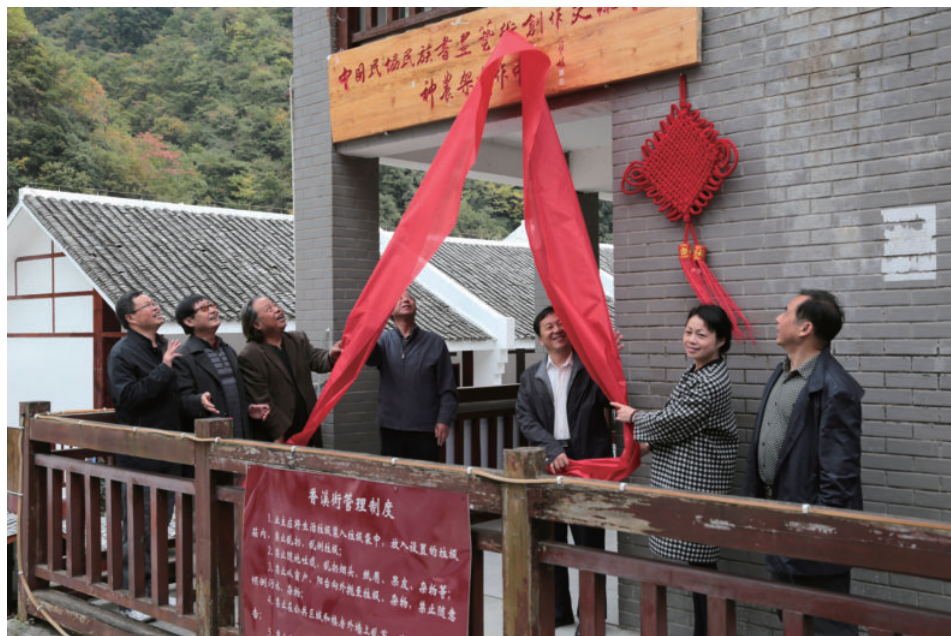
成立中国民协民族书画艺术创作中心神农架创作中心