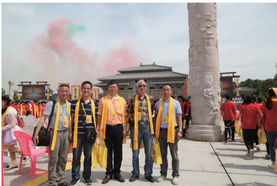
参加 2015 随州炎帝祭祀大典