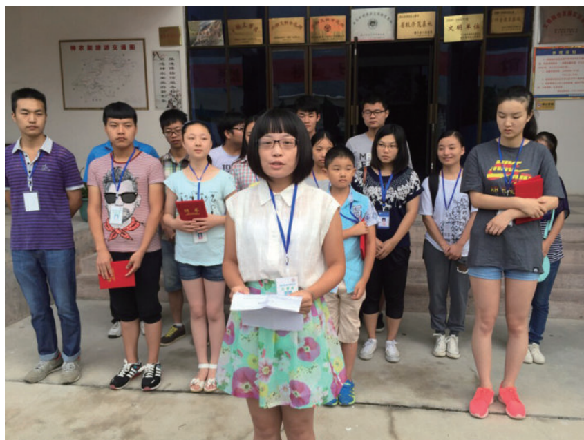
博物馆小小讲解员