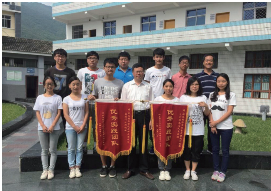
湖北经济学院赴神农架暑期大学生实践团队