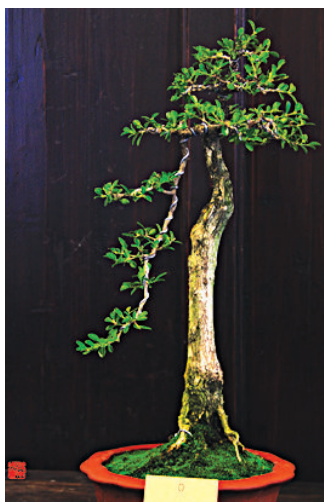
图 1-2-8 苏派盆景（二）

痕，富有艺术情趣。在处理虚实、曲直、疏密、开合、明暗等关系上，脉理清晰，独具匠心。它以浓郁的生活气息及原始的自然美强烈地感染着人们，呼吁人们热爱自然，增强了人们保护、尊重自然的意识。