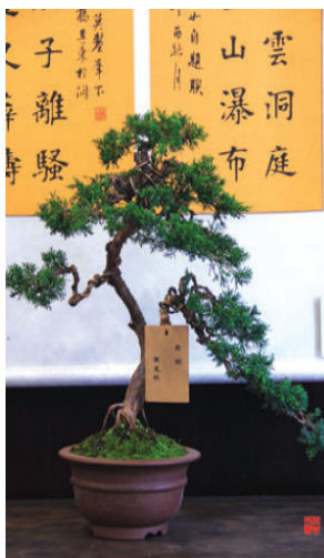
图 1-2-7 苏派盆景（一）