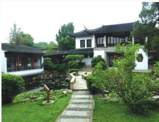
图 1-2-6 启园（二）

启园位于苏州西南的东山太湖之滨。她背山面湖，占地70亩，是苏州所有园林中唯一一座依山而筑、傍水而建的园林。整个园林中，四面厅、复廊、转湖、假山、新楼构图均衡，十分和谐。为江南少有的山岳湖滨园林，集江南园林的小巧雅致和湖光山色于一体。