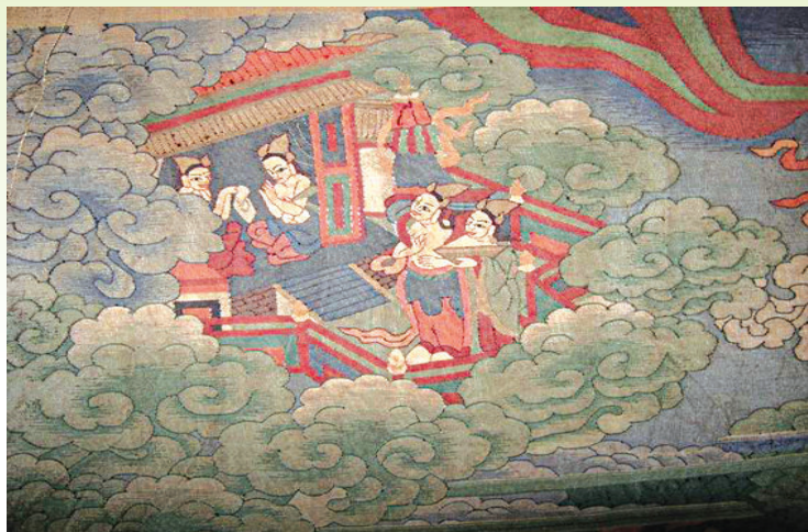
图 1-2-3 缙丝工艺品

缙丝的织造技法为：结、攒、勾、戗、绕、盘梭、子母经、押样梭、押帘梭、芦菲片、笃门门、削梭、木梳戗、包心戗、凤尾戗等，技法众多。但无论做什么缙丝品，结、攒、勾、戗这四个基本技法是绝对不可少的。