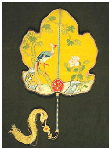
图 1-2-2 缛丝扇

缛丝的工艺流程，一般有 16 道工序：落经线、牵经线、套箱、弯结、嵌后轴经、拖经面、嵌前轴经、捎经面、挑交、打翻头、箸踏脚棒、扞经面、画样、配色线、摇线、修毛头。