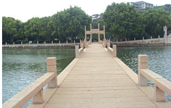
图 1-2-5 御码头

启园，原为席启荪的私家花园，坐落在东山东部的杨家湾附近，俗称席家花园，是一处始建于民国时期的中国古典园林建筑。1984年，启园被国务院批准为太湖风景名胜区主要景点之一，经政府多次拨款整修扩建，才具今日之风貌。