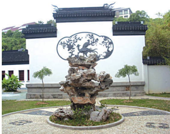
图 1-2-4 启园（一）