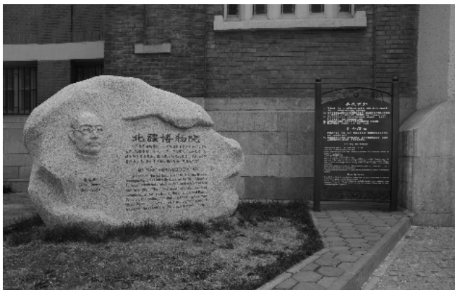
北疆博物院前门石刻介绍

从 1914 年开始,促使桑志华下定决心前往中国北方各地进行考察旅行,并在天津创立一个博物馆的动机。