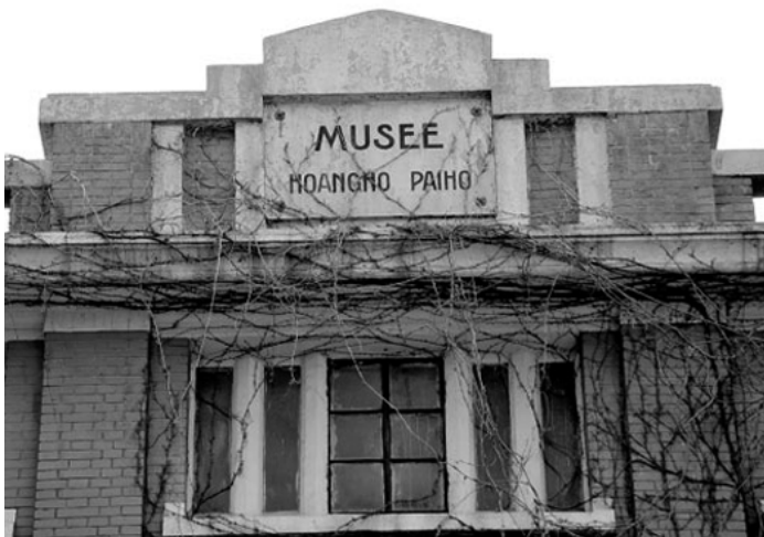
北疆博物院法文名称

北疆博物院究竟是怎样的一座博物馆?“她”为什么会成为世界一流的博物馆,又是怎样成为的一流博物馆呢?就让这本书带您走进“她”、了解“她”。