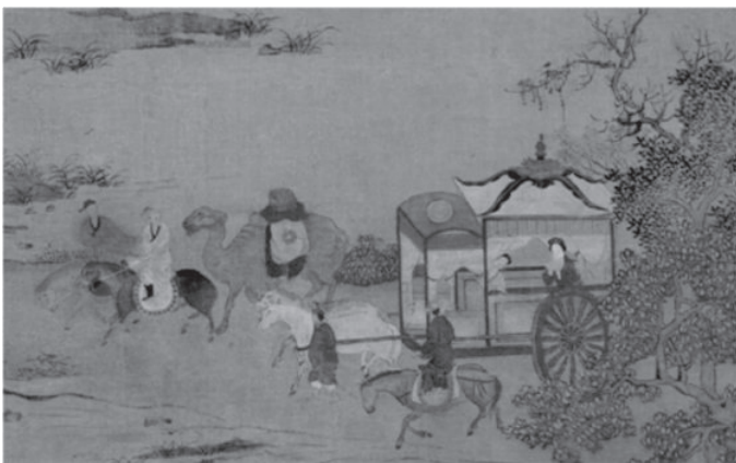
[明]王行《昭君出塞图》(局部)

在对待匈奴问题上,汉朝采取了另外一种政策:“和亲”。公元前 220 年,高祖刘邦领兵 32 万进攻匈奴。匈奴冒顿单于故意匿其精锐,示其羸弱,将汉军诱至平城,然后将其围于白登山,这就是历史上著名的“白登之围”。后来汉高祖刘邦采纳陈平秘计,方得突出重围,虽化险为夷,但损失非常惨重。白登之围后,匈奴势力日益强盛,对西汉政权构成了严重的威胁。汉高祖刘邦苦于无法对付匈奴,求计于建信侯刘敬,刘敬向刘邦提出了“和亲”之策。西汉对匈奴的“和亲”有 5 次,其中最为著名的就是“昭君出塞”。公元前 34 年,匈奴呼韩邪单于南迁至长城外的光禄塞下,向汉元帝请求和亲。王昭君听说后请求出塞和亲。她到匈奴后,被封为“宁胡阏氏”(阏氏,音焉支,意思是王后),寓意她将给匈奴带来和平、安宁和兴旺。后来呼韩邪单于在西汉的支持下控制