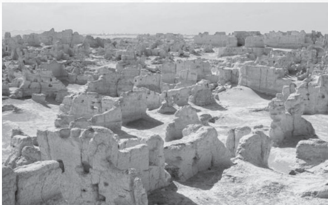
唐北庭都护府遗址

以北 600 里,将漠南收入版图。646 年又灭了薛延陀汗国,北至贝加尔湖的大漠南北全入唐版图。于是在漠北设安北都护府(627 年置燕然都护府于乌加河北,663 年移治回纥本部土拉河畔,改称瀚海都护府,