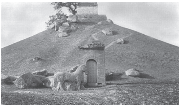
1914 年法国人拍摄的霍去病墓

汉武帝继位后，在其前四十年（前 140—前 100）内不断向外扩展疆土。公元前 127 年汉将卫青出击匈奴，收复了陇西、北地、上郡的北部，还收复了河南地，使北边疆界达阴山以北。公元前 111 年又平南越，以其地置南海、郁林、苍梧、合浦、交趾、九真、日南、象 8 郡。次年又跨海于海南岛上置珠崖、儋耳 2 郡。以上 10 郡包括今两广地区和越南北部，较秦时更为扩展。