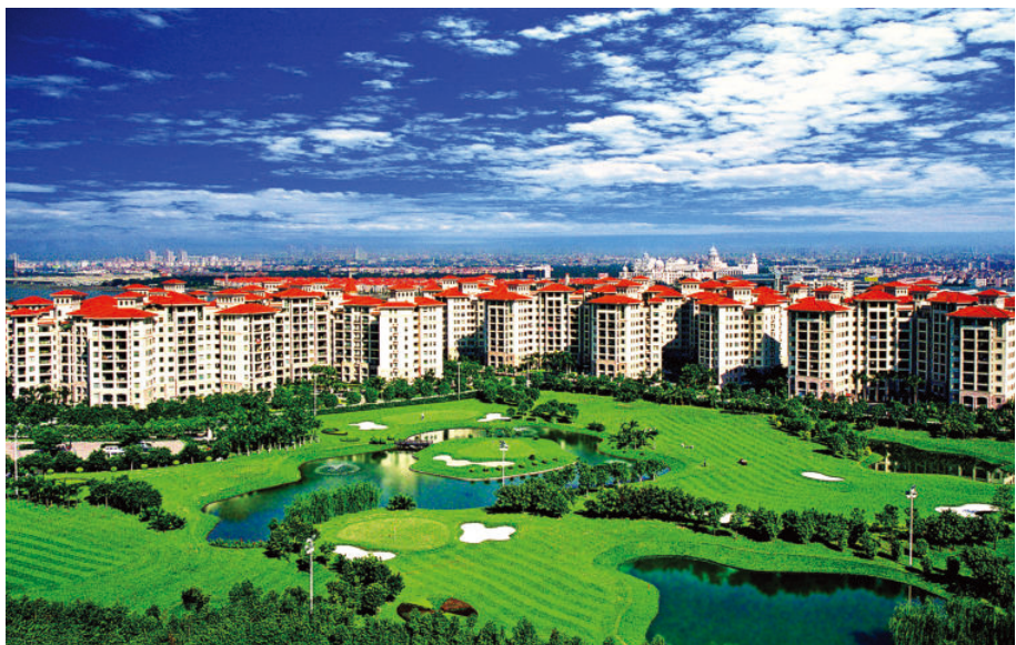
番禺房地产业发达，图为星河湾楼盘