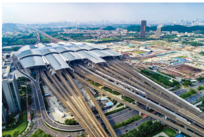
位于石壁街的广州南站商务区