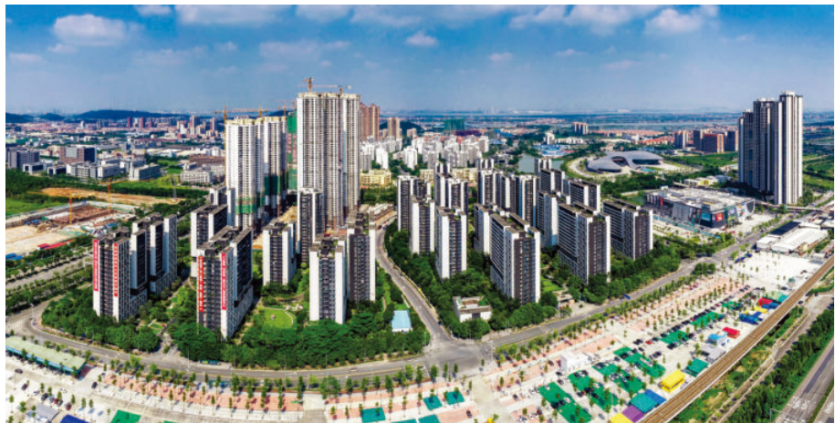
广州成功举办了2010年亚运会，坐落在番禺石碁镇和石楼镇的亚运城在亚运会后成为商品房