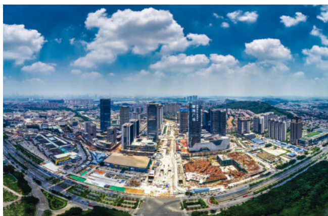
位于南村镇的万博商务区