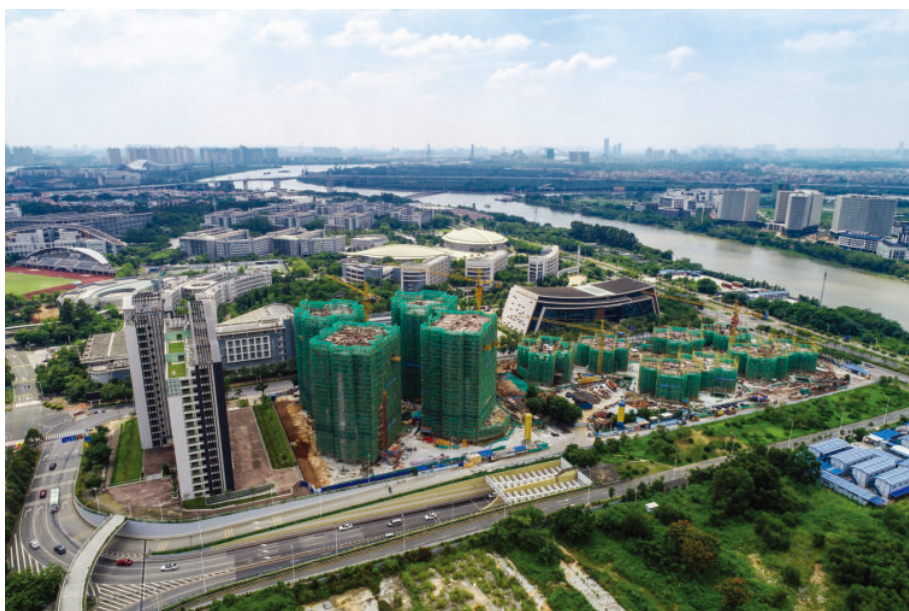
广州国际科技创新城