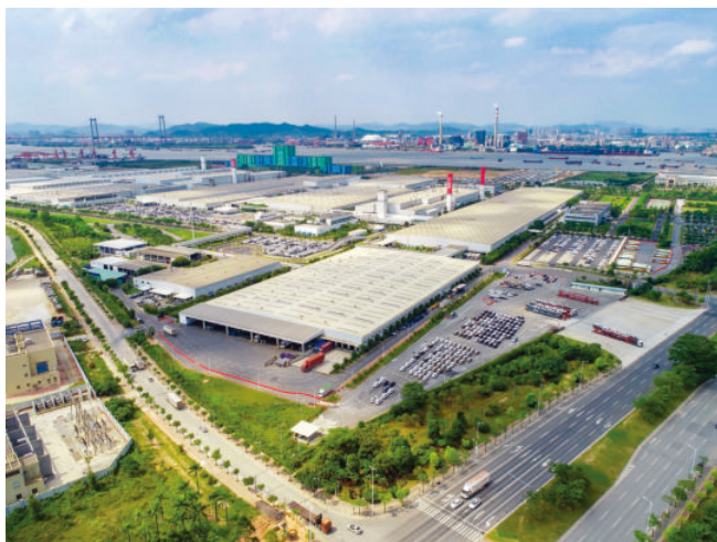
位于化龙镇的番禺汽车城