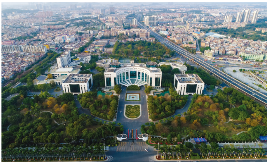
面貌日新月异的番禺城区