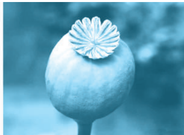
罂粟——美丽的花朵和可爱的果实