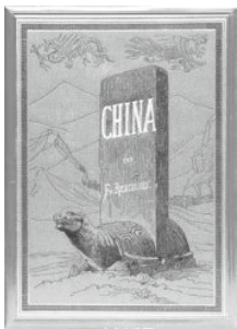
德国地理、地质学家 李希霍芬及其著作 《中国》。