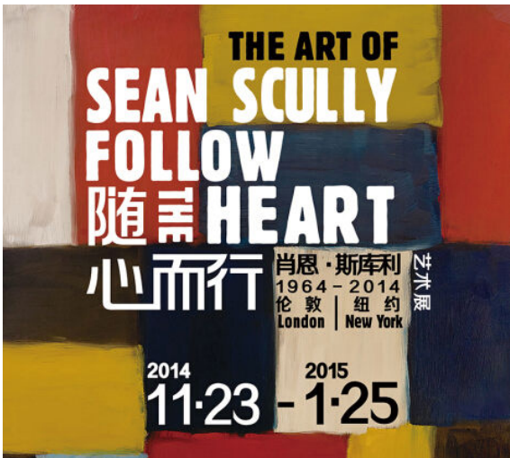
上海喜玛拉雅美术馆“随心而行：肖恩·斯库利艺术展 1964-2014 伦敦 | 纽约”海报