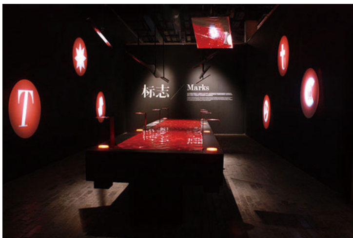
IGDB logo 设计及 2013 年 IGDB 7 展览现场