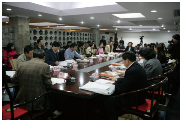
上：2009 年 4 月长三角美术馆协作机制会议

有媒体曾报道，长三角地区中小型美术馆尝试发展新途径、新突围——抱团前进。这实际上只看到了此中合作的肤浅一面。首先从长三角地区各美术馆地域分布看，各馆都位于经济文化发达、思想观念活跃地区，而且历史文化底蕴深厚，不必担心馆的生存与发展，根本不必抱团，抱团也没有任何可一争高下的目标对手。其次，真正的抱团也缺乏共同财力、人力支撑机制。长三角美术馆的协作是馆长们的一种现实忧患与历史承诺，是一种求小同存大异的尝试，是馆长们希