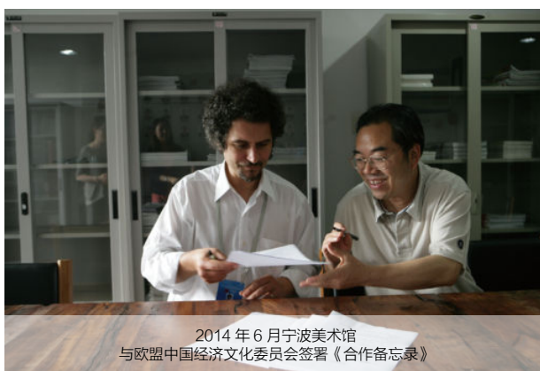
2014年6月宁波美术馆 与欧盟中国经济文化委员会签署《合作备忘录》