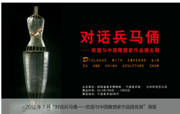
2012年7月“对话兵马俑——欧盟与中国雕塑家作品提名展”海报