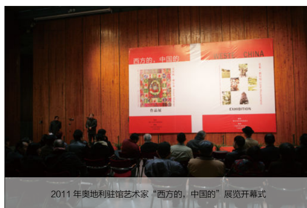
2011年奥地利使馆艺术家“西方的，中国的”展览开幕式