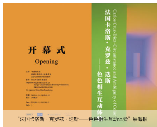
“法国卡洛斯·克罗兹·迭斯——色色相生互动体验”展海报