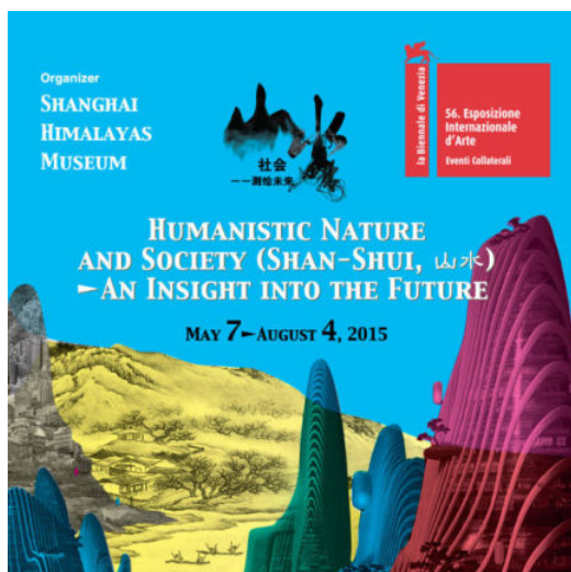
左：上海喜马拉雅美术馆“山水社会——测绘未来 | 第56届威尼斯双年展（平行展）”海报 右：上海喜马拉雅美术馆“山水社会——测绘未来（北京站）”海报