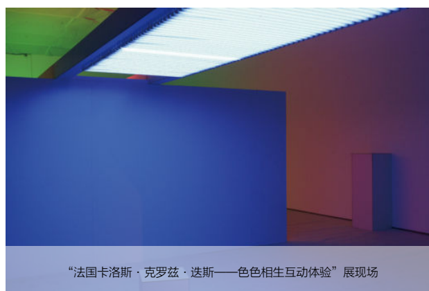
“法国卡洛斯·克罗兹·迭斯——色色相生互动体验”展现场