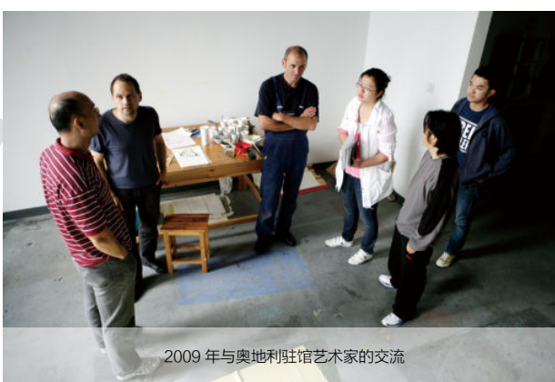
2009年与奥地利使馆艺术家的交流