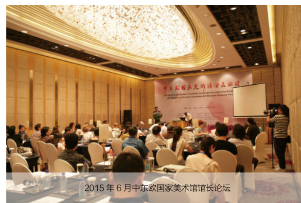
2015年6月中东欧国家美术馆馆长论坛