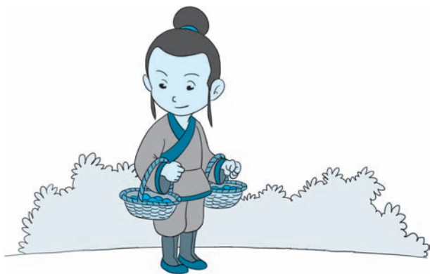
图 1-1 蔡顺提桑葚

一个十来岁的孩童，都懂得处处体恤母亲，自己却干着天理不容的勾当令父母蒙羞。盗贼听了蔡顺的话，心中非常愧疚。他非但没有为难蔡顺，反而馈赠牛羊给蔡顺，但蔡顺却不想受不义之财，坚决拒绝了。