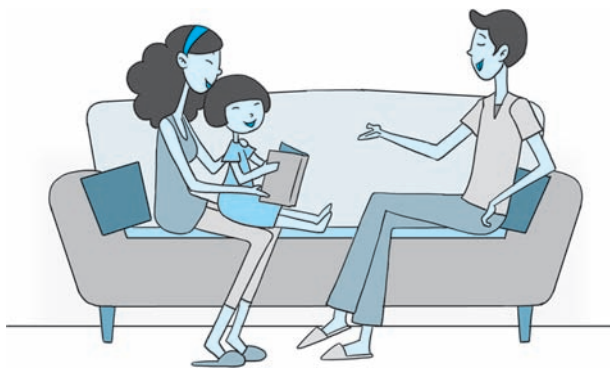
图 1-6 让爱住我家