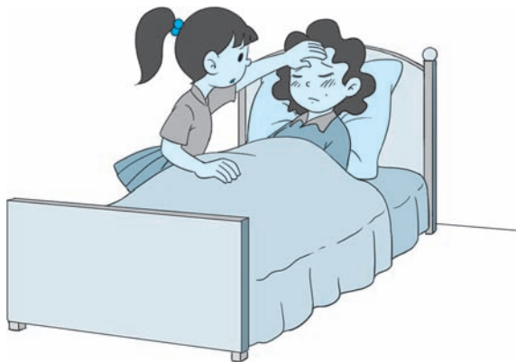
图 1-3 妈妈生病了