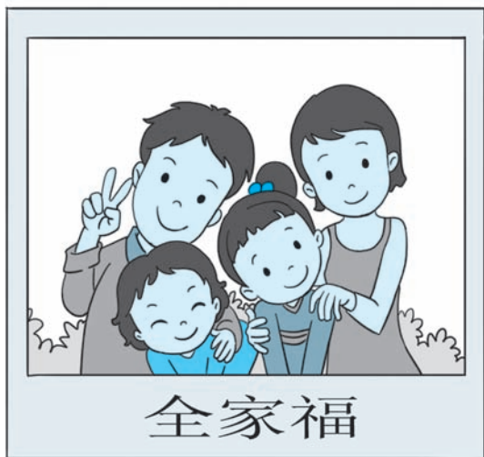
图 1-2 全家福

朝夕相处，你和父母难免有冲突，不要一味顶撞他们，双方各执一词反而更难解决问题。应该换位思考，理解他们的高标准严要求源于对你成龙成凤的渴望。