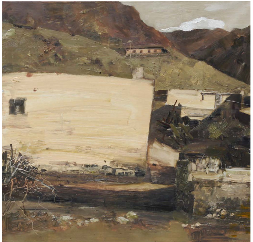
远方的云 60cm×60cm 布面油画

4. 每年新学期开学的时候都在为新生准备着上了十几年的“新”课程，我一直在想一个问题每届学生的情况不同，学生变了，而我没变。我还能像往年那样上课吗？教室里学生和我都在画画，画各种不同的只属于自己的作品，从节奏、韵律、韵味一直上升到作品的格调，每个人都在自由地分析并体察内化那画面的矛盾。我一直凭借着对教师这个职业的崇敬，从来没把自己当成画家，而是追求着一种朴素、简单、纯真的心境，不断地追问自己的生活、工作和艺术。我常自省：到现在我都认为还有许多东西没达到，一种“格”的状态没有实现，这都和自己的修养有关。