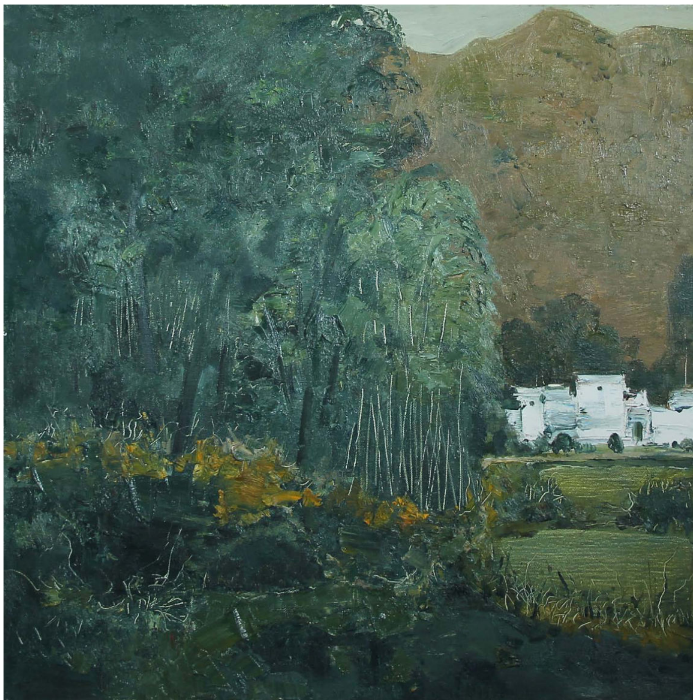
宏村秋色 No. 4