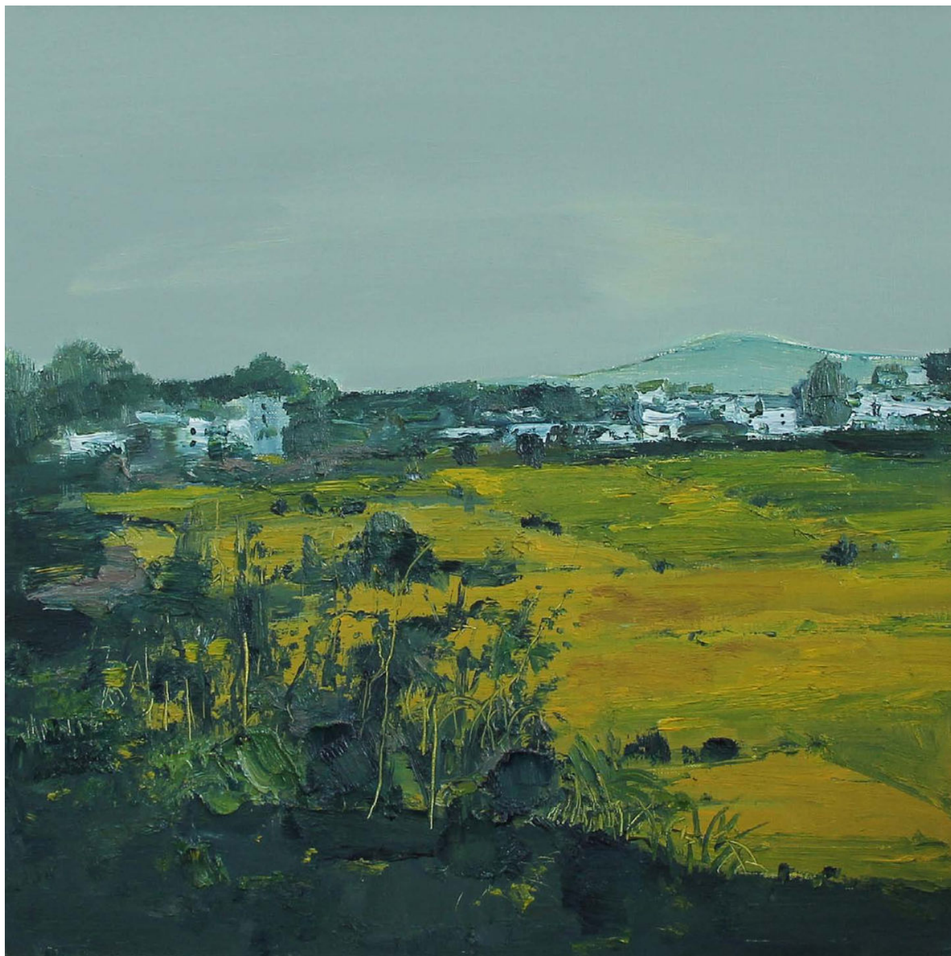
宏村秋色 No. 1