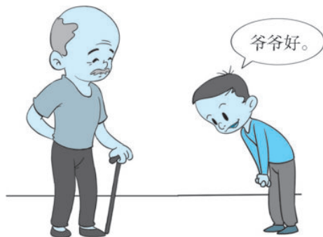
图 1-2 向爷爷问好