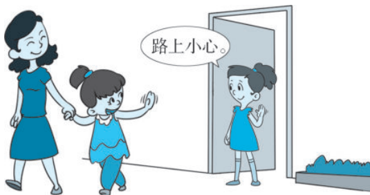
图 2-1 送客礼仪

shān shān xīn xiǎng xiǎo xuě yí dìng è 珊珊心想，小雪一定饿 le biàn duān lái shuǐ guǒ hé bǐng gān yì 了，便端来水果和饼干一 qǐ fēn xiǎng 起分享。