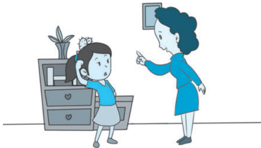
图 2-3 学会换位思考

lián xiàn yóu xì xuǎn chū zhèng què de xíng wéi bìng hé zhōng jiān de xiào liǎn lián xiàn 连线游戏：选出正确的行为，并和中间的笑脸连线。