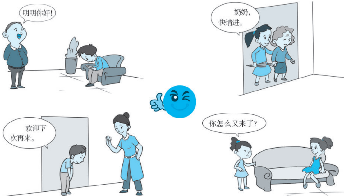
图 2-4 连线游戏