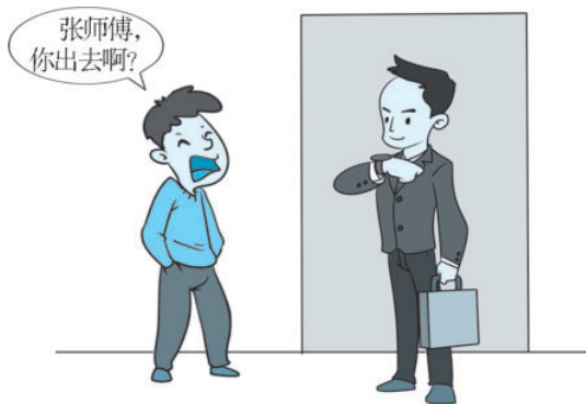
图 1-1 这样称呼对吗

dōu bù lǐ rén le xiǎo chén gǎn dào hěn nà mèn er kě xiǎng le hǎo jǐ tiān yě méi nòng 都不理人了。小陈感到很纳闷儿，可想了好几天也没弄