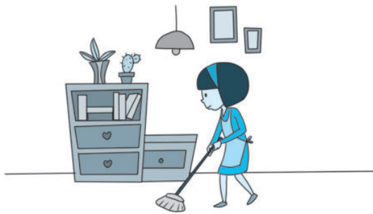
图 2-2 客人到来前

rú guǒ lái fǎng de shì fù mǔ de péng you xiǎo zhǔ rén zài yíng jiē wán kè rén zhī hòu yīng 如果来访的是父母的朋友，小主人在迎接完客人之后，应