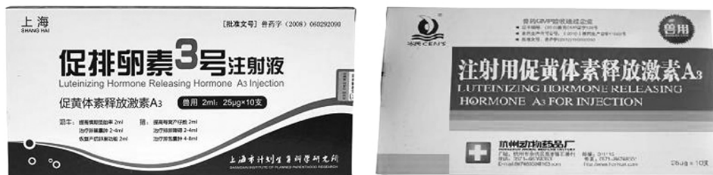
图 1-2 GnRH 类似物

临床上常用于治疗雄性动物性欲减弱、精液品质下降、雌性动物卵泡囊肿和排卵异常等症。目前,人工合成的 GnRH 类似物已广泛应用于畜牧生产和兽医临床以提高家畜的繁殖力,其中以促排 3 号的活性最高(图 1-2)。