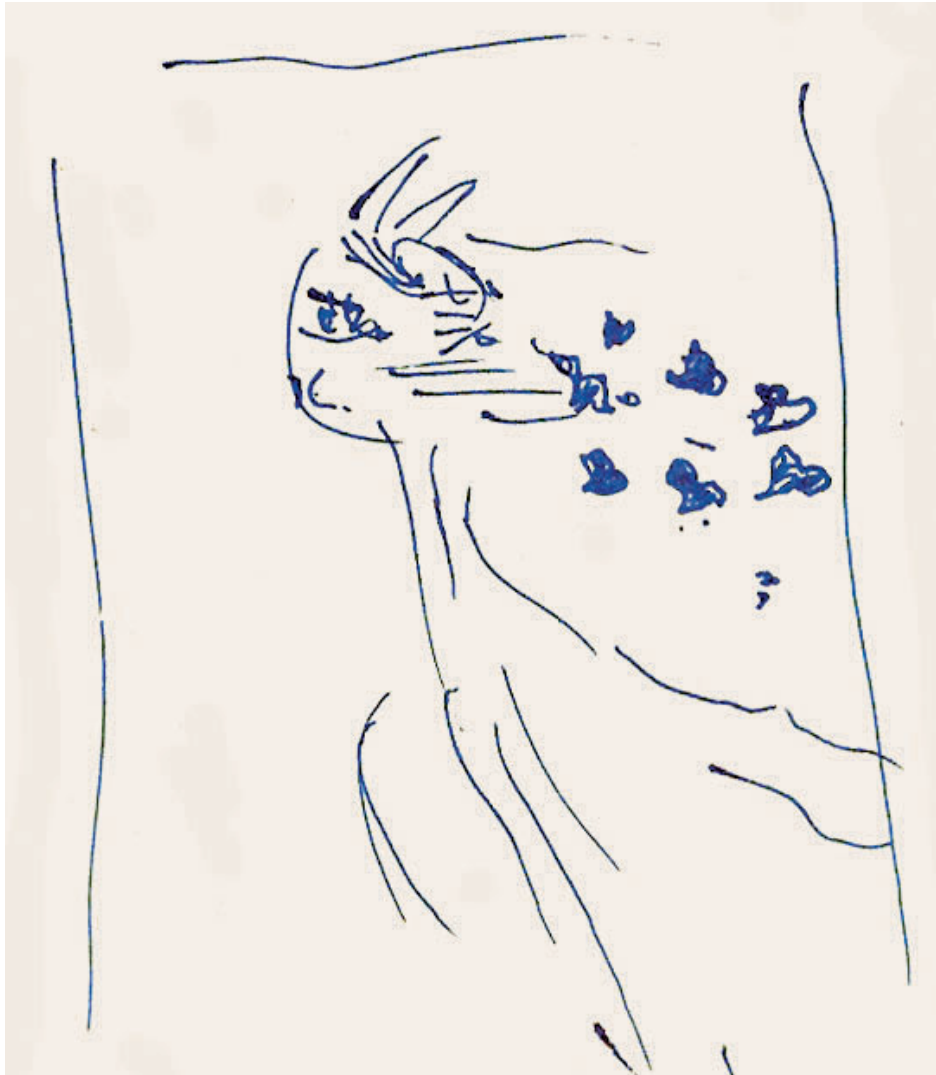
名称：《手稿线2》 类型：速写 时间：2010年 材料：水笔