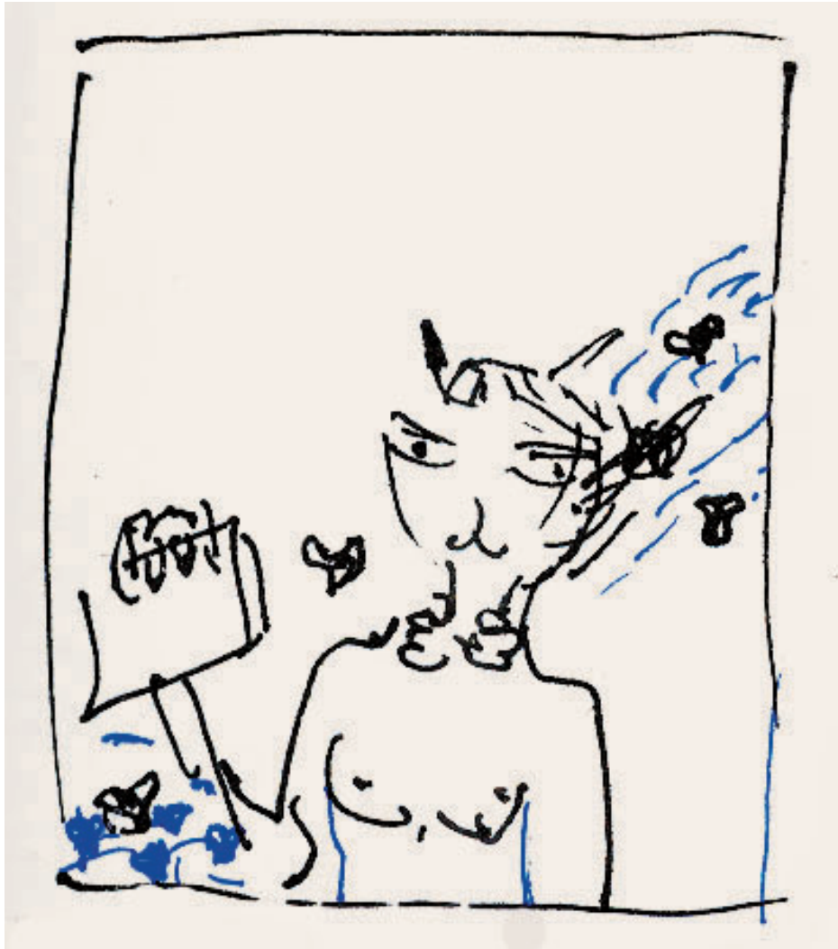
名称：《手稿线1》 类型：速写 时间：2010年 材料：水笔