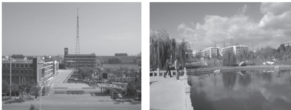
图 1-1 校园景色

平度职业教育中心创建于1979年,是一所融中等职业教育、3+2 高等职业教育、远程开放教育于一体的综合性学校。学校共设两个校区:主校区位于青岛路与福州路交界处,平度地标——铜牛西南侧;分校区在崔召,两个校区相距约10千米。