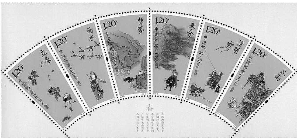
◎《二十四节气（一）》邮票（2015年2月4日）