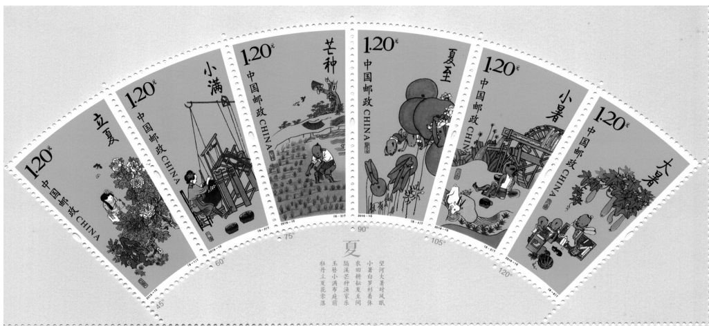
◎《二十四节气（二）》邮票（2016年5月5日）