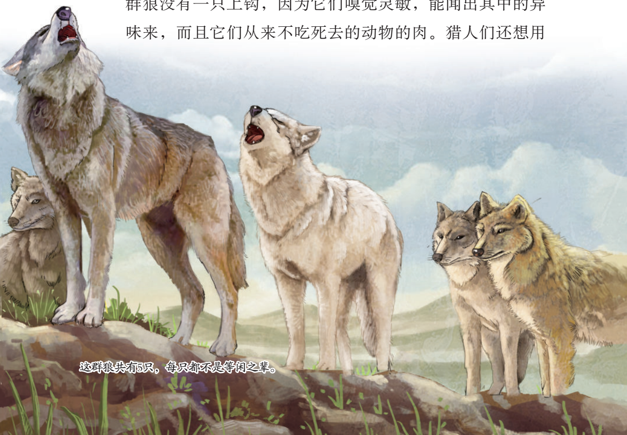
这群狼共有5只，每只都不是等闲之辈。

猎人们用放了毒药的新鲜牛肉来引野狼上钩，可是这群狼没有一只上钩，因为它们嗅觉灵敏，能闻出其中的异味来，而且它们从来不吃死去的动物的肉。猎人们还想用