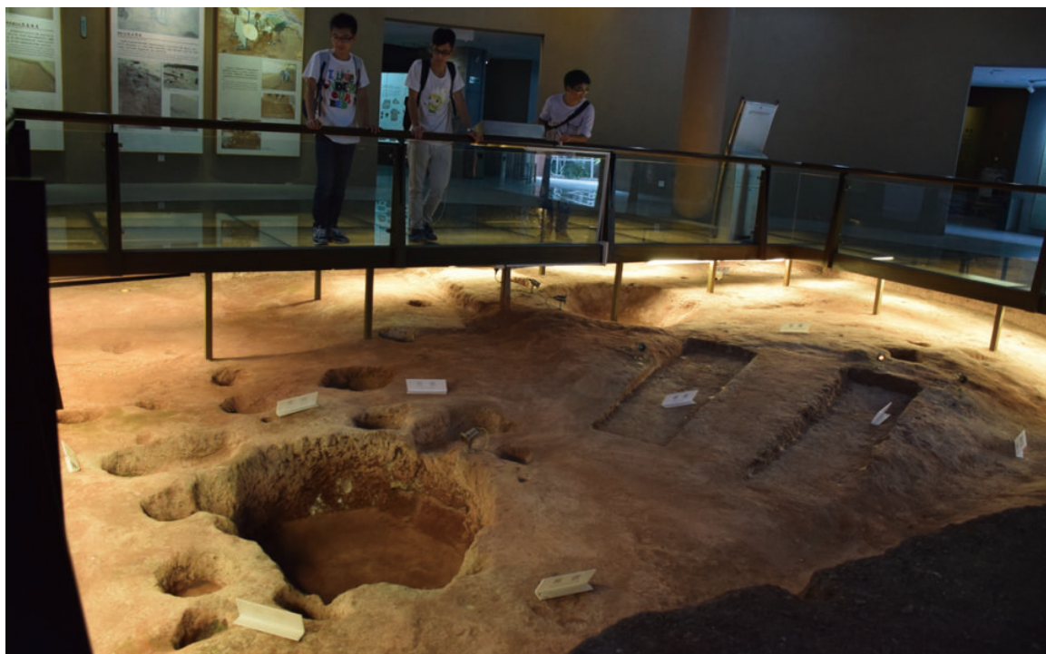
◎ 蚝岗贝丘遗址（东莞） Human remains at Hao Gang Bei Qiu, Dongguan (Dongguan)