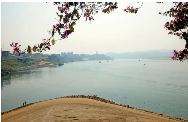
◎ 珠江（肇庆封开） The Pearl River (Fengkai, Zhaoqing)