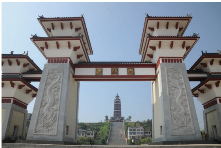
◎ 广信塔（肇庆封开） Guangxin tower (Fengkai, Zhaoqing)

西江、贺江横贯其中的肇庆封开县，曾是岭南与中原地区经济、文化交流之要地，是岭南文化的发祥地、海上和陆上丝绸之路交汇点。据史料记载，公元前 111 年，汉武帝在岭南设交州，下辖两广及交趾（今越南）地区，刺史府就设在封开，使这里成为整个岭南地区最早的首府。封开在汉初取名广信，至宋代将广信以东划为广东，广信以西划为广西，广东广西由此得名，广州之名也都源于此。历史上还有一批出类拔萃的人物，如王莽的老师——汉代开岭南经学之先的陈钦、陈元父子，岭南第一个状元莫宣卿，封州刺史刘谦，南海王刘隐，南汉开国之君刘龚等。