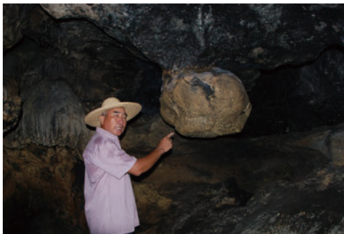
◎ 阳春独石仔古人类遗址（阳江） The ancient human remains at dushizhai, Yangchun (Yangjiang)

东莞南城胜和社区的蚝岗贝丘遗址距今已有5000年历史。该遗址于20世纪80年代发现，属新石器时代贝丘遗址。尤为可贵的是，在遗址新石器文化层中出土了两具保存十分完整的古人类遗骸，其中一具经测定，为距今5000多年的中年男性遗骸，这也是在珠三角迄今为止发现年代最早的古人类遗骸。该遗址为全国重点保护文物单位。