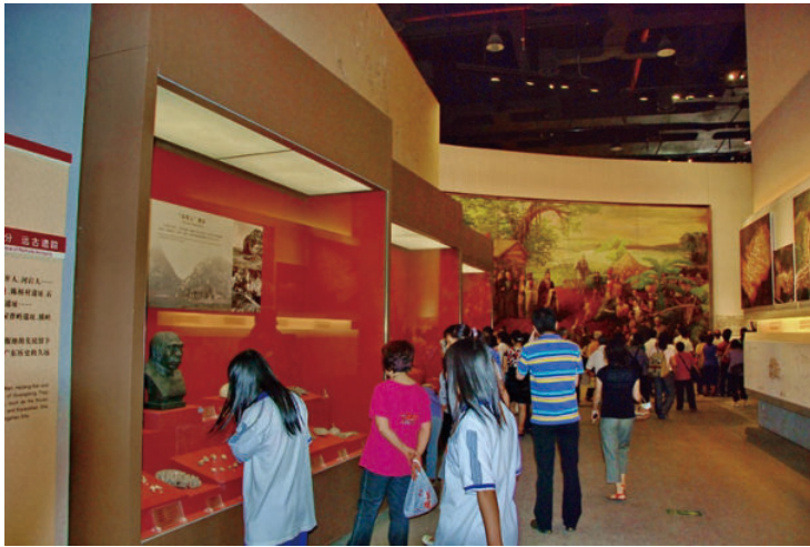
◎ 广东省博物馆（广州） Guangdong Provincial Museum (Guangzhou)

广东省博物馆 1959 年建成并正式对外开放。新馆在广州新城市中轴线——珠江新城中心，以“珍宝容器”为建筑设计方案，于 2010 年建成，是广东省唯一的省级综合博物馆，也是国家一级博物馆。其陈列展览以广东历史文化、艺术、自然为三大主要方向，常设展览有广东历史文化陈列展览、广东省自然资源展览、潮州木雕艺术展览、馆藏历代陶瓷展览、紫石凝英——端砚艺术展览等，通过文物、图片、油画、雕塑、模型、多媒体、复原场景等展陈手段，全方位多角度地展示广东的历史文化变迁。