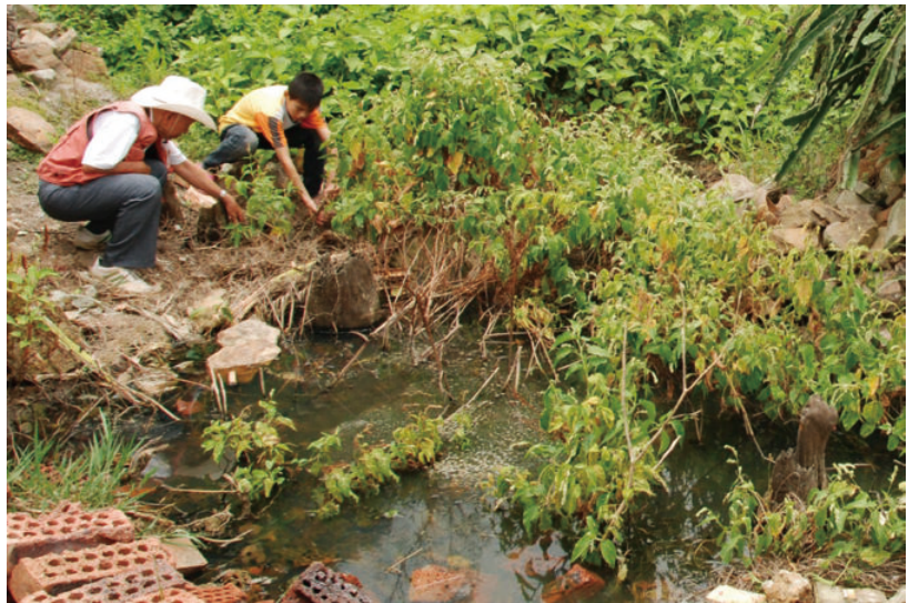
◎ 茅岗水上建筑遗址（肇庆高要） Ruins of wooden structures on the water of Maogang (Gaoyao, Zhaoqing)

水上木构建筑遗址，位于肇庆市高要区金利镇茅岗管理区石角村，于 1978 年 10 月被发现，面积约 1000 平方米，贝壳堆积约厚 1 米。在堆积物之下，考古专家先后按挖出 1000 多件文物，其中木桩数十支，并有人骨、陶器、竹器、石器、骨器、竹篾编织器等。该遗址为广东省首次发现的水上干栏式木构建筑遗址，具有重大历史研究价值，为广东省文物保护单位。