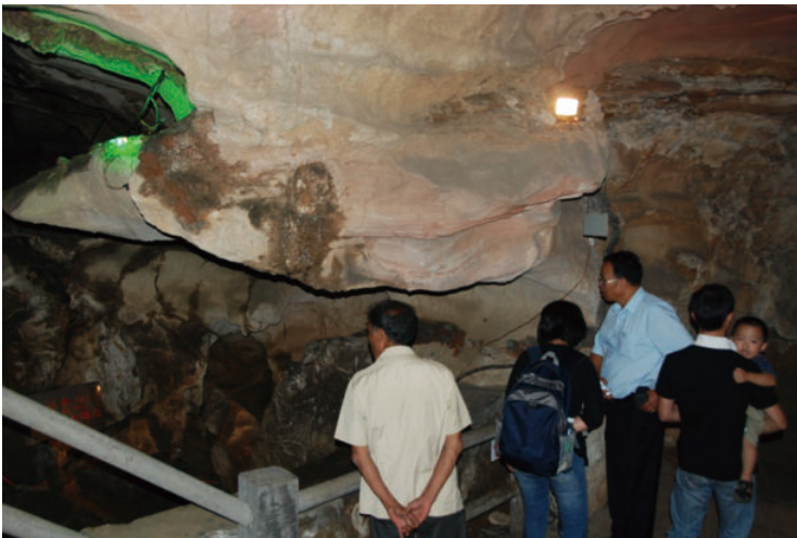
◎ 马坝人遗址、石峡遗址 (韶关曲江) Maba Man hominid site in Qujiang, Shaoguan (Qujiang, Shaoguan)

洞中岩位于肇庆市封开县渔涝镇河儿口村北面，洞口高15米，年代为旧石器时代中期。考古学家通过铀系法测定时期为距今14.8万年 \pm 1.3万年。1978年，在山峰坡上的洞中岩洞的堆积物中发现了一颗人类的牙化石。1989年，考古专家再次对该洞进行挖掘，又挖掘出两颗人类牙化石，测定年代为12.9 \pm 1.0万年。因此可知，洞中岩人要比马坝人早2万年左右。