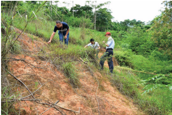
◎ 探秘4000年前普宁虎头埔窑址（普宁） Probing into the Kiln site of Hutou Pu in Puning 4,000 years ago (Puning)

普宁广太镇绵远村虎头埔窑址，面积近 10000 平方米，年代为距今 4000 年的新石器时代晚期，是广东省迄今为止发现的年代最早、数量最多、结构最清晰的古窑群遗址。1982 年考古专家从该窑址发掘清理了 15 座陶窑，出土了大量的印纹陶片，被誉为“广东第一窑”，在远至珠江三角洲和福建境内也发现虎头埔类型的陶器陶片。由此可知，这里的陶器生产（手工业）已相当发达，商品交换已相当活跃，推翻了“粤东地区是蛮荒之地”的观点，证明了该地区在新石器时期就有了先进文明，是潮汕历史文化发祥地。该窑址为广东省文物保护单位。