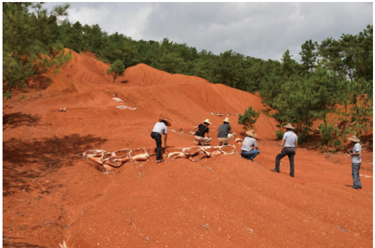
◎ 郁南磨刀山遗址（云浮） A probe into the human remains at Modao mountain (Yunan)

郁南磨刀山遗址位于云浮市河口镇和都村，是南江旧石器地点群中一处典型遗址，是旧石器时代早期的文化遗存，出现的时代早至中更新世，填补了岭南地区 60 万年至 80 万年前人类活动遗迹的空白，证明了广东有人类活动的历史年代比“马坝猿人”早数十万年，与北京猿人同期，是华南史前考古研究的重大突破，也是中国旧石器考古学研究的重大进展，对于研究区域人类演化历史与旧石器文化发展具有重要意义。该遗址与南江旧石器地点群入选 2014 年度全国考古十大发现（名列第一），为全国重点文物保护单位。