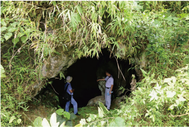
◎ 河儿口洞中岩 (肇庆封开) Dong Zhong Rock at Heerkou (Fengkai, Zhaoqing)