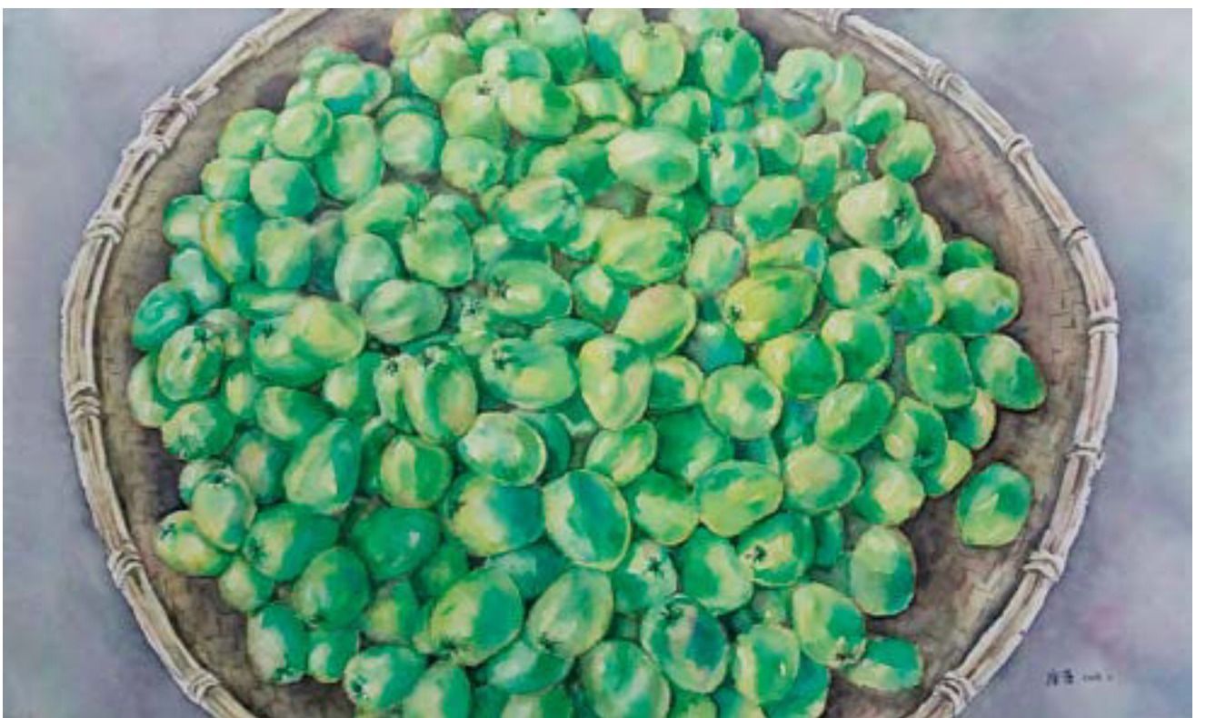
青枣 33cm × 54cm