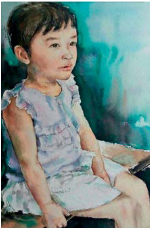
三岁 54cm × 38cm