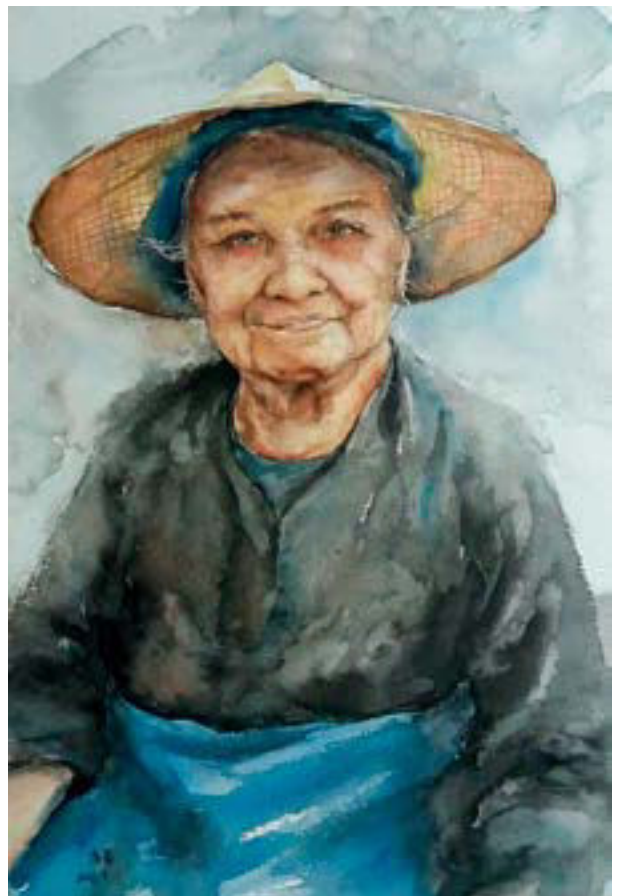
买玉米的老人 54cm × 38cm