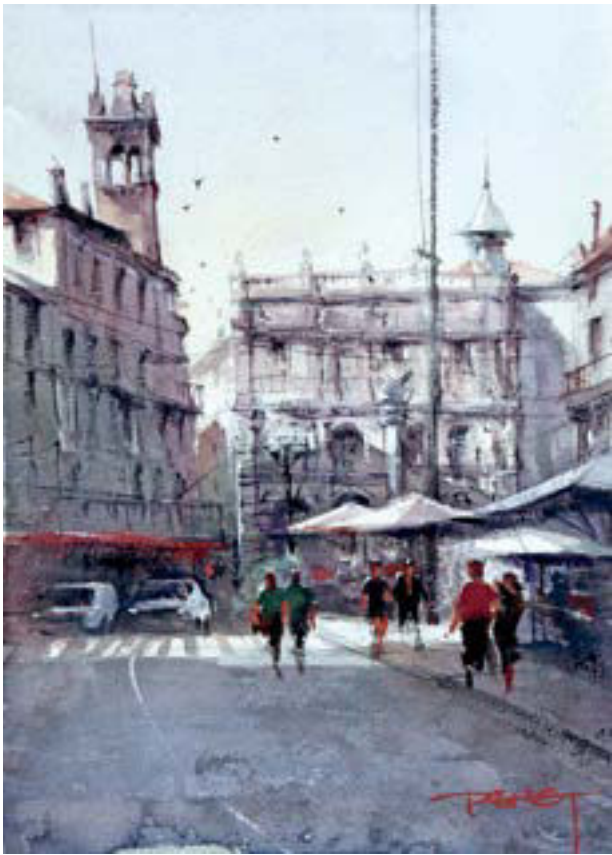
维罗纳 - 集市广场 38cm × 28cm