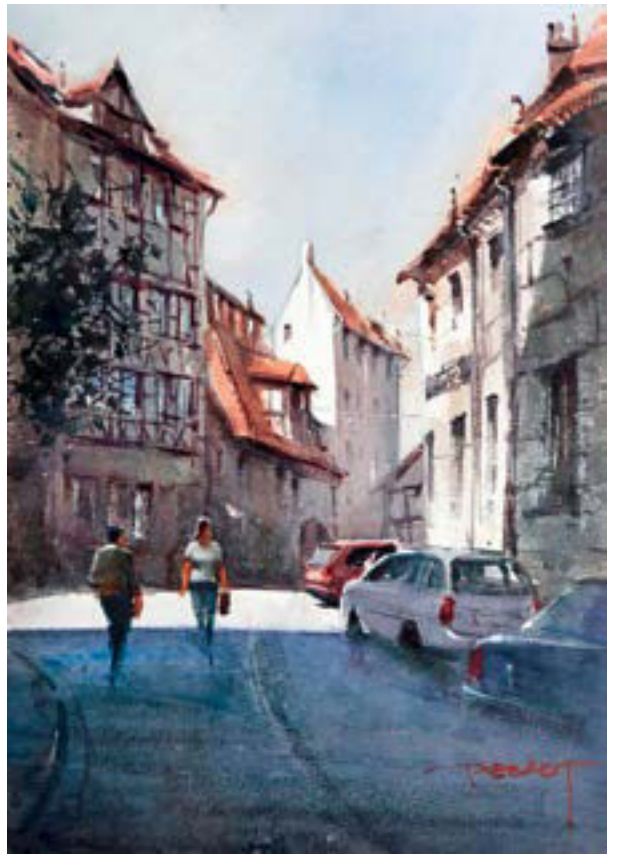
纽伦堡的街巷 38cm × 28cm