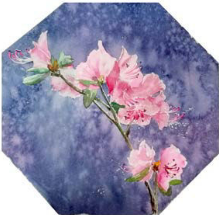
金达莱花 2 22cm × 22cm