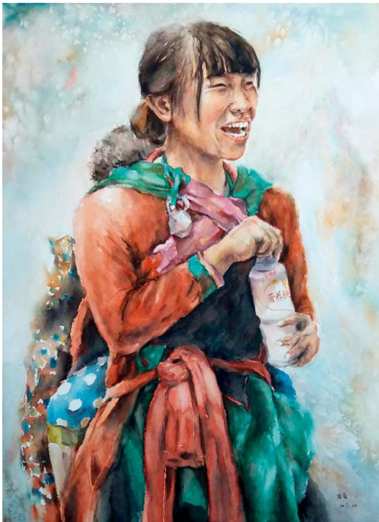
遂愿 76cm × 53cm