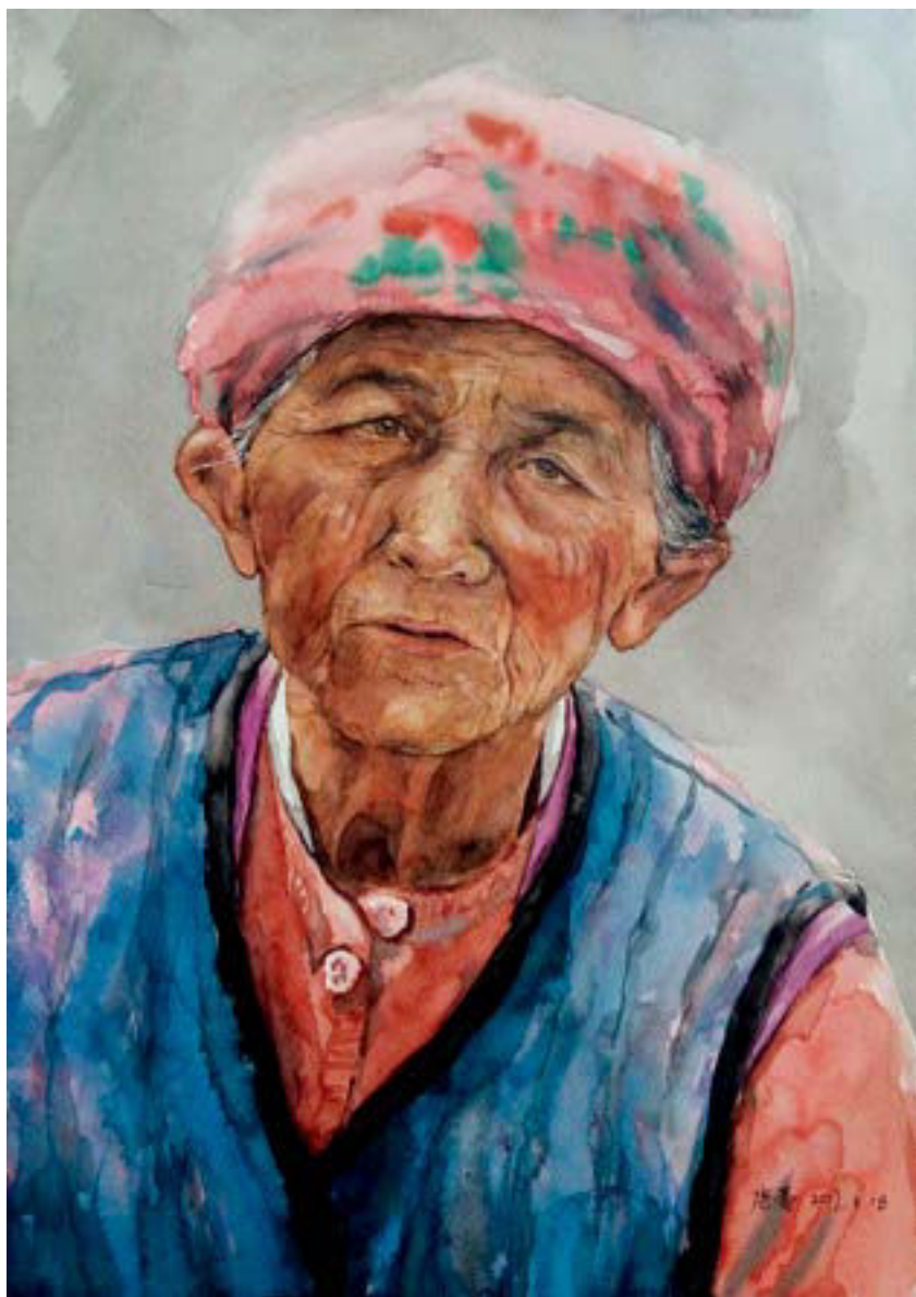
外婆 54cm × 38cm