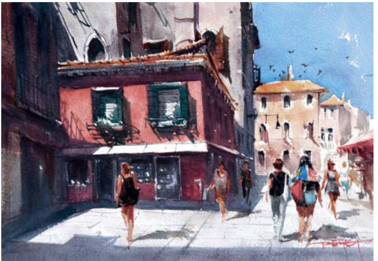
威尼斯 - 街景