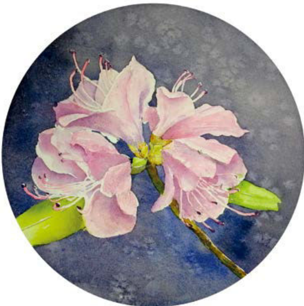
金达莱花 1 23cm × 23cm

2017年参加师生水彩展，获“新时代·新气象”作品展优秀奖；论文《水彩画中“水”的艺术》发表于《明日风尚》杂志，论文《试析水彩画的审美特征》发表于《西江文艺》杂志。