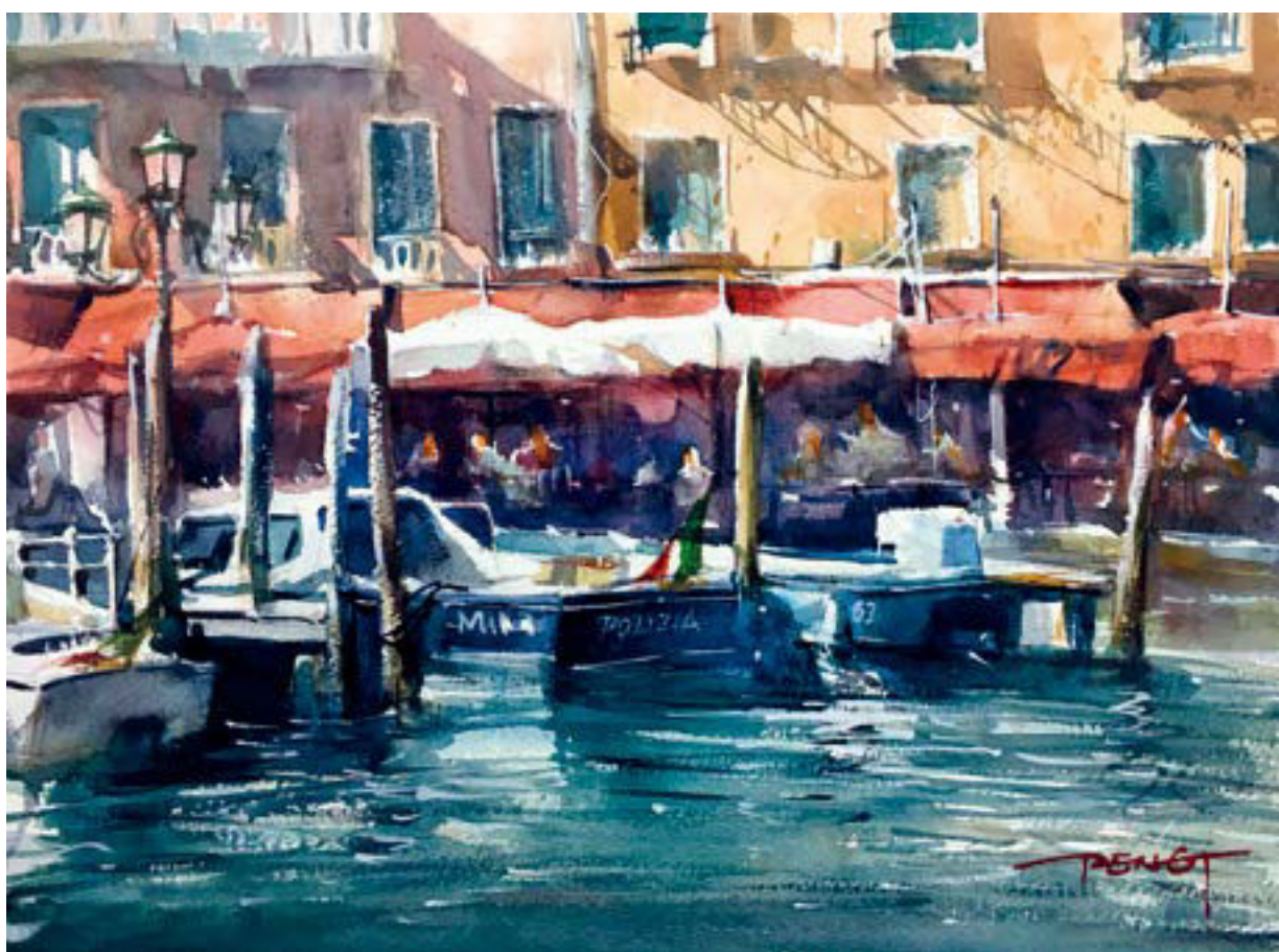
威尼斯—临水的餐厅