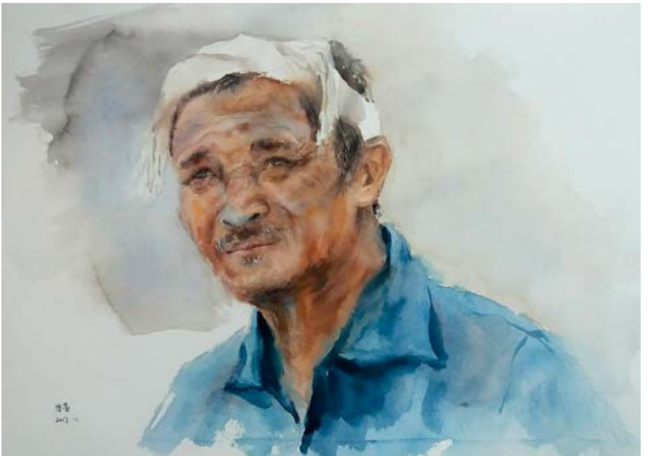
等待 38cm × 54cm