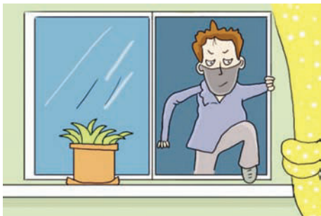
图 3-3 发现盗贼要随机应变