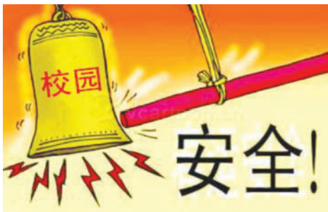
图 1-1 校园安全警钟要长鸣

随着社会的发展,大学生的生活空间和交流领域不断拓宽,同时与大学生相关的各类案件和事故也不断攀升,这些案件和事故大多是因为大学生普遍缺乏必要的社会生活知识,尤其是安全知识所致,通过安全教育,可增强大学生法制观念、安全防范意识和技能,以维护大学生生命财产安全,确保校园的安全和稳定,对培养全面发展的新型人才具有重要意义。