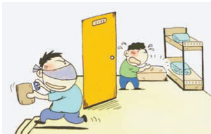
图 3-1 贵重物品妥善保管