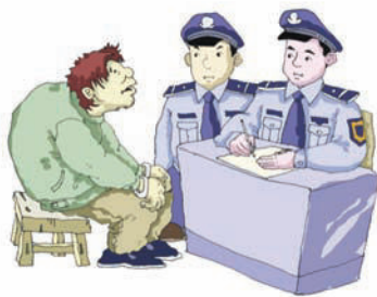
图 2-3 传销危害极大

③营销管理不同。传销的营销管理很混乱，上线推销员是通过欺骗下线推销员来获取自己的利益，采用“复式计酬”方式，即销售报酬并非仅仅来自商品利润本身，而是按发展传销人员的“人头”计算提成；直销的管理比较严格，推销员是不直接跟商品和钱接触的，自己的业绩由公司来考核，由公司进行分配。