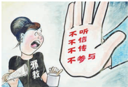
图 2-2 大学生要坚决抵制邪教

1. 邪教。指冒用宗教、气功或者其它名义建立,神化首要分子,利用制造、散布歪理邪说等手段蛊惑、蒙骗他人,发展、控制成员,危害社会的非法组织。邪教大多是以传播宗教教义、拯救人类为幌子,散布谣言,且通常有一个自称开悟的、具有超自然力量的教主,以秘密结社的组织形式控制群众,一般以不择手段地敛取钱财为主要目的。大学生要坚决抵制邪教的侵害。要提高警惕,不可因一时好奇陷入反动宗教组织编织的陷阱。避开干扰,顺利地完成大学学业。