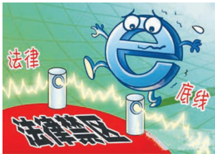
图 2-1 大学生要学法守法

所谓“非法组织”,就是没有法律依据私自成立的组织。目前我国,邪教、传销、非法集资等被纳入非法组织范畴。