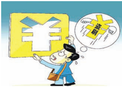
图 3-2 银行卡被盗尽快挂失