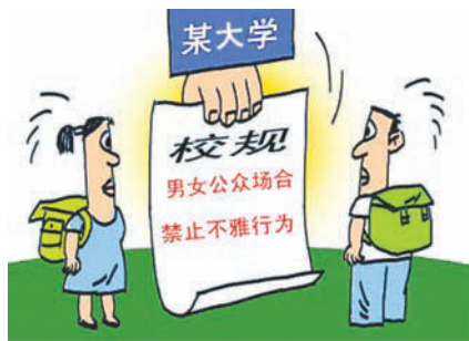
图 2-4 遵守校纪规范言行

3. 学习和遵守校纪校规，依照相关的规章制度规范自身言行，也能有效维护自身的人身和财物安全，防止各种事故的发生。