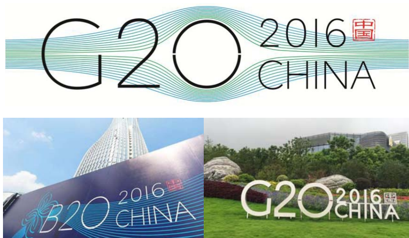
图 1.1 2016 年杭州 G20 峰会

一个简单的标志除了能给人们很多的想象空间，更重要的是能表达特殊的含义。它不仅是一个简单的符号，还包含了许多附加内容，使观者通过它的刺激了解符号包含的内在信息，达到无声胜有声的传播与沟通效果。可以说标志就像一个有着复杂含义的事物的浓缩点（如图 1.1）。