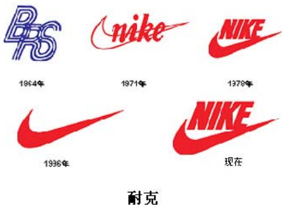
图 1.18 耐 克

据国际经济学者的评估，在国际上最强势的品牌标志形象，像“可口可乐”品牌价值达到 673.9 亿元，微软品牌价值达到 613.7 亿元；“麦当劳”品牌价值达到 250.0 亿元，超过了他们全部有形资产之总和。而国内的香港凤凰卫视标志，据专业机构评估价值达到了 228.32 亿元；还有“海尔”“春兰”“长虹”等一些强势品牌，其形象价值也达到了几百个亿的人民币无形资产值。特别是可口可乐标志形象的无形资产价值效应，已达到即使是全球的可口可乐生产厂家一夜化为灰烬，仅凭其标志形象的魅力，也可获得世界任何一家银行支持的巨额贷款而恢复重建。而世界著名的耐克公司之所以能称霸于全球运动鞋市场，更是凭借着“耐克”的标志形象这一无形资产，通过授权其他生产厂家以品牌标志形象的方式来生产“耐克”牌产品（如图 1.18、1.19）。