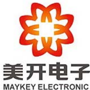
图 1.10 美开电子

标志设计要在细小范围中反映具体的艺术特征，给人以美感、动人的形象，就必须具有和谐、悦目的形象。图形美是构成标志的重要组成部分，也是设计中不可忽视的，是标志最后成败的关键。正如音乐之所以讲究节奏、旋律和音响，而后才有诗味。标志也是一样，必须讲究组织格式和运动变化，而后才有图形美。所谓图形美，并不单是外在的美，还应有意象的内在美。这是从设计构思到组织形式，善于运用构成法则的运动变化，发挥单纯的和谐美。图形美并不像一般图案那样用添枝加叶的填充式的手法。而是巧于利用结构的简化，形象的净化，强调强化和精简的艺术处理，以便产生一种特有的标志造型美（如图 1.10、1.11）。