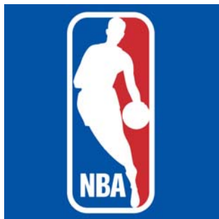
图 1.4 雅韵教育