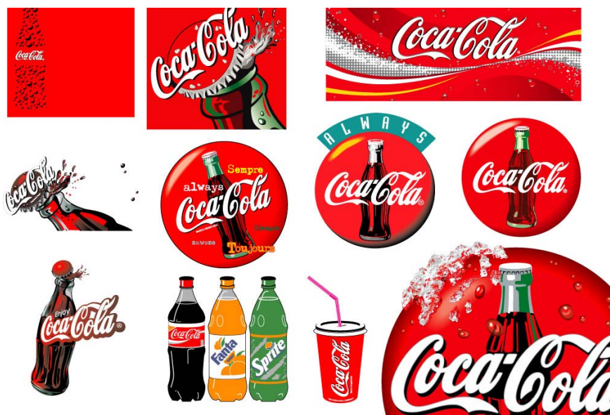
图 1.17 可口可乐标志