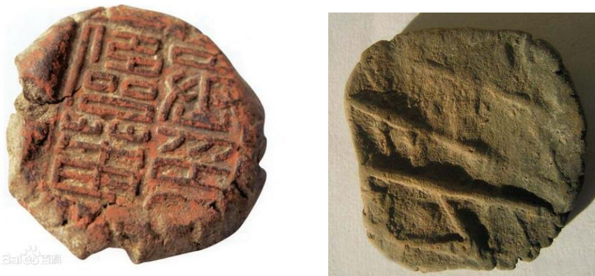
图 1.22 泥 封

古代文书都用刀刻或用漆写在竹简或木札上，封发时装在一定形式的斗槽里，用绳捆上，在打结的地方，填进一块胶泥，在胶泥上打玺印；如果简札较多，则装在一个口袋里，在扎绳的地方填泥打印，作为信验，以防私拆。这些泥块，又称泥封（如图 1.22），是我国商标产生的雏形。