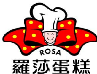
图 1.5 罗莎蛋糕