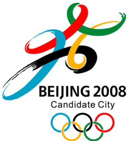
图 1.15 北京申奥标志

因此，标志品牌形象的人文表现，延伸出企业的视觉真情，表明企业积极的文化理念。标志形象的精神文化价值的特质反映，赋予了企业新的生命内涵，创造了企业新的活力，为企业树立了良好的品牌形象，使企业的社会利益得到促进与体现。