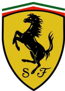
图 1.12 法拉利汽车

前者以意匠的内核为基础，后者以形象的构成为规律，两者不可缺一，否则就不成为一个好标志，也谈不上图形美。如果缺乏前者，就没有诗意般的境界，不能令人悠然神往；缺乏后者，就没有条理化的组织秩序，不能引人悦目舒畅。毫无疑问，意象是内在的，提供了普遍的现实意义；形式美是外在的，提供了形式感的具体特征。两者都是融情与景和组织形式的糅合（如图 1.12、1.13）。