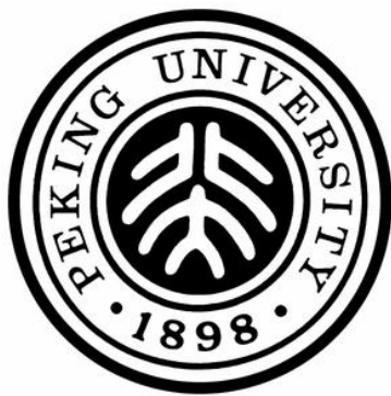
图 1.2 北京大学校徽

标志是一种符号，符号当然力求简洁。但简洁中不失意义及美观，这就是标志设计的要旨。标志设计是表明某种意义特征的记号、标记。它的表现手段是利用图形、文字构成具体可见的象征性的视觉符号，并将这一视觉符号中的内容、信息、观念传达出去，影响观者的态度、看法和情感等，从而达到树立品牌、形象的目的。标志是一种总称，它包括的范围涉及社会的各个方面，包括政府机构、学校、学术团体、工商企业、文体活动等。大到国家国徽，小到私人标记。现代社会中，标志与符号已大大扩展了它的应用范围，尤其在商业竞争中，标志本身就是信誉和质量的象征，它本身就是价值（如图 1.2、1.3）。