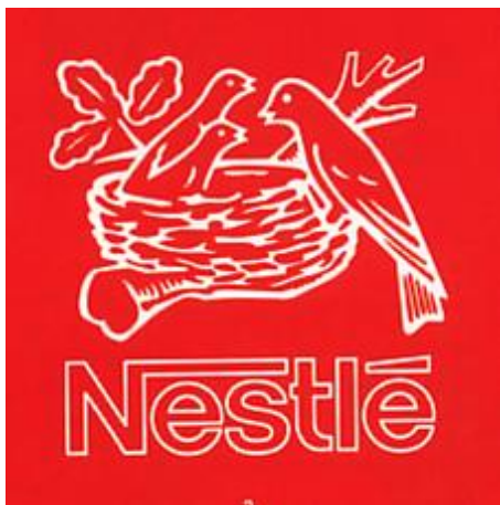
图 1.14 雀巢标志

在琳琅满目的商品市场，认牌购物是现代消费者的消费动向。标志形象是企业培育优势的品牌文化外延的重要视觉符号，是品牌文化的形象终极点。因而现代企业标志开始追求表现文化观念的设计特征，提升标志的精神文化价值，将人文因素与精神蕴含在标志设计作品理念中，让人们透过标志的品牌形象在倍感亲切的情趣影响中感悟到企业与人的亲和力。我们看到许多驰名的标志形象，均能成功地表述出企业的属性内涵、传达出企业文化理念。通过标志形象视觉语言的象征性、寓意性，来与人们的思维产生互动、互融效果，表现出他们的精神文化价值。如雀巢咖啡（如图 1.14），标志通过母鸟给小鸟喂食的形象语言，传递给人的是一份温情、关爱的精神理念魅力；世界著名的服装品牌贝纳通塑造的是“爱自然、爱人、关怀社会”的企业文化的语言形象；我国的申奥标志（如图 1.15）是一幅中国传统手工图案，即“同心结”或“中国结”，图形表现了一个人打太极拳的动感造型，强调的是世界各国人民之间的团结、合作和交流的愿望。