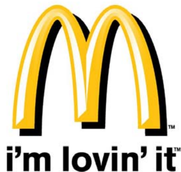
图 1.19 麦当劳标志

由此可见，品牌标志形象在企业资产中的重要性是极其显著的。可以说，一个享有美誉或具有良好形象的品牌标志，实际上就是企业的一份巨大的无形资产，它给企业带来可观的利益，在现代市场经济中已越来越显示出其重要的地位和巨大的经济价值。