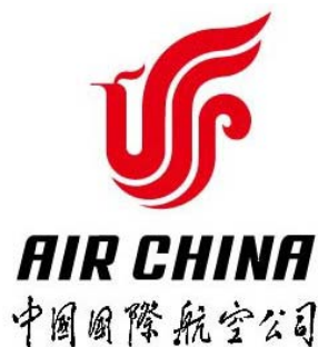
图 1.8 中国国际航空公司

标志不仅是一个符号而已，实际上标志的真正意义在于，以对应的方式把一个复杂的事物用简洁的形式表达出来。标志是设计中的“小品”，但也是设计中最难的。它具有以小见大、以少胜多、以一当十的选择性特点。标志设计通过文字、图形巧妙组合创造一形多义的形态，比其他设计要求更集中、更强烈、更有代表性。突出的表现在于设计概括的形象化，以单纯、简洁、鲜明为特征，令人一目了然；简练、准确而又生动有趣，具有及时达意的传达功效（如图 1.8、1.9）。