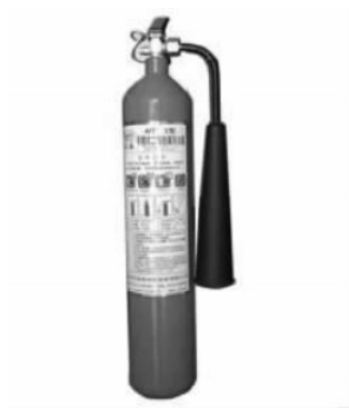
图 1-3-2 卤代烷灭火器