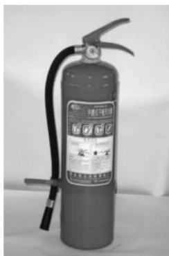
图 1-3-3 ABC 干粉灭火器