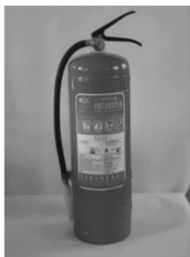
图 1-3-5 手提式泡沫灭火器