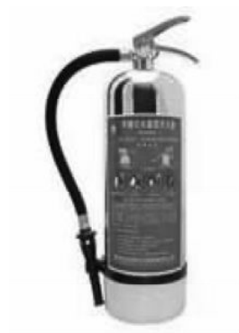
图 1-3-4 手提式水型灭火器