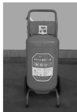
图 1-3-6 推车式泡沫灭火器