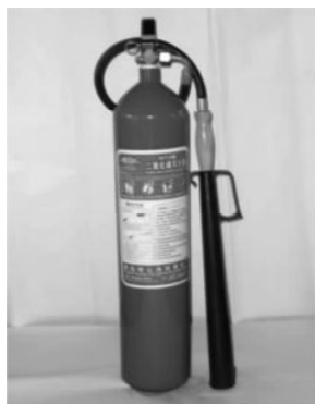
图 1-3-1 二氧化碳灭火器