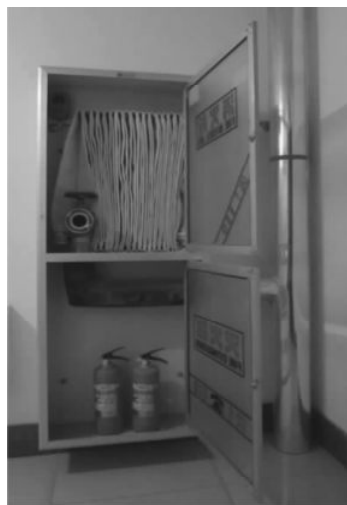
图 1-3-7 室内消火栓

由公安派出所监督管理的下列建筑或场所应设置室内消火栓系统：①建筑占地面积大于 300\text{m}^2 的厂房和仓库。②建筑高度大于 21\text{m} 的住宅建筑（建筑高度不大于 27\text{m} 的住宅建筑，设置室内消火栓系统确有困难时，可只设置干式消防竖管和不带消火栓箱的 DN65 的室内消火栓）。③体积大于 5000\text{m}^3 的车站、码头、机场的候车（船、机）建筑、展览建筑、商店建筑、旅馆建筑、医疗建筑和图书馆建筑等单、多层建筑。④特等、甲等剧场，超过 800 个座位的其他等级的剧场和电影院等以及超过 1200 个座位的礼堂、体育馆等单、多层建筑。⑤建筑高度大于 15\text{m} 或体积大于 10000\text{m}^3 的办公建筑、教学建筑和其他单、多层民用建筑。