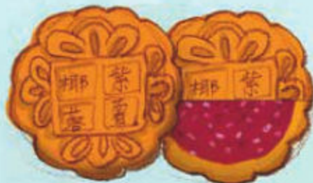
coco con patata morada