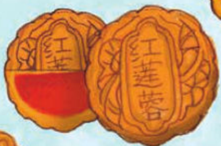
semillas rojas de loto