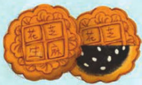
cacahuete con sésamo