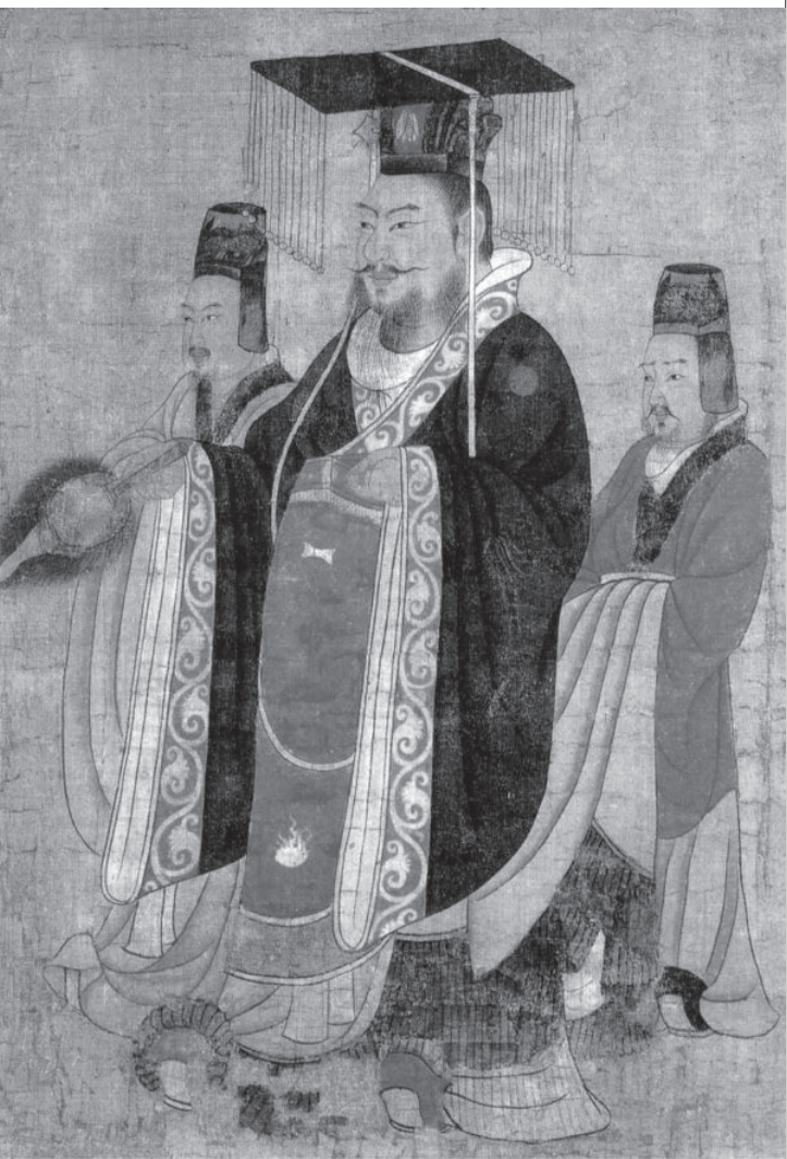
○ 孙权画像 孙权（182—252），即吴大帝。字仲谋，吴郡富春（今浙江富阳）人。孙坚子。三国时吴国建立者。229—252年在位。画像为唐阎立本绘，见于《历代帝王图卷》（现藏美国波士顿博物馆）

但袁术与孙坚明里合作，暗里拆台，不少联合军也是观望不前。孙坚前去攻打华雄时，袁术不发粮草。虽然孙坚最后打败了华雄，但却一度陷入险境。公元192年，袁术再派他前去攻打荆州刘表时，孙坚被刘表的部将黄祖射死，遗体运回江东，葬于曲阿（今江苏丹阳），年仅37岁。孙权立国后，追谥孙坚为“武烈皇帝”。