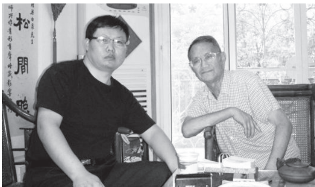
作者与梁白泉先生合影

梁白泉，1929年生于重庆市合川区，1951年毕业于南京大学历史学系。历任南京博物院院长、研究馆员，中国文物学会理事，江苏民俗学会会长，复旦大学历史学系、安徽大学历史学系客座教授。曾担任《中国大百科全书·博物馆·中国博物馆》《国宝大观》《吴越文化》等图书的主编。1992年被国务院授予“具有突出贡献的专家”称号，享受政府特殊津贴。