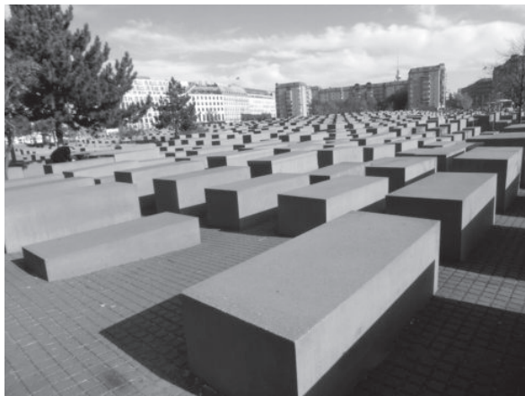
德国柏林“二战”犹太人纪念碑园

字塔边，在南美古玛雅人遗址旁，都留下了盗墓者的遗迹，但以中国最为严重——盗墓成了一种职业。为什么会出现这种现象？这就是本卷要告诉读者的。