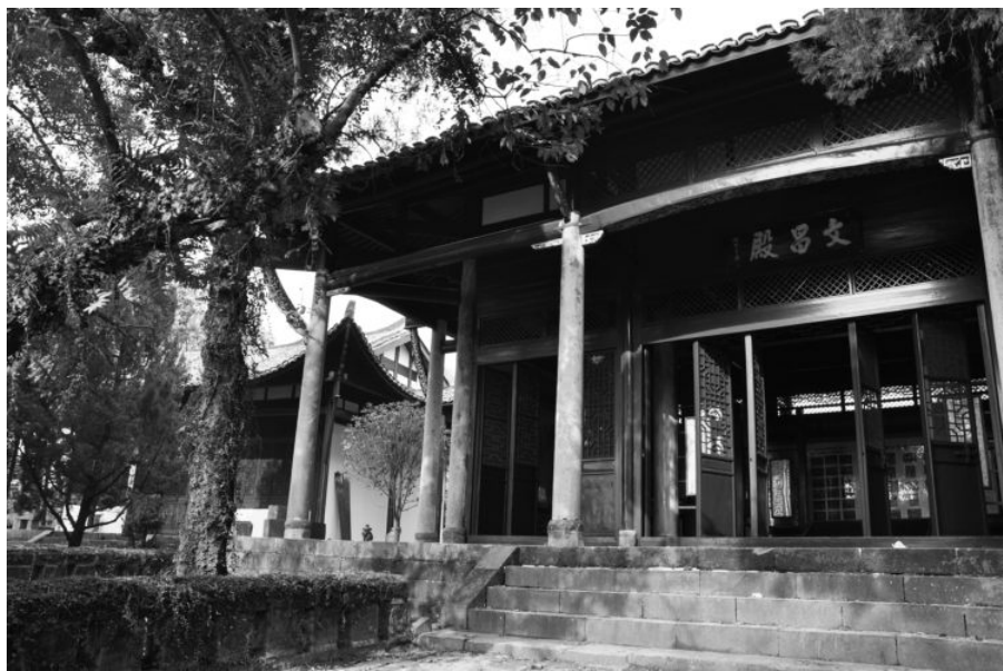
弋阳县高等小学旧址（叠山书院）

外，物理、化学、世界历史等课程都用英语授课。因此，报考这所学校的学生需要具备一定的英语基础。