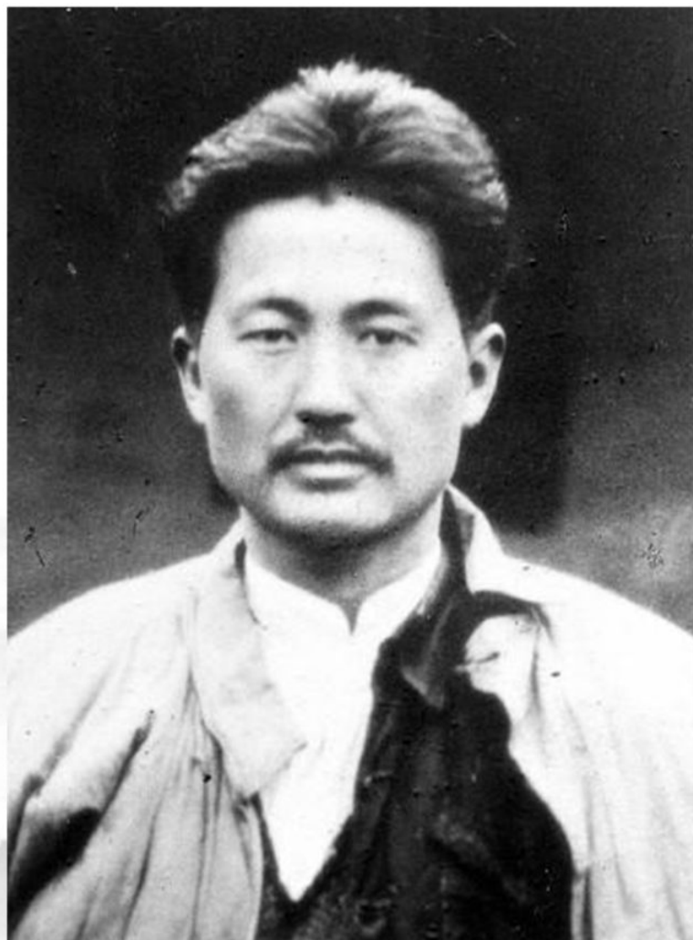
方志敏 ( 1899—1935 )