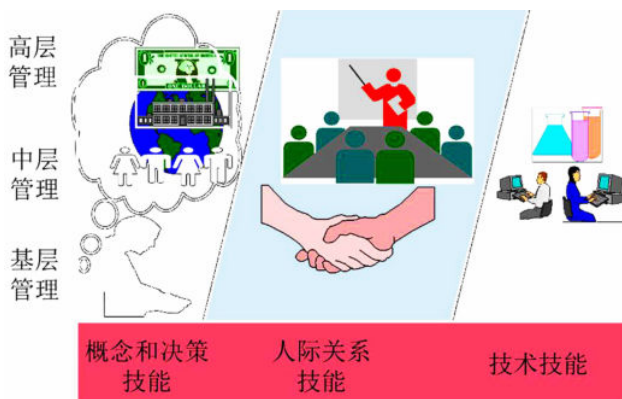
图1-7 不同层级管理者的不同技能大致应占的比例