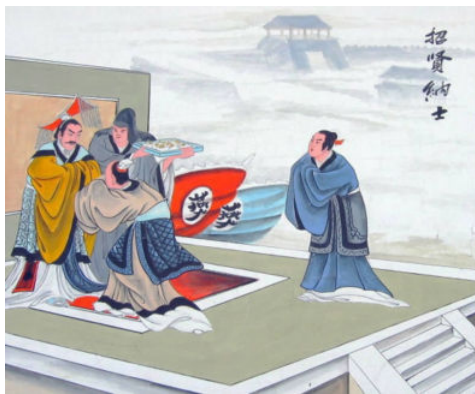
图 1-2 燕昭王筑台而师郭隗

燕国招揽了许多人才,如乐毅、邹衍、剧辛等,终致燕国富强。东汉末期的霸主们招揽人才、对待人才的方式也不一样:孙权在江东设招贤馆 ① ,破格提拔年轻都督;刘备三顾茅庐请诸葛亮出山;曹操不以貌取人,初次见到庞统即倾心相待;等等