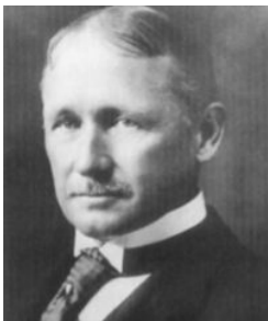
图 2-2 泰勒

(1) 泰勒的科学管理理论。泰勒(图 2-2)于 1911 年发表著作《科学管理原理》,此事件一般被看作管理走向科学的起点,因而泰勒被尊为“科学管理之父”。“提高劳动生产率”是泰勒创立科学管理理论的基本出发点。泰勒思想的追随者吉尔布雷斯夫妇的“砌砖动作”研究,使砌每块砖的动作从 18 个被压缩到 5 个,砌砖