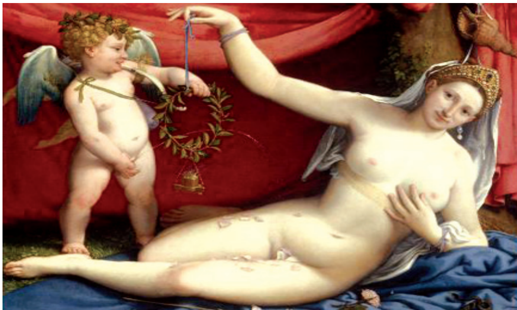
□ 希腊神话中的维纳斯

《维纳斯的诞生》画面内容取材于一个希腊神话：有个叫库娄诺斯的人，他斩下父亲身体的一段抛进海里，长期漂流，结果变成一个比雪还白的水泡。等水泡一开，在中间生出一位亭亭玉立、如花似玉的少女。这位少女被风神塞浦路斯用微风送到米洛斯岛，在那里由季节女神赫拉给她披上美丽的衣服，她也成了女神。维纳斯一生下来就是十全十美的少女，既无童年也不会衰老，永葆美丽青春。