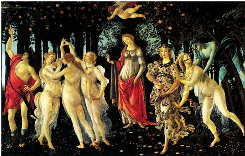
□波提切利笔下的维纳斯

作为向宗教禁欲主义挑战的形象。画面上维纳斯脸上挂着淡淡的哀愁,胸中似乎含有不可言传的、精神的、近乎理想的爱。因此,维纳斯的诞生似乎并不带来欢乐,反而有点悲剧味道。