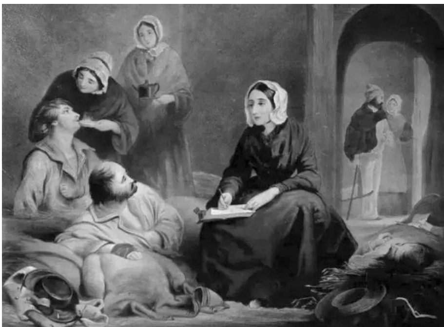
◆ 战争爆发，南丁格尔带领护士奔赴战地医院看护伤兵，获得极大赞誉

外科护理学是基于外科学的发展而形成的，主要研究如何对外科疾病患者进行整体护理。19世纪40年代，克里米亚战争爆发，现代护理学创始人弗洛伦斯·南丁格尔在前线医院看护病员期间成功应用清洁、消毒、换药、包扎伤口、改善休养环境等护理手段，同时注重对伤病员进行心理疏导和营养补充，最终使伤病员死亡率从42%降至2.2%。这一事实充分证实了护理工作在外科患者治疗过程中的地位和意义。由此契机创建的护