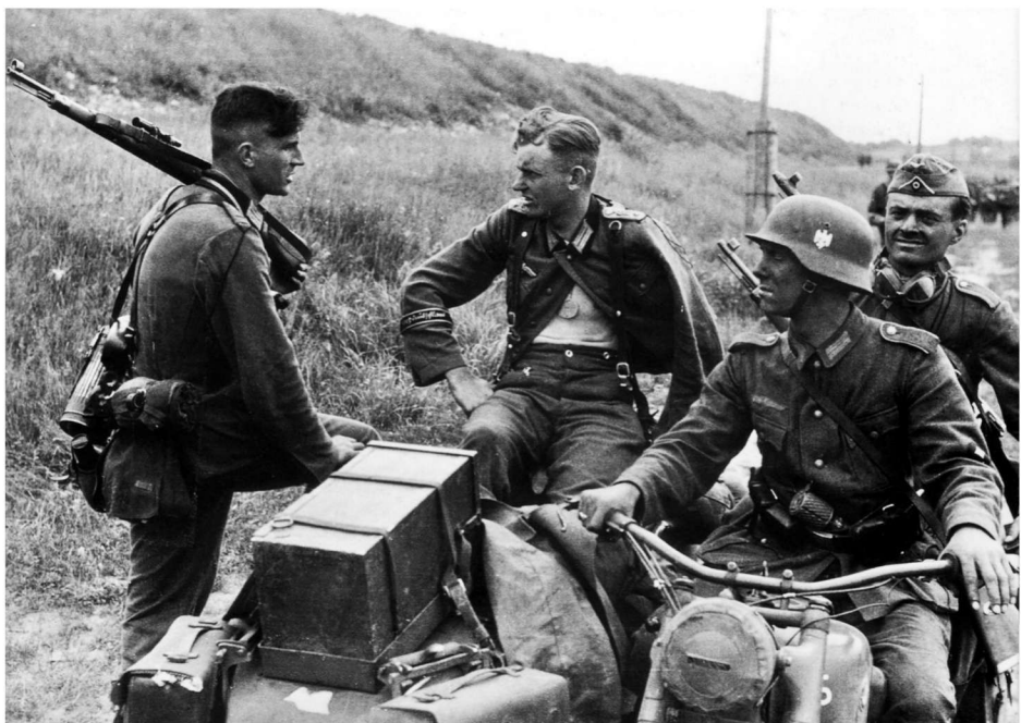
参加“城堡”行动的“大日耳曼”师官兵

战斗规模虽然不大,却相当激烈。德拉古斯科耶以东,“大日耳曼”师“掷弹兵”装甲步兵团和第11装甲师先遣营成功清除了苏第52近卫步兵师一个营