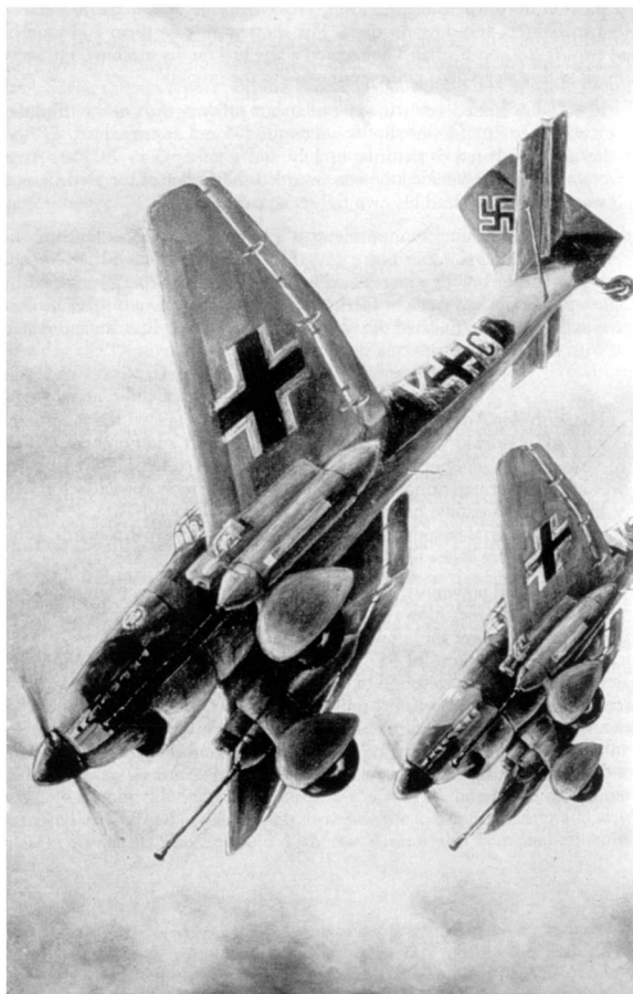
俯冲中的“斯图卡”。虽然有些过时，但这种飞机1943年依然在东线大量服役

5日凌晨2时20分，红军中央方面军第13集团军开始炮击，此时距德军炮火准备仅有10分钟。片刻之间，方才还沉寂的大地震动起来！一个苏军师长