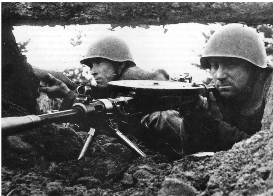
严阵以待的红军DP机枪阵地,射速为每分钟550发