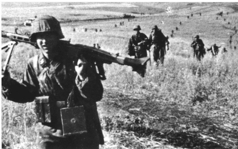
前往集结地域的德国武装党卫军士兵

7月4日的前沿战斗虽然规模不大，依然被很多西方史料认为是“城堡”战役的开始。德第4装甲集团军以此夺取了当面苏军50%的前哨阵地，并迫使