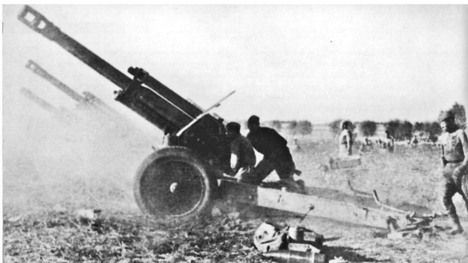
轰击中的红军重炮

克可能的集结地炮火急袭 10 分钟。按照惯例,炮击的开始和结束都伴随着火箭炮齐射。