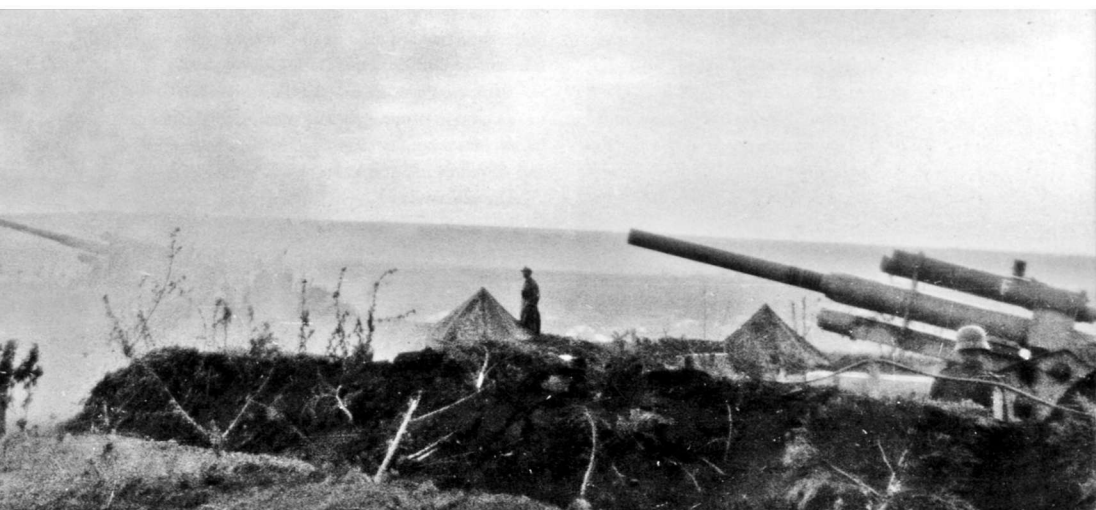
库尔斯克前线的德军炮兵阵地

7月5日晨,苏军又进行了第二次持续时间30分钟的轰击:先对德军出发阵地实施5分钟急袭射击,接着是对炮兵阵地的15分钟等速直瞄射,最后对坦