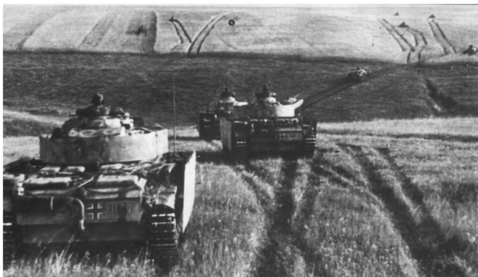
冲向库尔斯克！沿着开阔正面冲击的德军坦克群

正面属于次要方向，由红军第65(司令巴托夫中将)、60(切尔尼亚霍夫斯基中将)集团军，对峙德第9集团军第20军(罗曼炮兵上将)、第2集团军第13