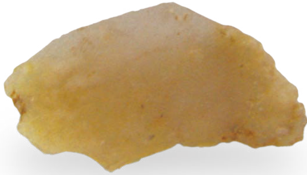
0694 新石器·刮削器 长 1.5cm, 宽 1.1cm, 高 0.3cm, 重 6g