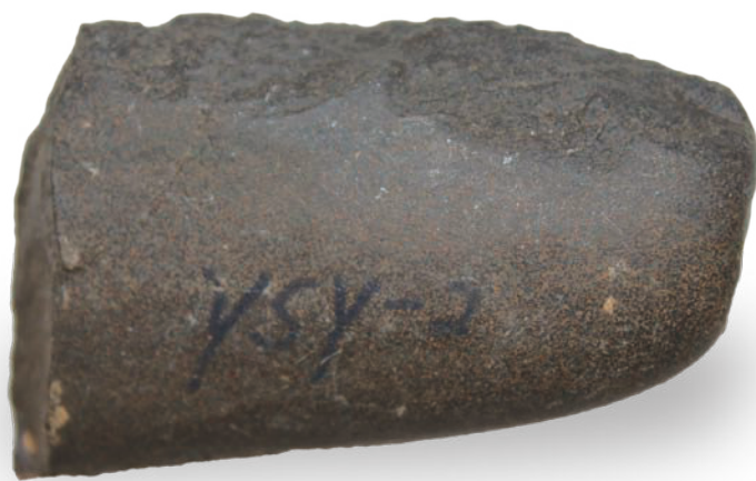
0690 新石器·石斧 长 5.5cm, 宽 3.3cm, 高 2cm, 重 100g