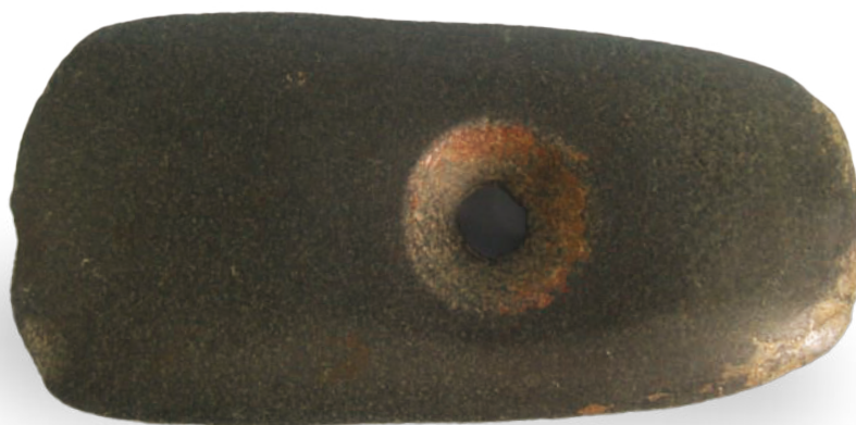
1790-3 新石器·石斧 长 12.8cm, 宽 6.3cm, 高 0.6cm, 重 300g