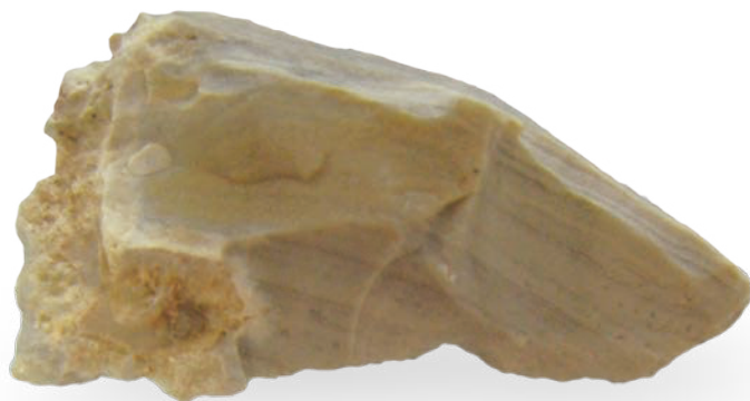
0708 新石器·尖状器 长 2.5cm，宽 1.9cm，高 0.3cm，重 37g