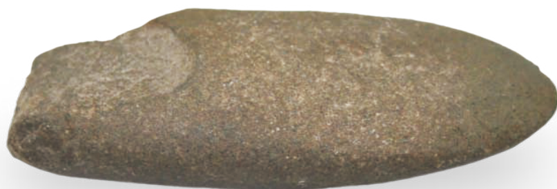
1790-4 新石器·石斧 长 6.1cm, 宽 4.1cm, 高 1.80cm, 重 50g