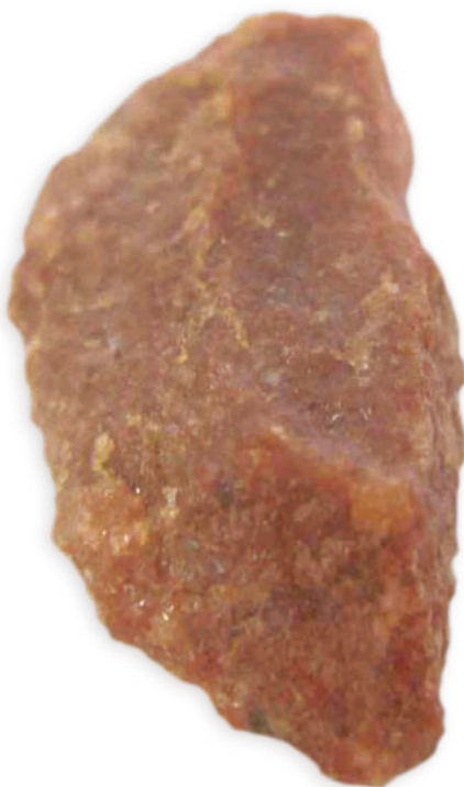
0693 新石器·尖状器 长 3.1cm, 宽 1.8cm, 重 50g