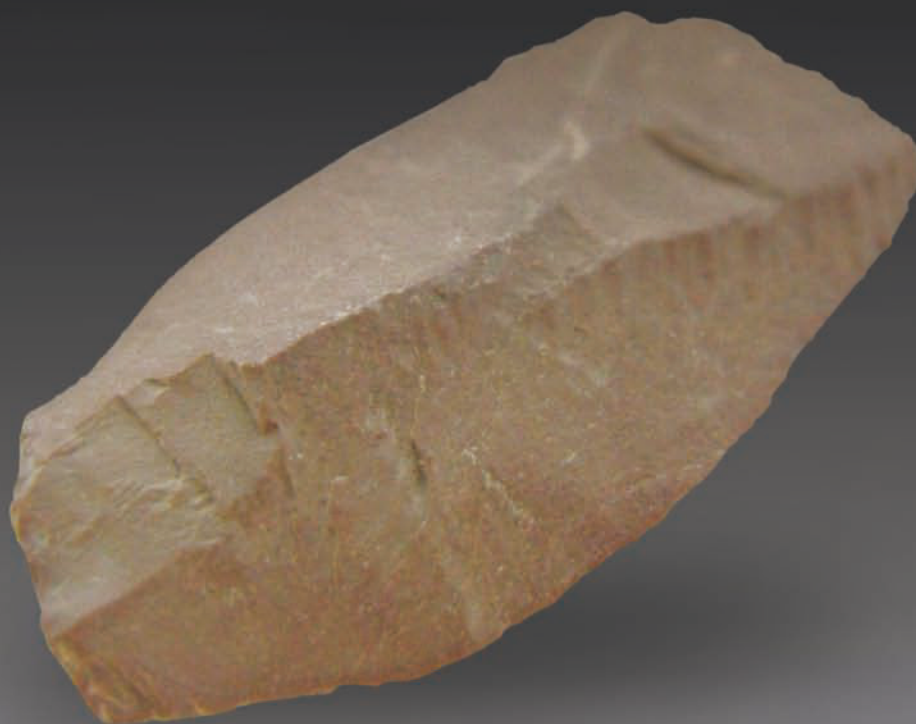
0669 新石器·刮削器 长 2.5cm，宽 1.1cm，高 2cm，重 3.1g