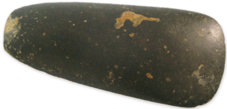
1790-2 新石器·石斧 长 12.4cm，宽 5.7cm，高 0.67cm，重 300g