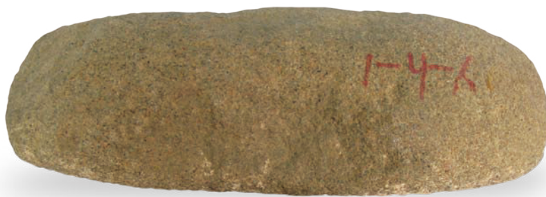
0711 新石器·石斧 长 12cm，宽 6cm，高 3.1cm，重 200g