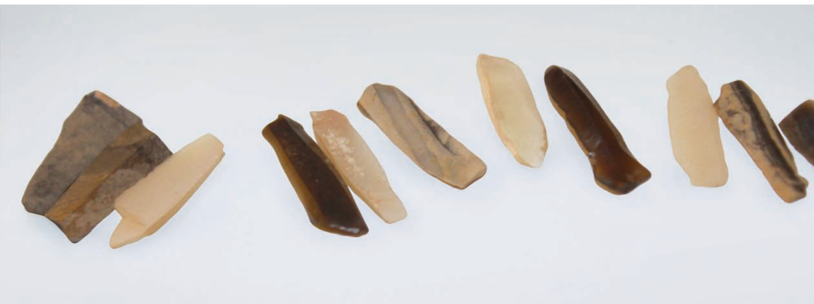
0704 新石器·石叶 长 1.6cm，宽 0.4cm，高 0.3cm，重 32g