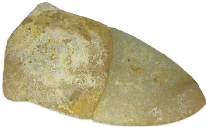
0712 新石器·石叶 长 4.8cm，宽 2.5cm，高 0.5 cm，重 50g