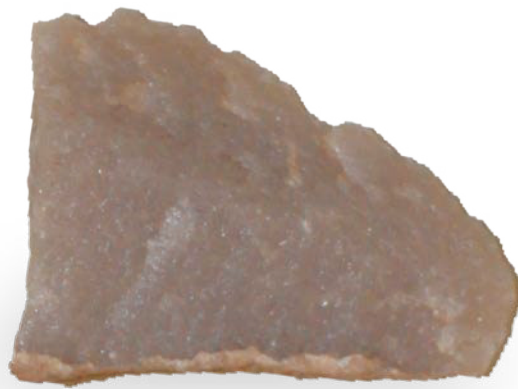
0695 新石器·刮削器 长 2cm, 宽 1.5cm, 重 8.6g