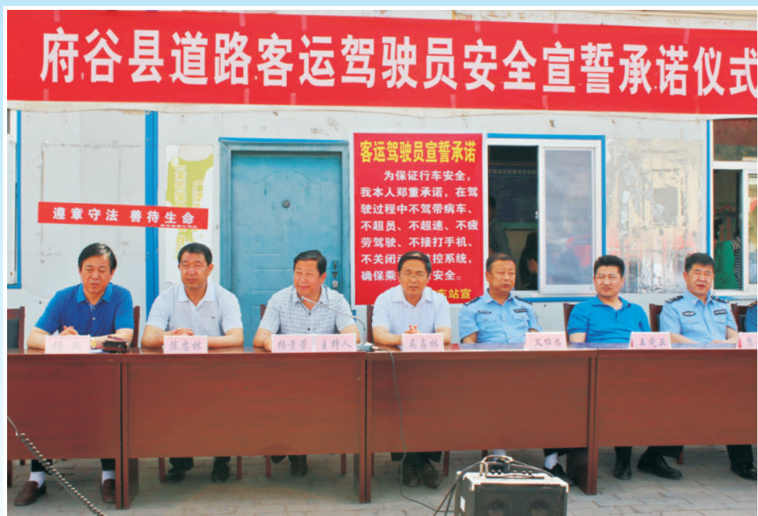
2015年6月1日，在汽车站举行“府谷县道路客运驾驶员安全宣誓承诺仪式”