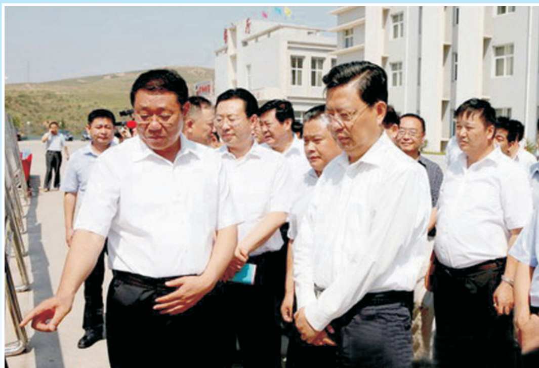
2011年8月3日，省委书记赵乐际来府谷视察指导工作