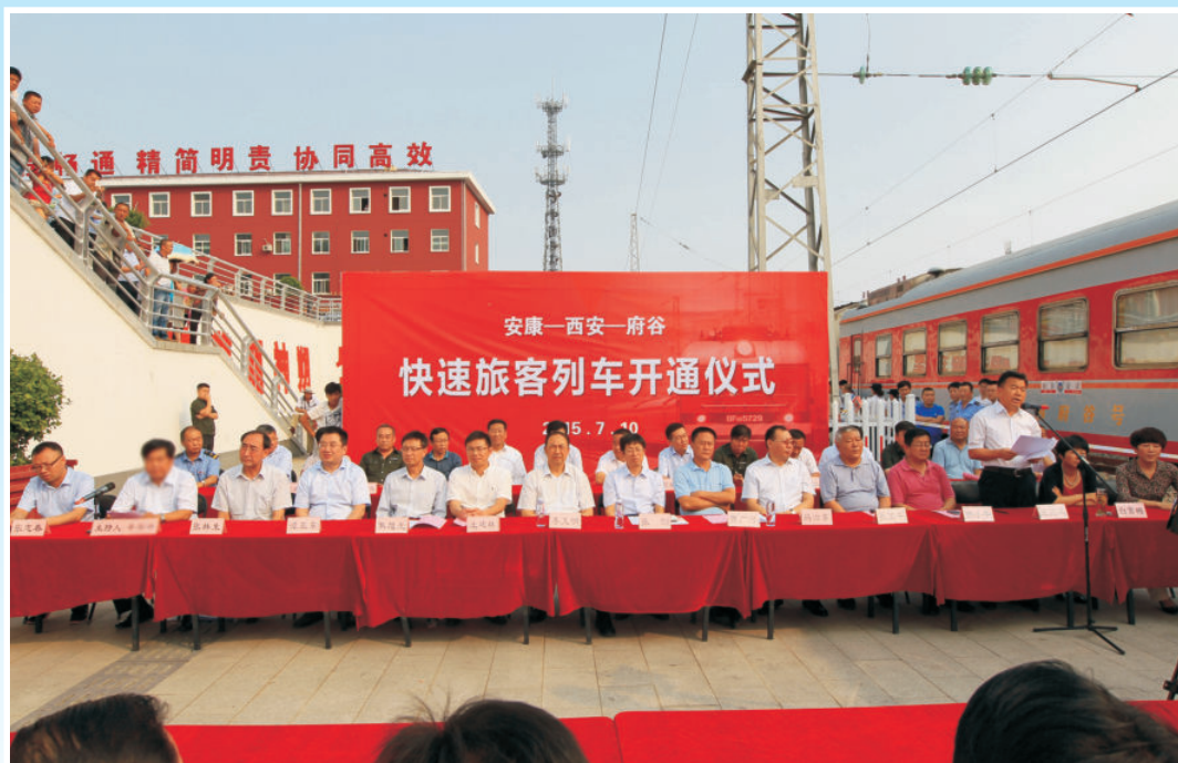
2015年7月10日，在府谷火车站举行“安康—西安—府谷快速旅客列车开通仪式”，西安铁路局、神朔铁路公司、榆林市政府、榆林市交通运输局负责人以及府谷县四套班子主要负责人共同出席仪式