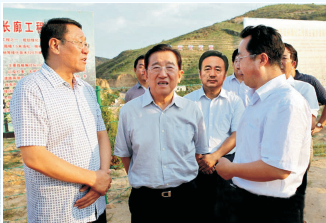
2012年7月10日，国家林业局党组书记、局长贾治邦（中）调研府谷绿化工作，图为视察神府高速公路绿化长廊