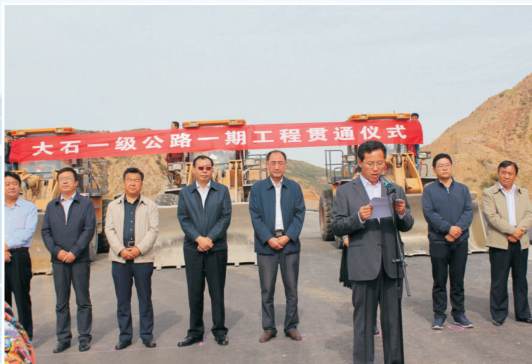
2015年9月23日，全省第一条由县级政府负责建设的高等级公路——大柳塔至石马川一级公路铧尖塔至野芦沟段50公里，正式贯通