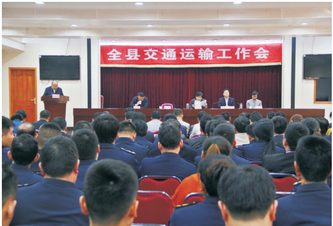
2016年4月8日，在县政府多功能厅召开全县交通运输工作会