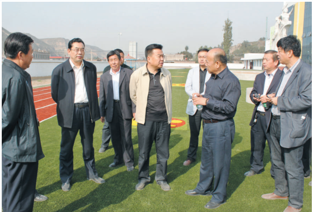
2013年10月12日，市人大常委会主任王乃延（中）调研孤山、新民等乡镇基础设施建设情况