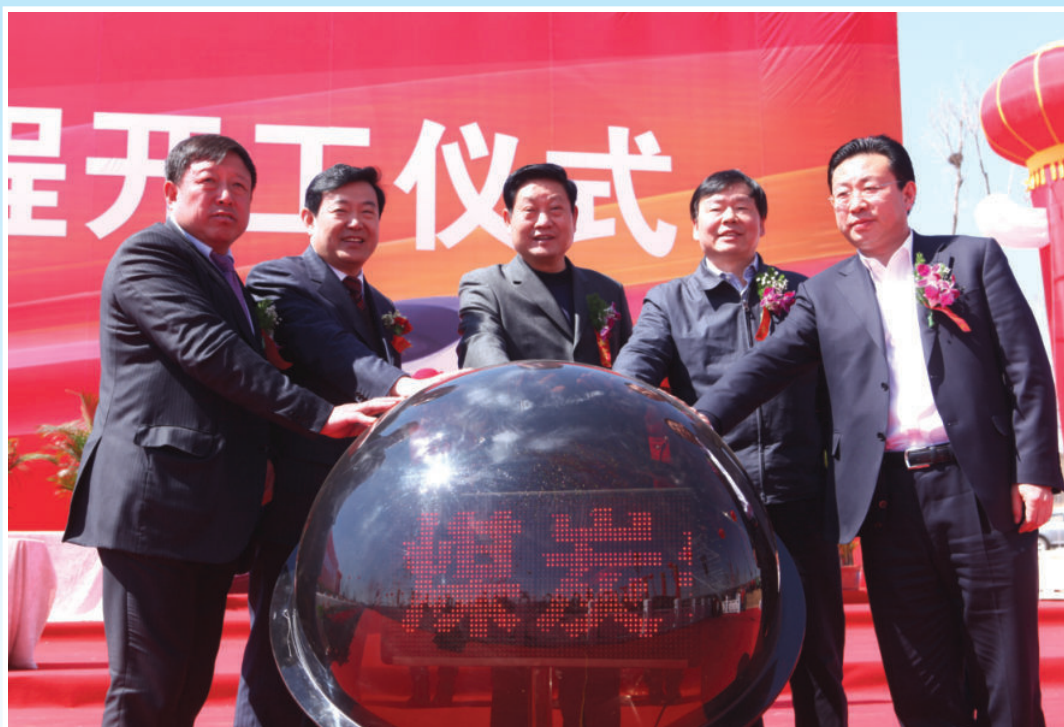
2011年3月28日，省长赵正永（中）、常务副省长娄勤俭（右二）、市委书记李金柱（左二）、市长胡志强（右一）以及民营企业家高乃则共同启动“府谷煤炭铁路专用线”开工仪式