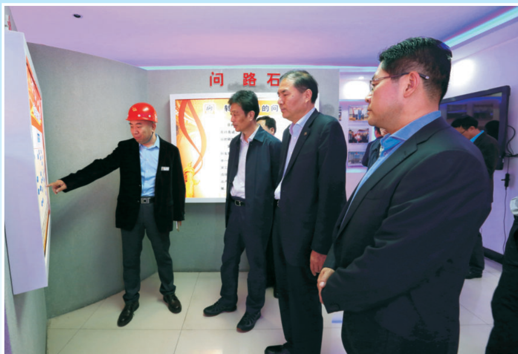
2017年5月16日，市委书记戴征社（左二）来府谷调研指导工作