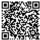
希望灯塔 - 延安