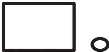
图 2.1 空间图式

在空间场景描述中，车和房子被图式化为两个图形，它们本来的几何形状已经被忽略了，只有空间所处的位置被抽象出来，代表其所处的场景。如图 2.1 所示：