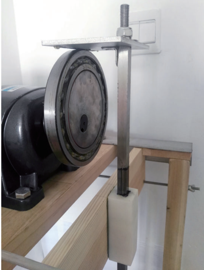
彩图19 改进团粒分析仪偏心轮