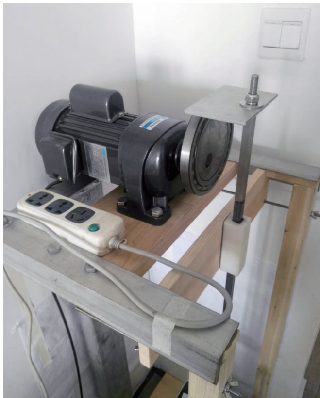
图18 改进团粒分析仪电机