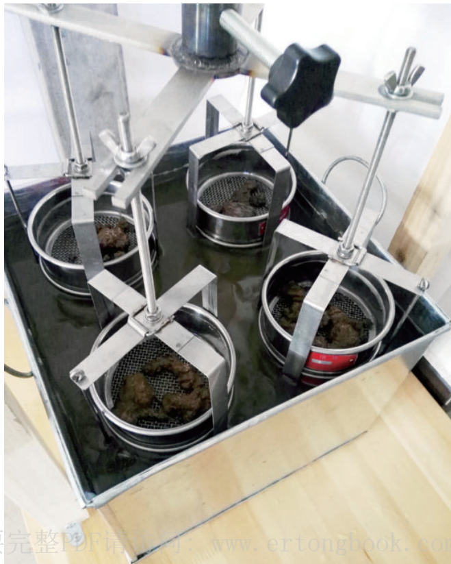
彩图20 改进团粒分析仪筛组