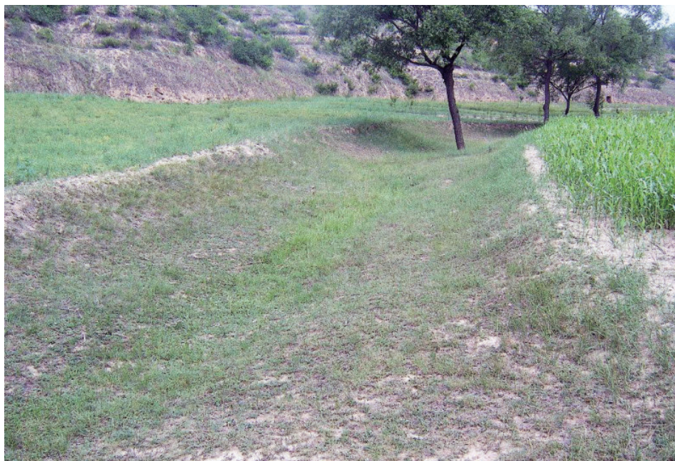
彩图8 沟头草皮水道