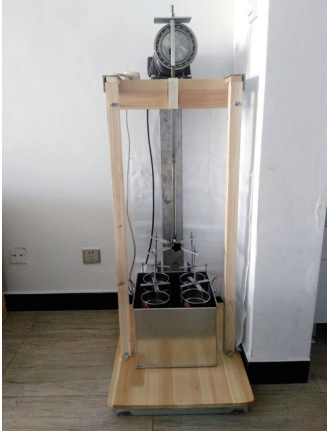
彩图17 改进团粒分析仪整体