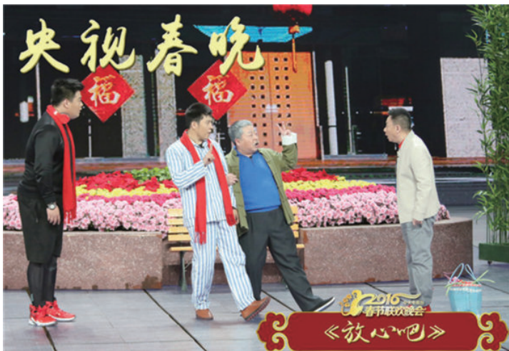
▲ 2016年中央电视台春节联欢晚会

对于2016年的央视春晚，央视《新闻联播》的评价是：贯穿了中国梦和社会主义核心价值观的主题主线，在真情、感人、欢乐、祥和的氛围中传递了社会正能量。其中，小品《放心吧》就通过具有喜剧效果的故事，表达了社会主义核心价值观中诚信与友善的主题。