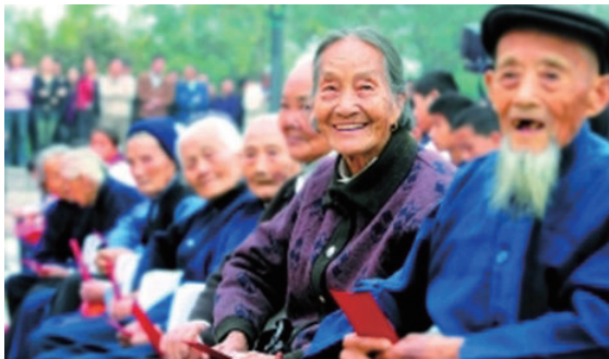
▲ 浙江率先在全国省区实现了养老保险全覆盖

2014年2月7日，国务院常务会议指出，建立统一的城乡居民基本养老保险制度，使全体人民公平地享有基本养老保险。进一步推进了社会公平。