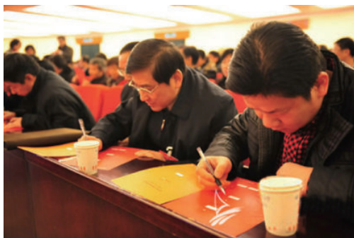
人大代表在认真填写选票 ▶

我国民主的实质和核心是人民当家作主，具体表现为民主选举、民主决策、民主管理、民主监督。民主为人民美好幸福生活提供政治保障。