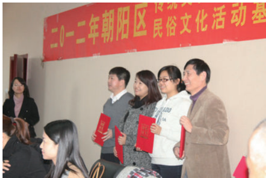
▲ 朝阳区优秀传统文化传承体系建设初见成效

2014年2月7日，国务院常务会议指出，建立统一的城乡居民基本养老保险制度，使全体人民公平地享有基本养老保险。进一步推进了社会公平。