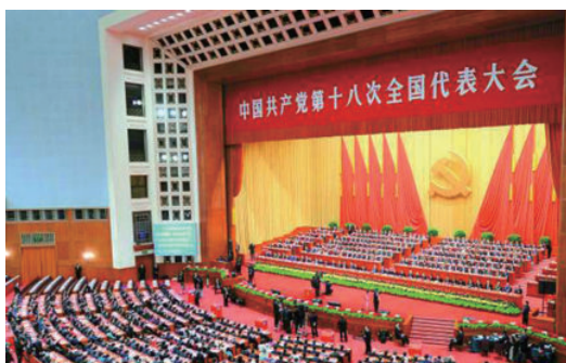
▲ 中国共产党第十八次全国代表大会

2012年11月，党的十八大报告明确提出“三个倡导”，即“倡导富强、民主、文明、和谐，倡导自由、平等、公正、法治，倡导爱国、敬业、诚信、友善，积极培育和践行社会主义核心价值观”，这是对社会主义核心价值观最全的概括。