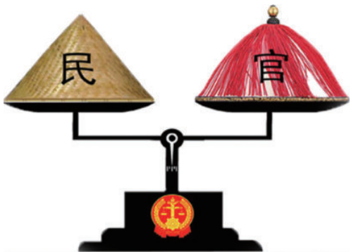
▲ 反对特权，法律面前人人平等

平等即公民在法律面前一律平等，其价值取向是不断实现实质平等。它要求尊重和保障人权，人人依法享有平等参与、平等发展的权利。