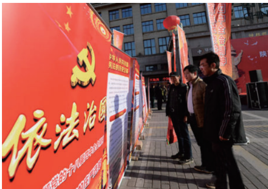
▲ 群众正在欣赏依法治国的宣传海报

2014年6月，十八届四中全会全面部署推进依法治国，以建设中国特色社会主义法治体系，建设社会主义法治国家为总目标。