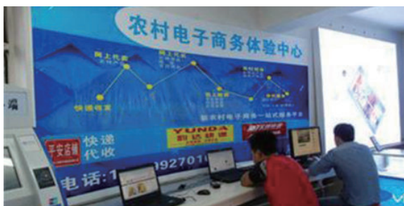
▲ 农村电子商务体验中心

2015年12月23日，国务院召开常务会议，提出农业发展新举措，鼓励休闲农业、农村电商等新经济新业态的发展。该举措为促进农村经济繁荣、国家富强提供了重要保障。