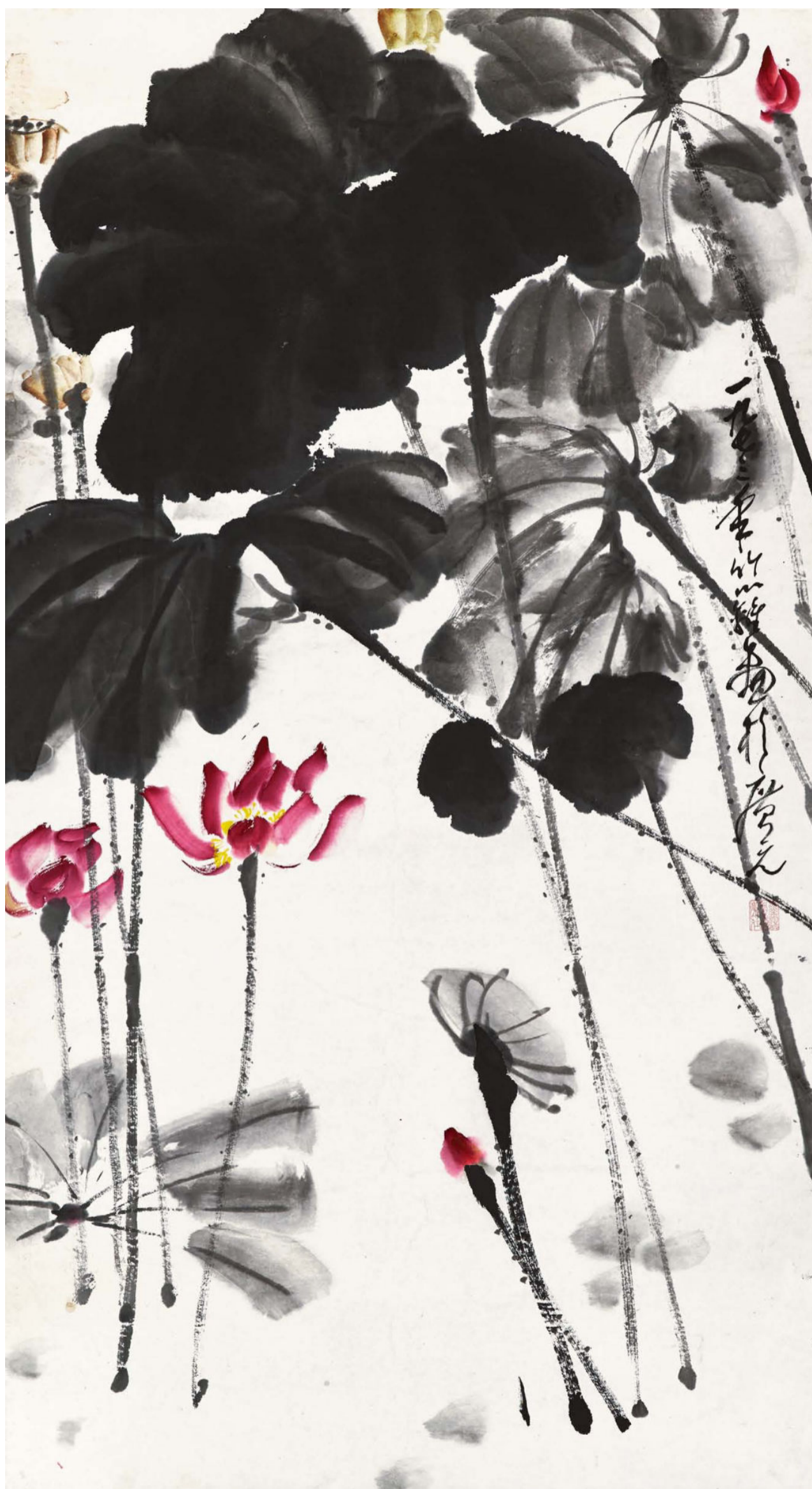
荷花 149cm×81cm 1973年