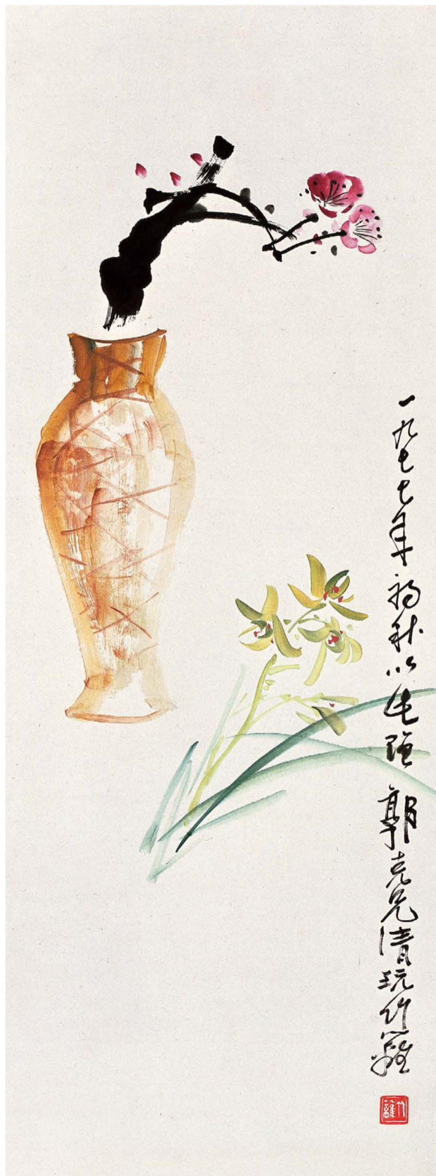
博古花卉(兰草) 93cm×35cm 1977年