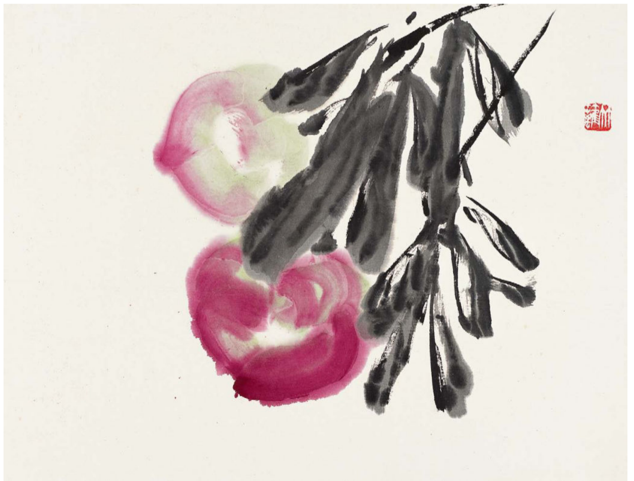
瓜果册（八开）之双寿 1 平尺 1977 年—1980 年