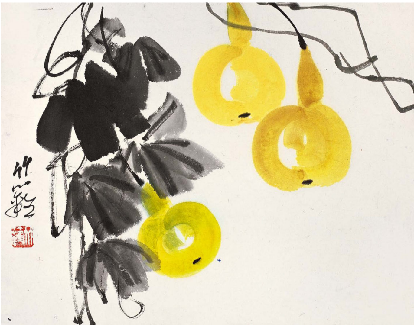
瓜果册（八开）之葫芦 1 平尺 1977 年—1980 年