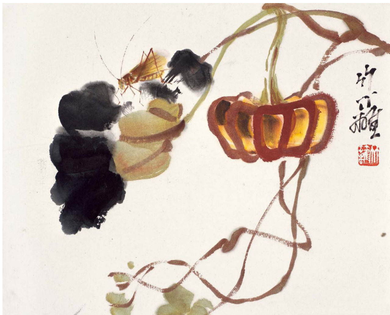
瓜果册（八开）之南瓜草虫 1平尺 1977年—1980年