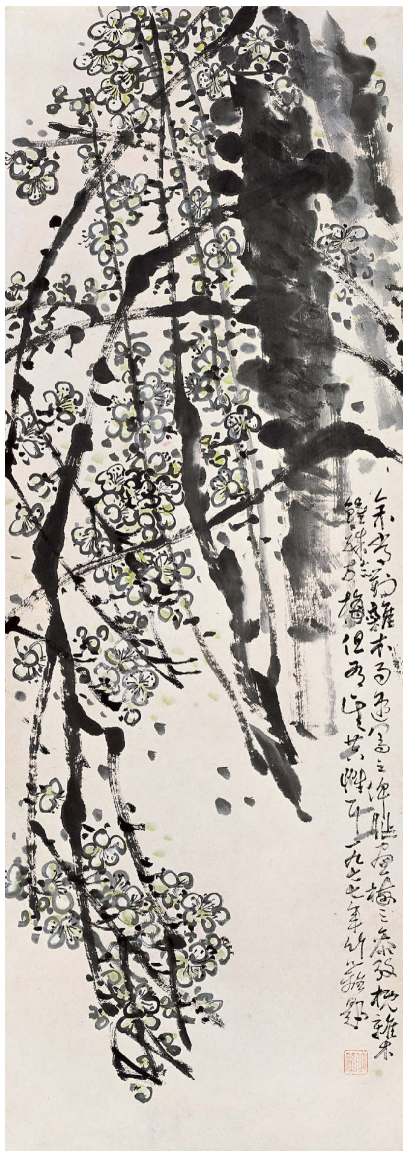
绿梅 139cm×48cm 1977年