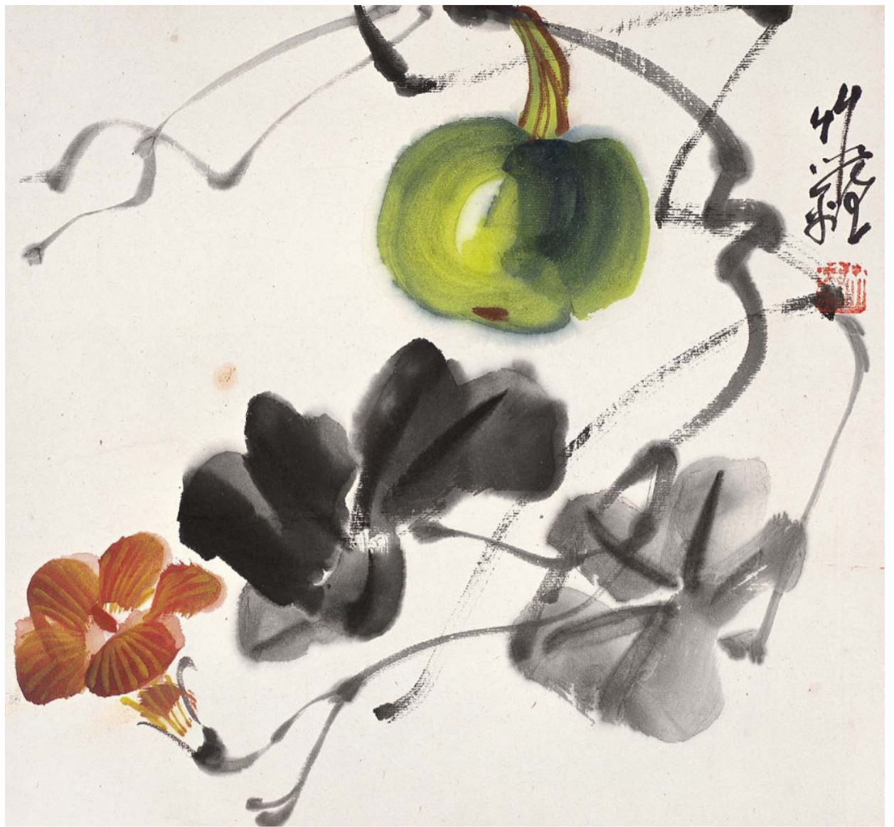
瓜果册（八开）之嫩南瓜 1 平尺 1977 年—1980 年