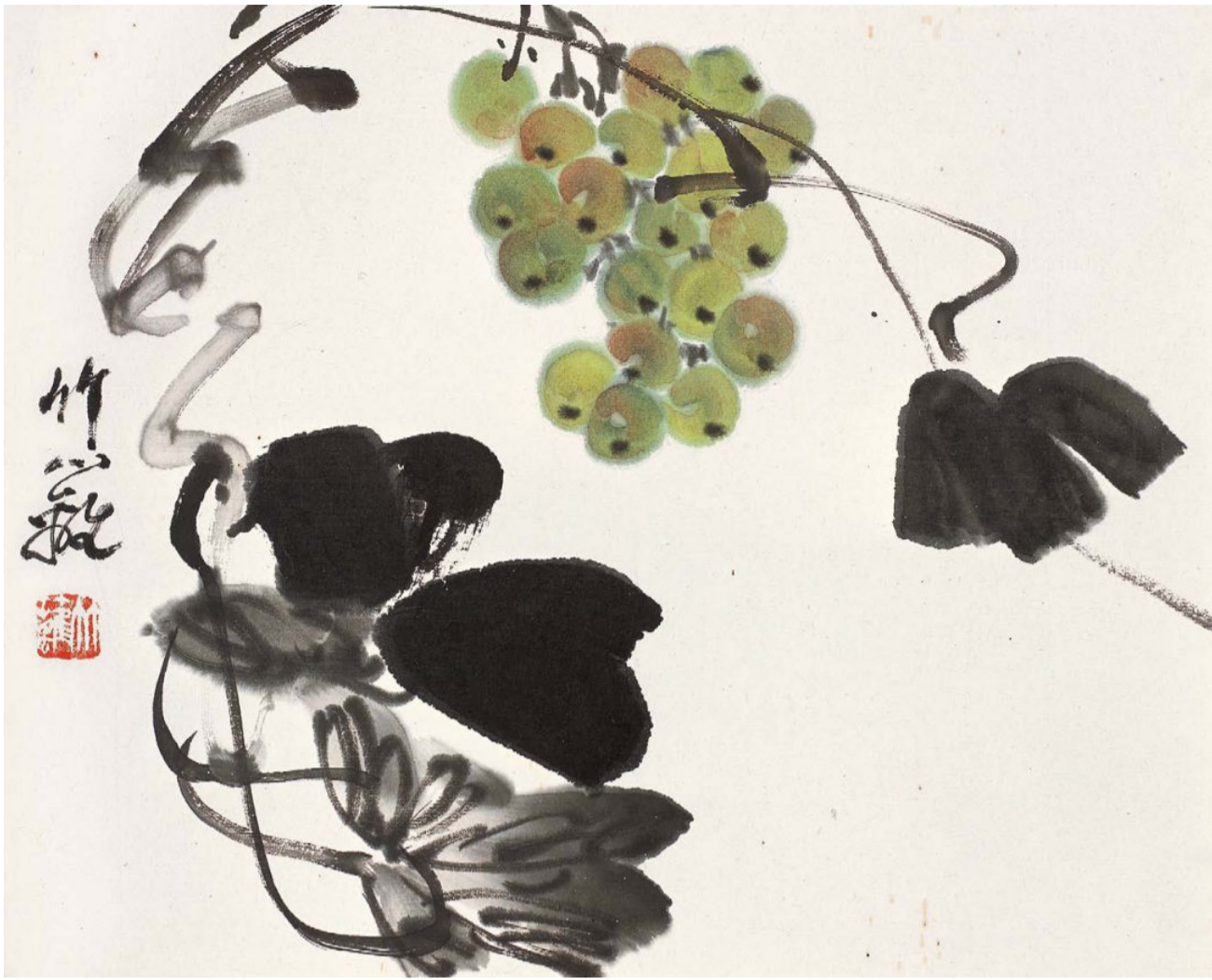
瓜果册（八开）之绿葡萄 1 平尺 1977 年—1980 年