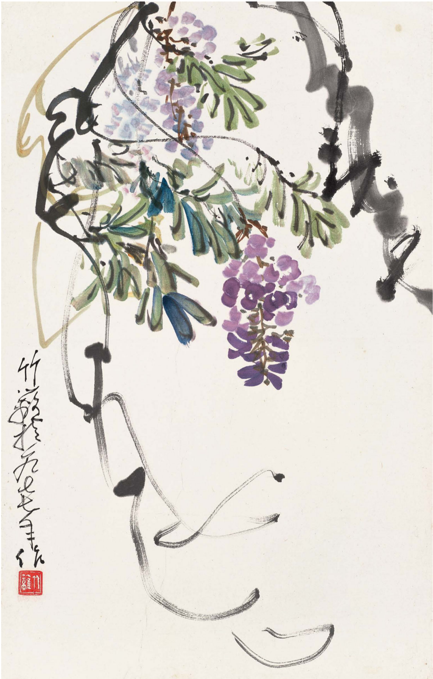
紫藤 63cm×41cm 1977年