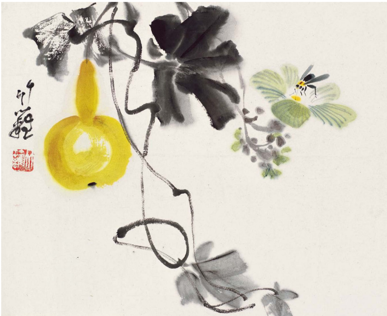
瓜果册（八开）之葫芦马蜂 1 平尺 1977 年—1980 年