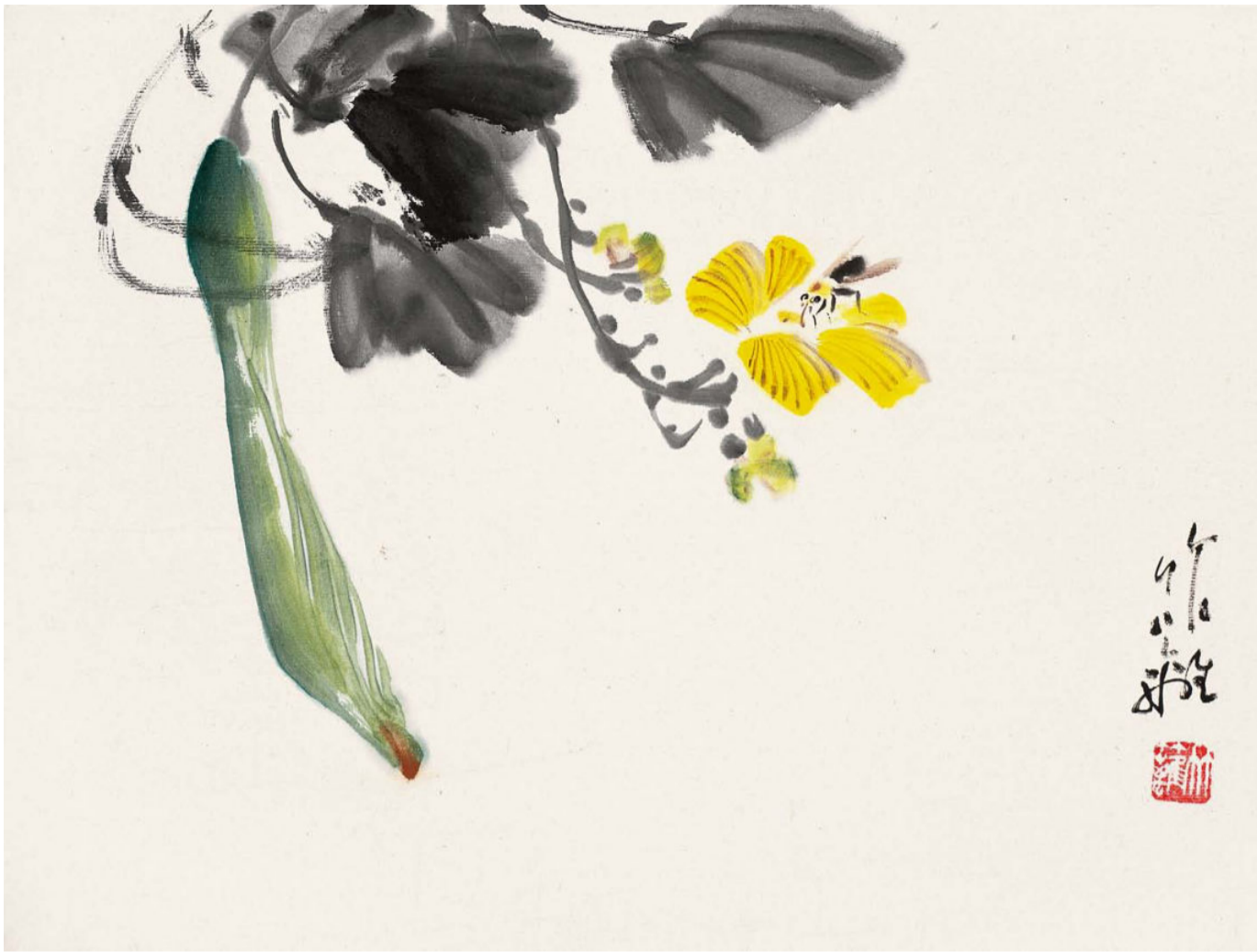
瓜果册（八开）之丝瓜马蜂 1 平尺 1977 年—1980 年