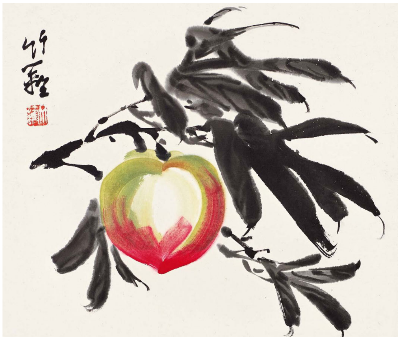
瓜果册（八开）之寿桃 1平尺 1977年—1980年