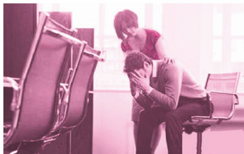
You Look Tired

Sara: Oh, John, you look tired! What time did you go to bed last night?