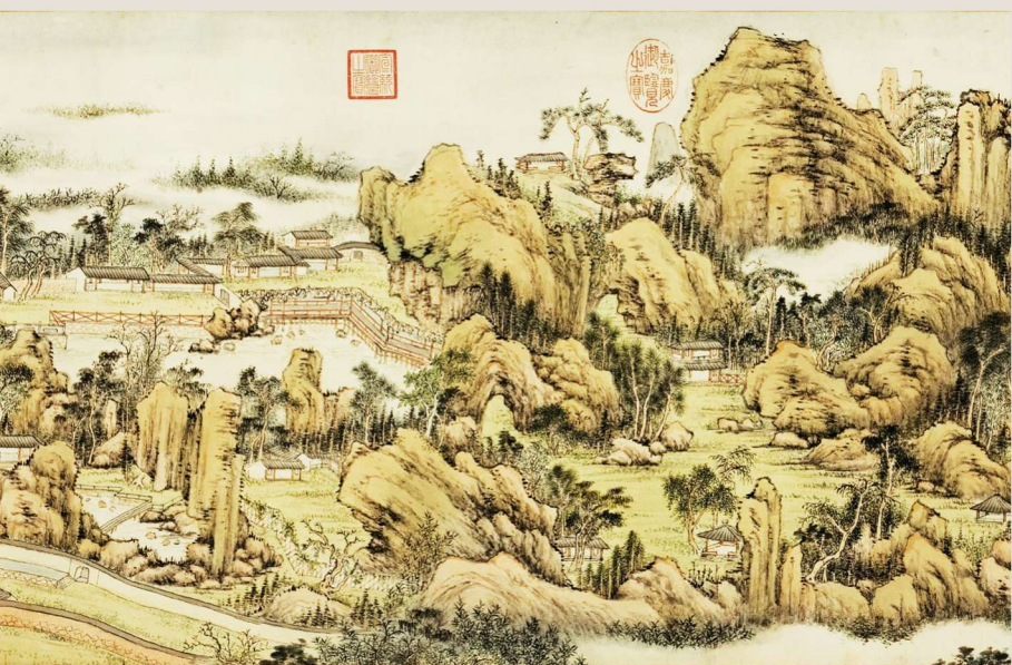
* [清] 钱维城