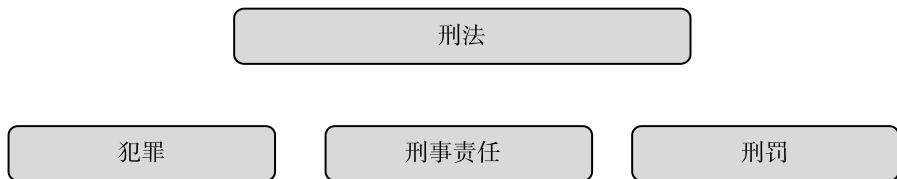
图 1-1 刑法的内容

有肉刑等酷刑,而现代“刑罚”却普遍没有这些内容;同理,“犯罪”也有其特定的内涵,如古代之“犯罪”规定有和奸罪、腹诽罪、大不敬罪等,而现代之“犯罪”却规定有计算机犯罪、证券犯罪、知识产权犯罪、走私核材料罪等。可见,“刑罚”也好,“犯罪”也罢,它们都有自己独特的内涵和价值,不是一个“刑事责任”就能代替得了的。因此本书认为,刑法的简要定义应当是:刑法是规定犯罪、刑事责任和刑罚的法律。(如图 1-1 所示)