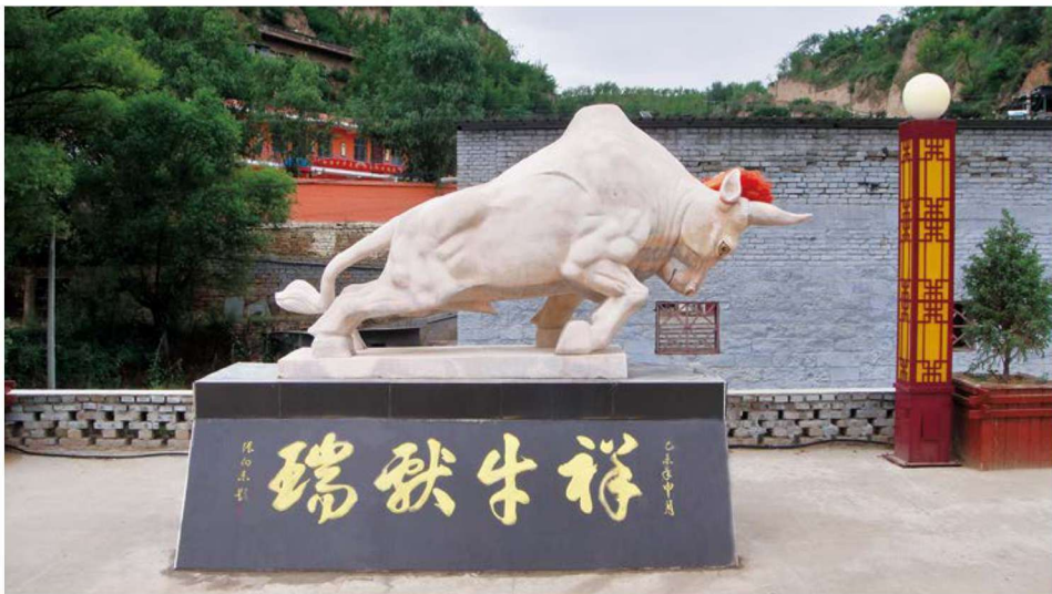
犍牛沟村标——祥牛献瑞

犍牛沟，顾名思义与牛和沟有关，一条东西走向的十里长沟，是村人祖祖辈辈的栖息之所，而一条自东向西流的小溪，则是村庄的血脉。非常久远的年头之前，先民们肯定是看中了南北两座高峰的护佑和这条清澈见底的小溪，才停下了漂泊的脚步。不用借助罗盘和八卦镜，这是一种本能的选择。从此，村庄就与秀水清风、日月星辰相依相伴；从此，先民们就在这里安居乐业、繁衍生息，成为被世人所艳羡的桃源中人。