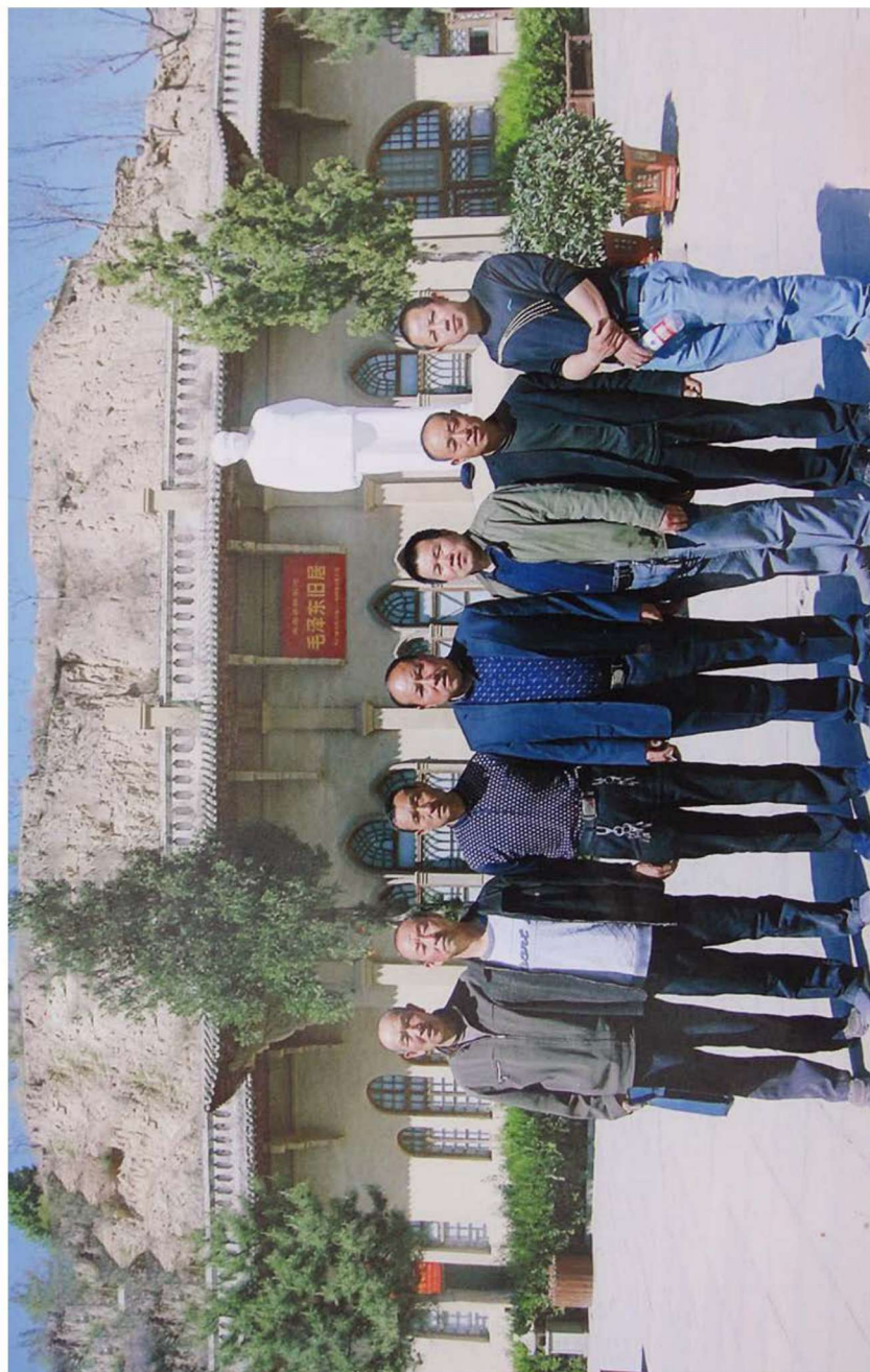
特牛沟村委会成员在杨家沟留影