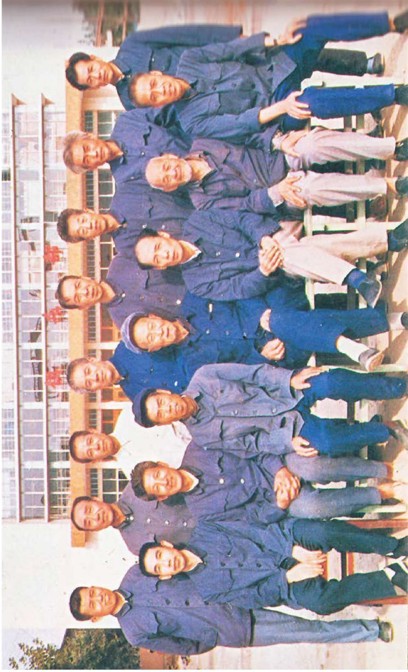
兵工厂工作过的部分老兵合影（1986年）