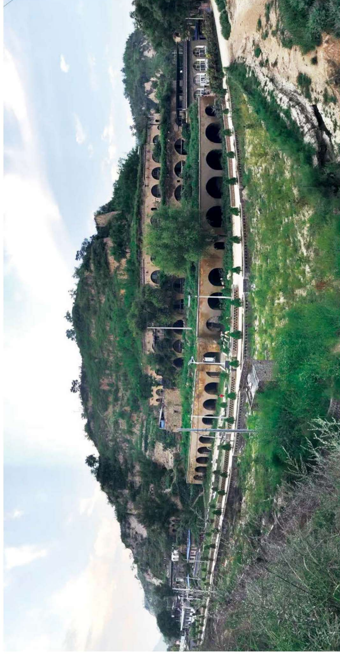
特牛沟兵工厂旧址