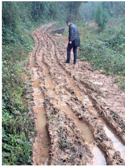
难以下脚的泥泞社道

于是我立即回“娘家”向省稽查局、省地税局汇报这三个月的调研情况，希望“娘家”能在资金上给予石庙村大力支持。得到肯定的答复后，我欣喜若狂，立即起草《关于对平昌县江口镇石庙村实施帮扶项目的思路及建议》，决定对石庙村在三个方面进行扶贫。即：一是对七、八社社道路进行改（扩）建；二是搞果树种植业，填补村无集体产