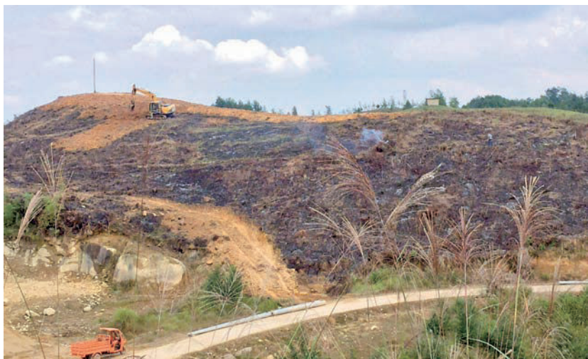
村集体产业，50余亩果园土地整理