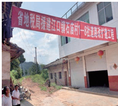
社道路改扩建开工