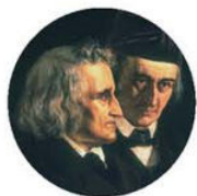
雅各布·格林（1785—1863） 威廉·格林（1786—1859）

格林兄弟生于莱茵河畔的哈瑙，是德国著名的语言学家。大学毕业后，他们埋头研究历史，于1806年开始搜集、整理民间童话和古老传说，并于1814~1822年陆续出版了三卷本的《德国儿童与家庭童话集》，俗称《格林童话》。