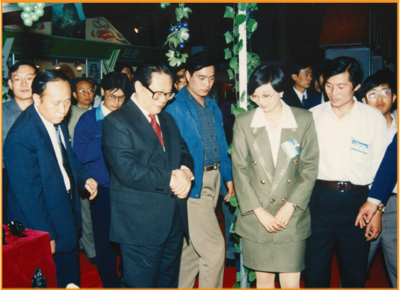
1994年10月1日，中共中央总书记、国家主席江泽民（前排左二）在北京参观林业部举办的全国林业名优特新产品博览会青海展厅