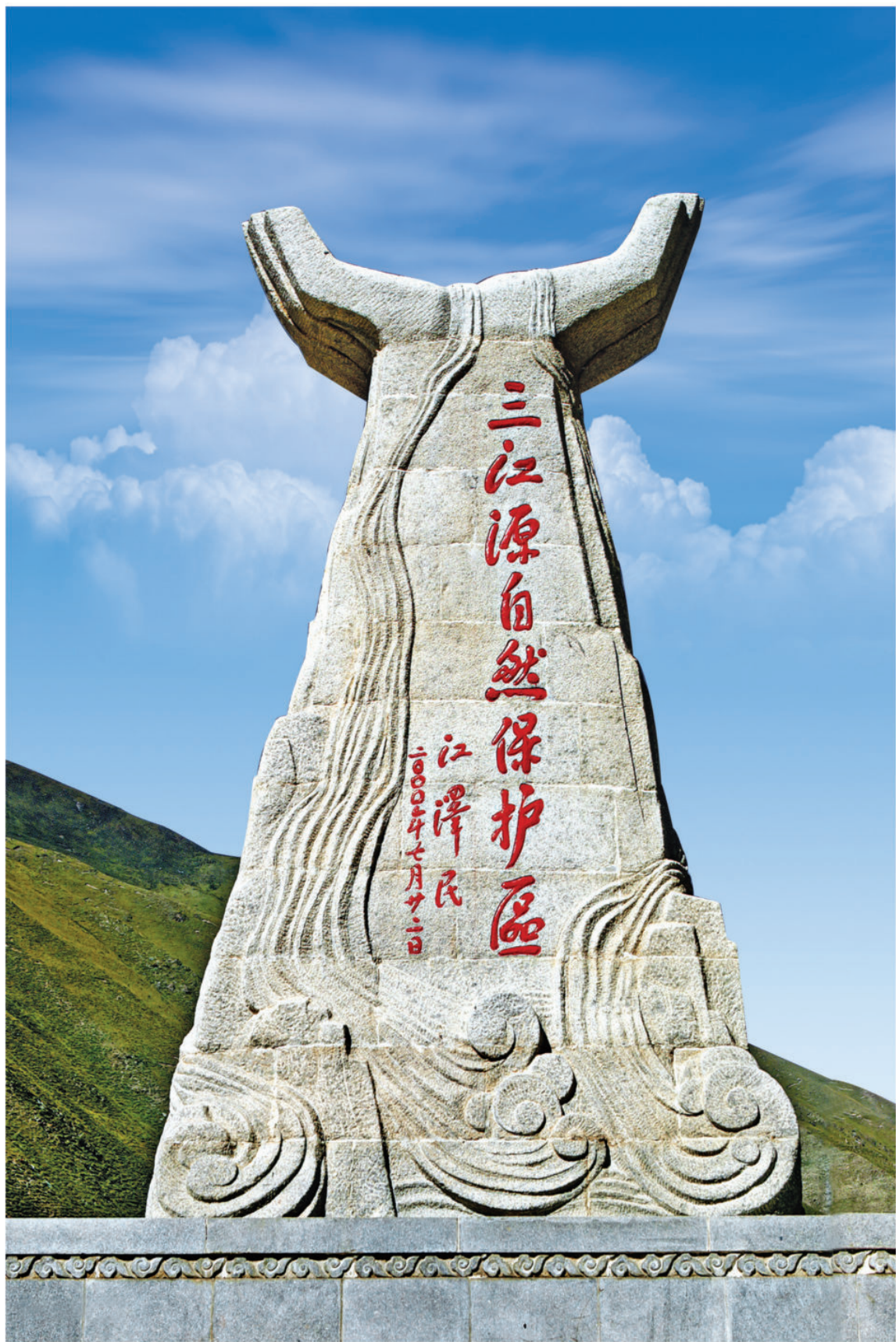
三江源自然保护区纪念碑