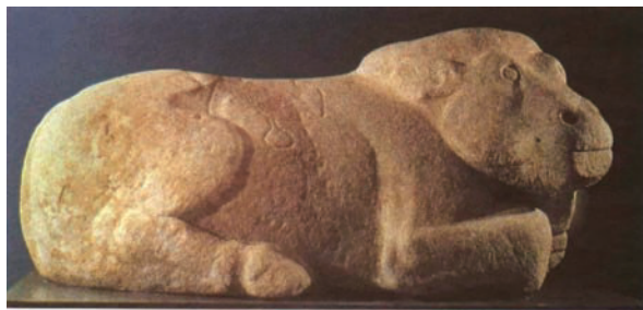
霍去病墓出土的石雕《卧牛》

早在新石器时代用贝壳和兽骨制作的项链、彩陶的纹饰，商周时期的青铜器等，无不闪耀着民间艺术的光辉。战国秦汉之际的石雕、陶俑及画像砖石，虽为统治阶级生前或死后享用，但在造型及艺术风格上都带有朴质活泼的民间美术特色。魏晋以后，士大夫贵族成为画坛的领军人物，但在版画、年画、雕塑、壁画以及各种艺术创作中，民间匠师仍占绝对优势。他们的创作活动使得民间美术更具特色、更为多彩。而在广大城乡群众中流行的剪纸、刺绣、印染、服装缝制等直接装饰人民生活的工艺美术创作，既有着广泛的社会基础，又极具地域特色和民族特色。