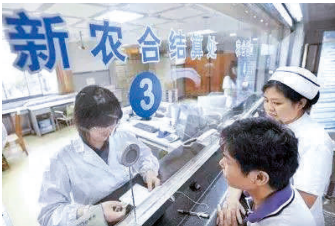
自9月1日零时起，全市大病医疗保险实行即时结算