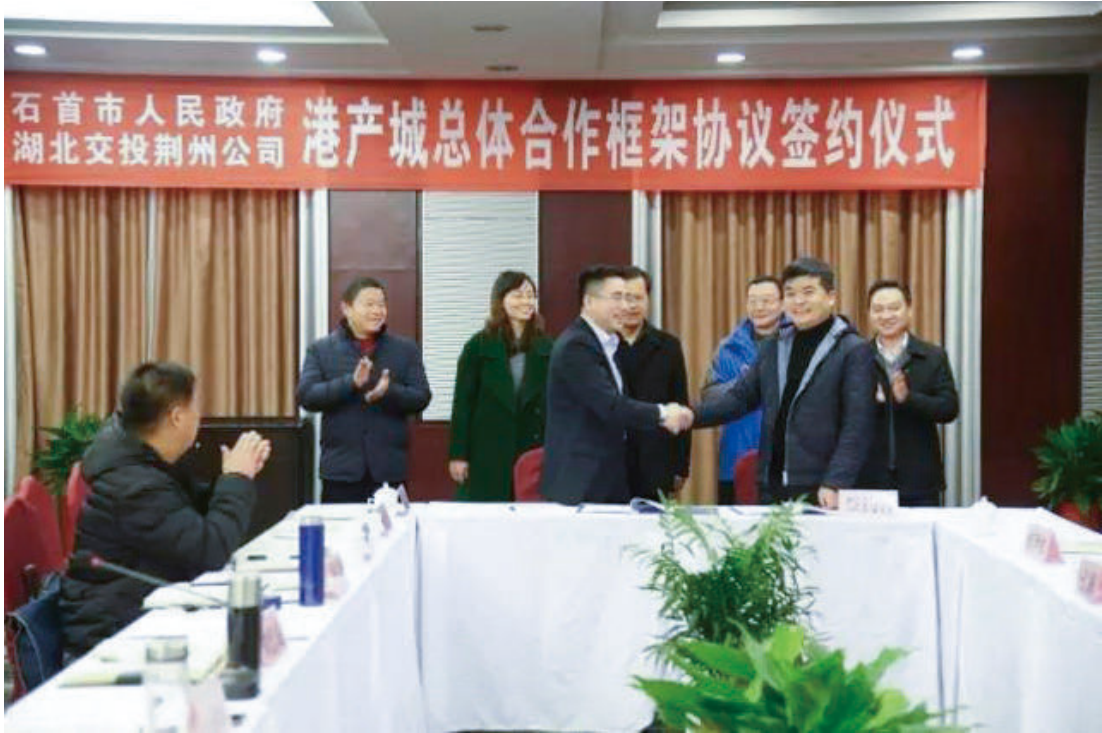
11月30日，石首市政府与湖北交投荆州投资开发股份有限公司举行港产城总体合作框架协议签约仪式