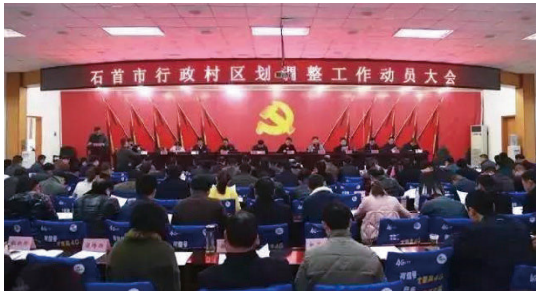
12月8日，石首市全面启动行政村区划调整工作