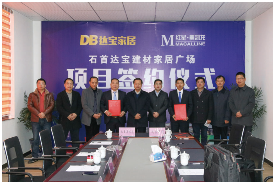
红星·美凯龙进驻达宝建材家居广场签约仪式