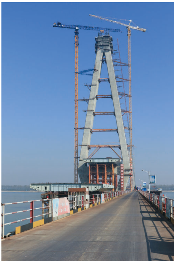
建设中的石首长江大桥