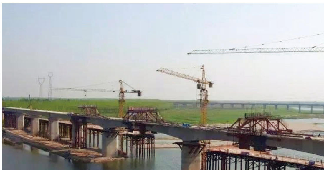
建设中的蒙华铁路——石首段