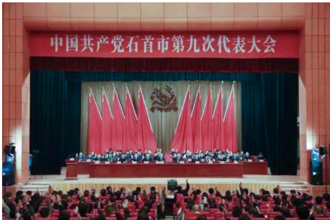
11月17—19日，中国共产党石首市第九次代表大会在市科技馆召开