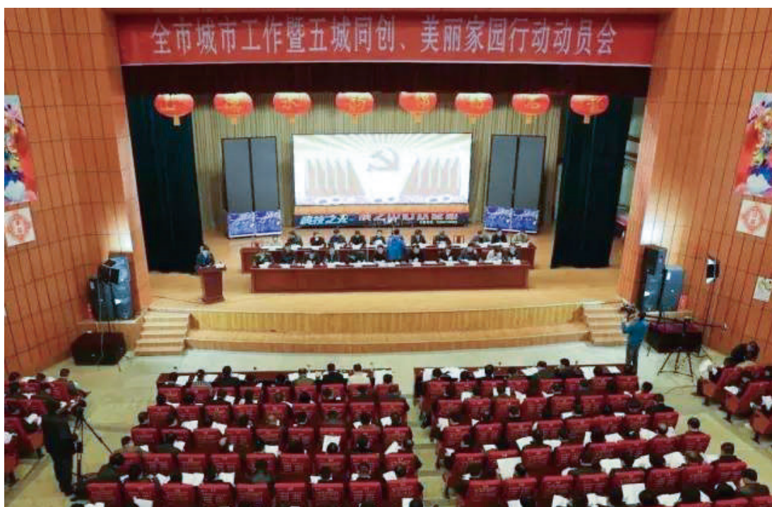
3月24日，全市城市工作暨五城同创、美丽家园行动动员会在市科技馆举行，标志着石首市正式发出以国家园林城市、卫生城市和省级环保模范城市、文明城市、森林城市为主要内容的“五城同创”动员令