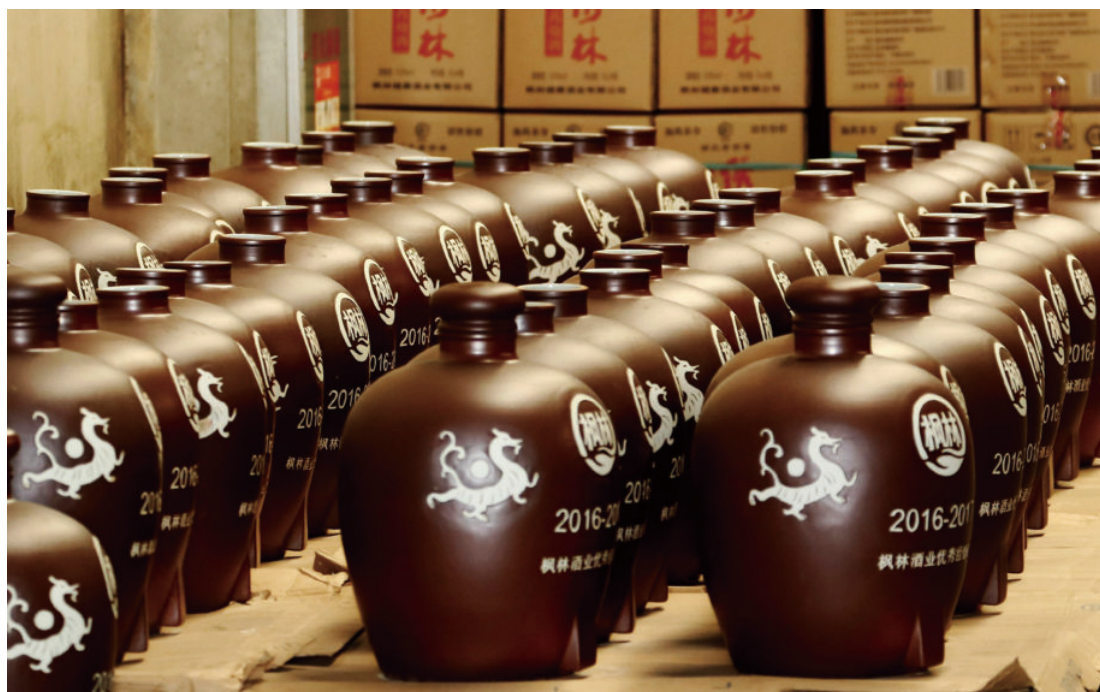
枫林酒业车间一角