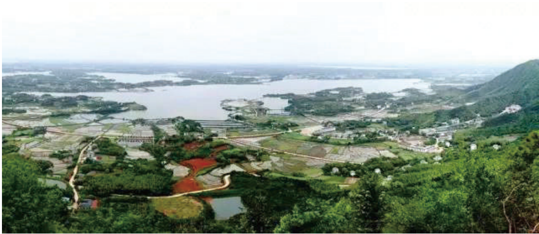
10月，石首市桃花山镇白洋林村、石华堰村、古井口村、漆家铺村，调关镇斑竹岭村，东升镇庄家铺村，大垸镇大堤口村、北碾村、四岭子村、古长堤村，天鹅洲开发区天鹅村，小河口镇黑瓦屋村、杨波坦村，高基庙镇百子庵村，团山寺镇六波庵村、小新口村，久合垸乡殷家洲村、潭子口村，笔架山街道办事处易家铺村，被列入全国乡村旅游扶贫重点村