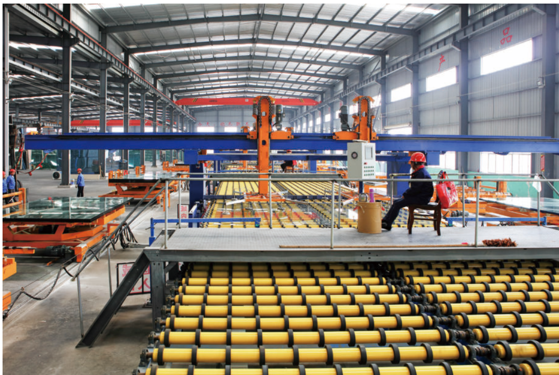
瀚煜建材玻璃生产线