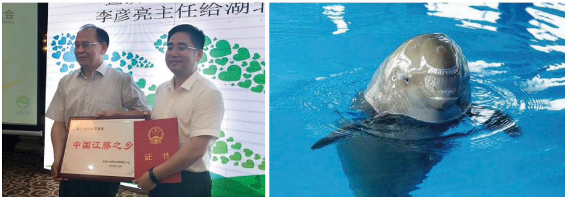
12月15日，中国野生动物保护协会授予石首“中国江豚之乡”称号