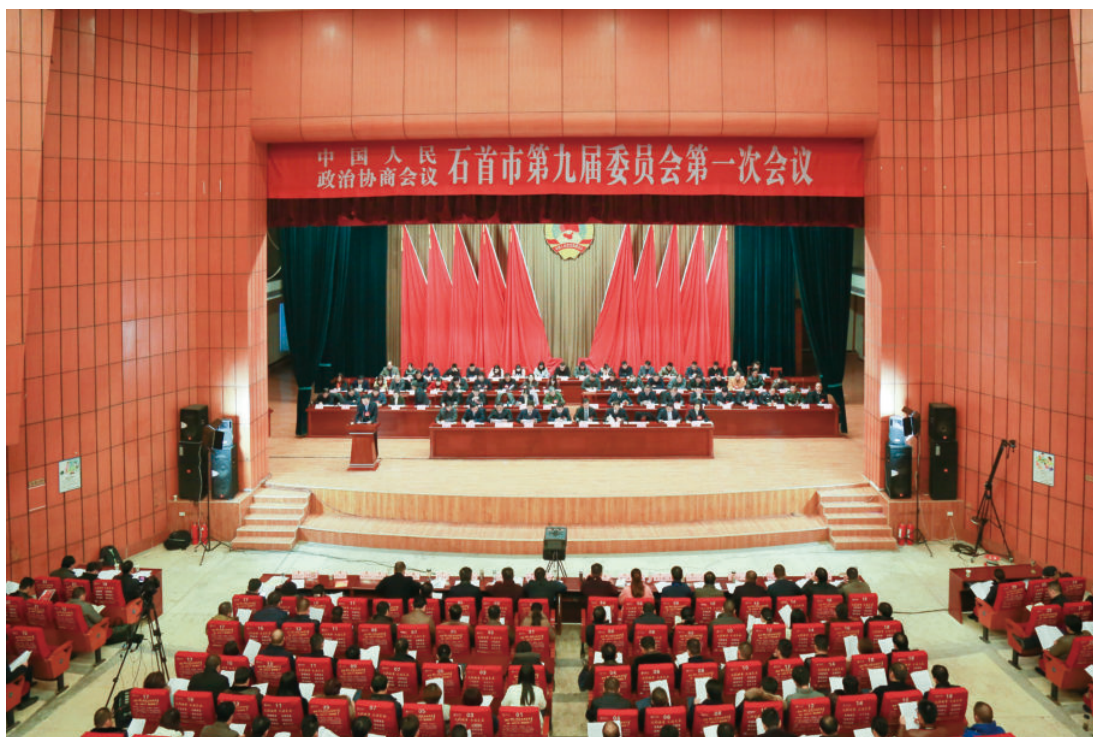
11月25—29日，政协石首市第九届委员会第一次会议在市科技馆召开