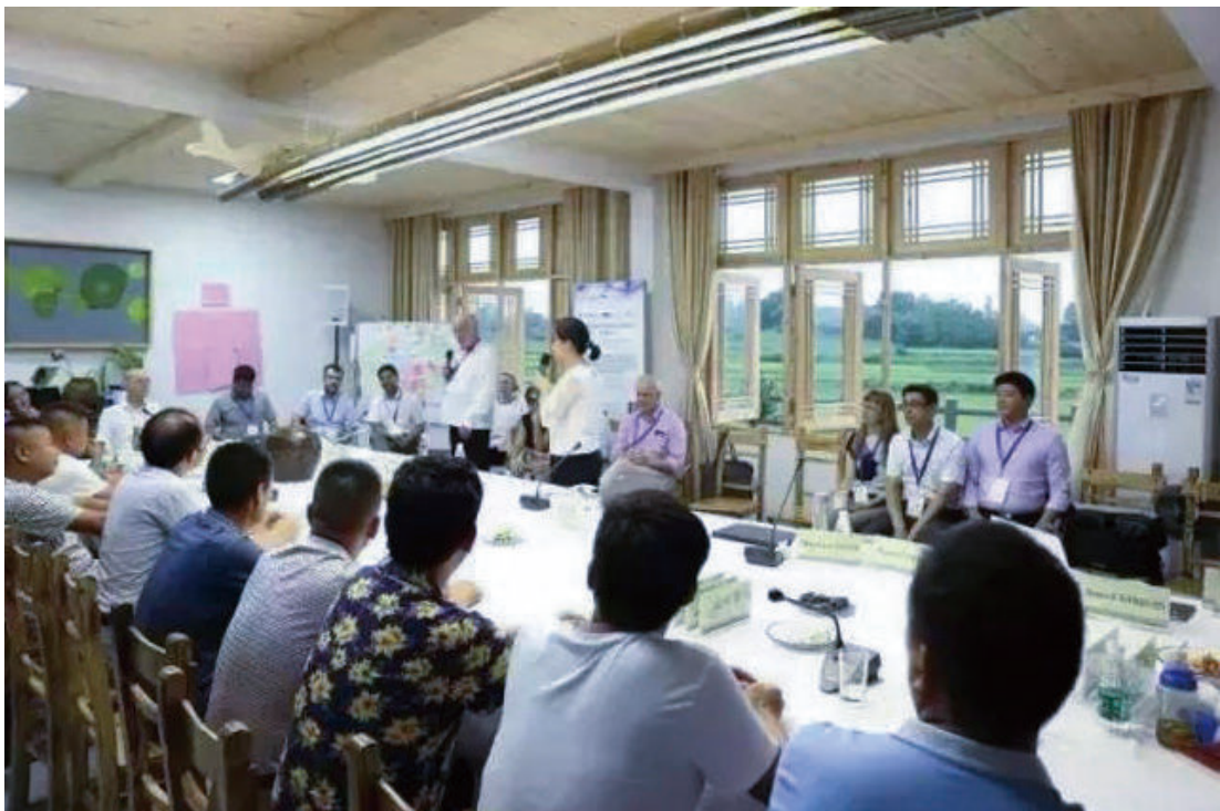
8月1—6日，以中国欠发达地区绿色发展及全球性涵义为主题的国际研讨会在团山寺镇秦克湖白鹭生态湿地举行