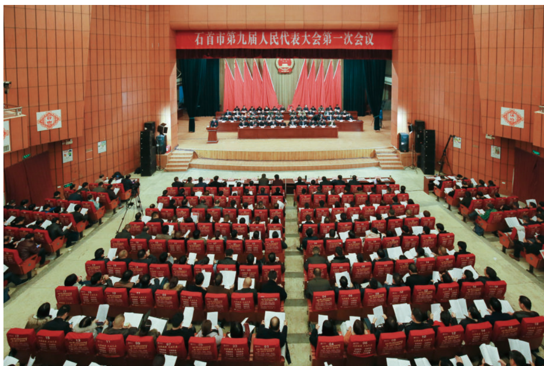
11月26—30日，石首市第九届人民代表大会第一次会议在市科技馆召开