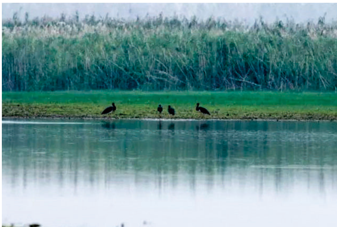
11月20日，东升镇马船村芦苇荡附近水塘边发现五只国家一级保护动物黑鹤。黑鹤被《濒危野生动植物种国际贸易公约》列为濒危物种，为世界濒危珍禽、国家一级保护动物，全球仅2000余只