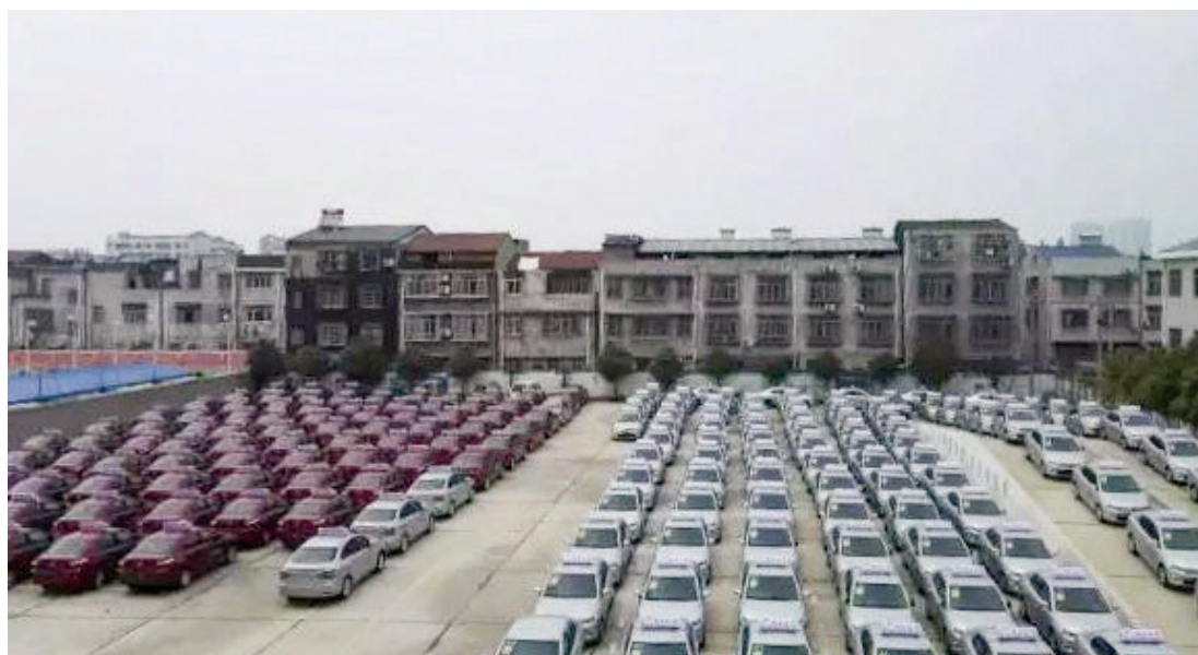
6月12日，新更换的228台出租车正式投入运营