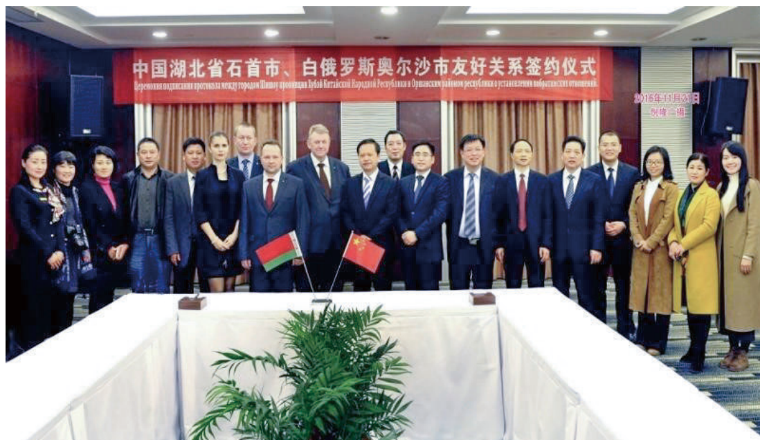
11月20—22日，石首市与白俄罗斯奥尔沙市签定友好城市关系意向书，标志着双方正式缔结友好城市