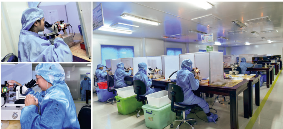
华美阳光生物工作场景