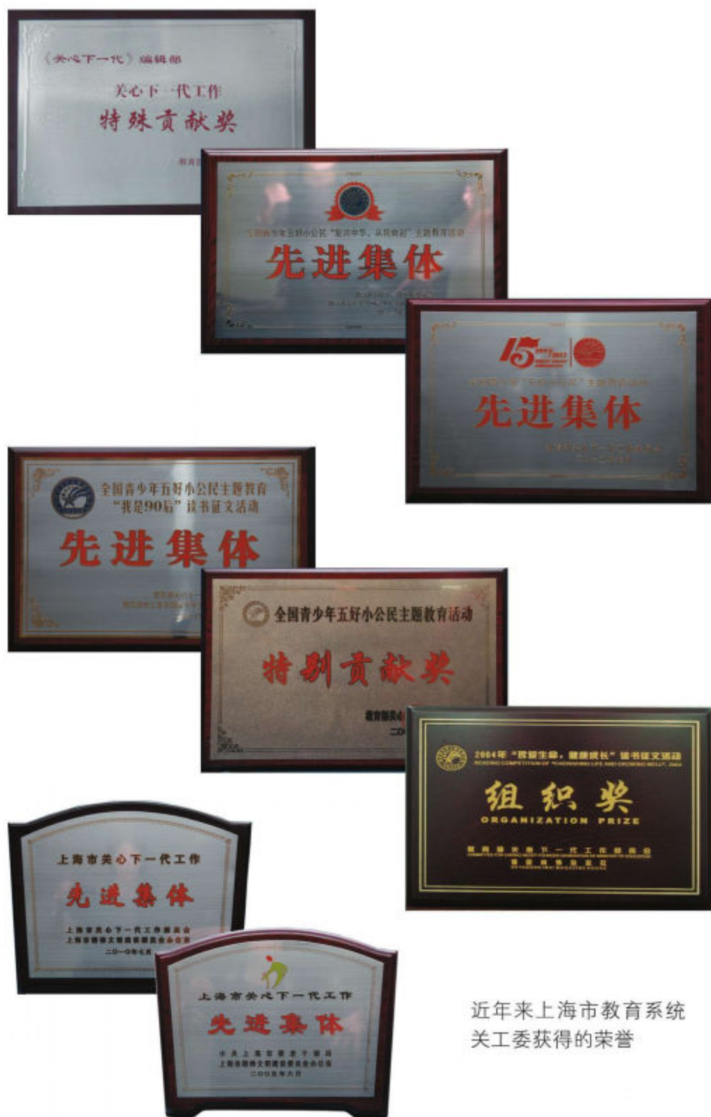
近年来上海市教育系统 关工委获得的荣誉