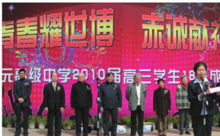
上海市教育系统关工委领导参加基层关工委特色活动