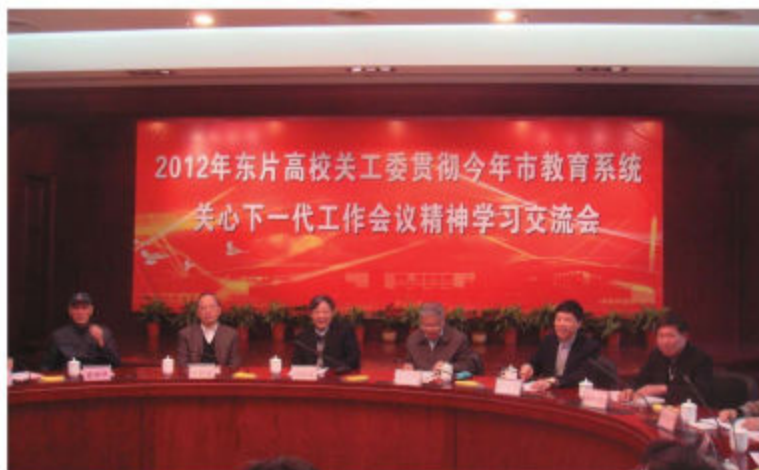
上海市高校关工委召开学习交流会