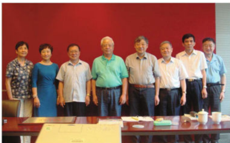
教育部关工委领导来沪指导《关心下一代》杂志办刊工作