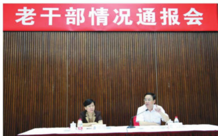
上海市教卫工作党委领导向关工委老同志通报工作