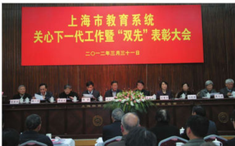
上海市教卫工作党委召开关心下一代工作暨先进集体和个人表彰大会