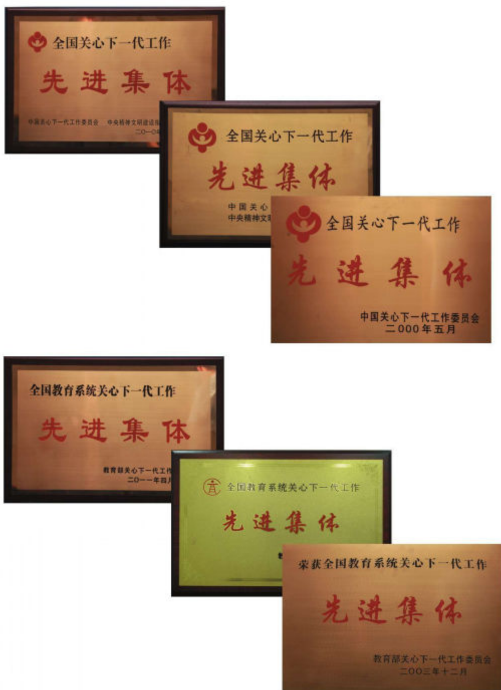
近年来上海市教育系统关工委获得的荣誉