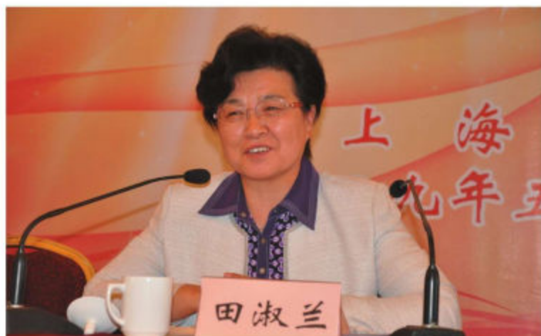
教育部关工委主任田淑兰来沪指导关心下一代工作