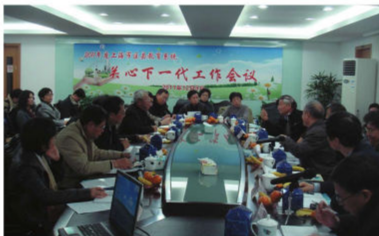
上海市教育系统关工委召开区县教育系统关心下一代工作会议