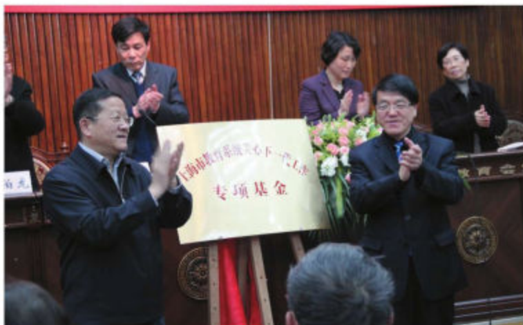
上海市教卫工作党委领导为教育系统关心下一代工作专项基金成立揭牌