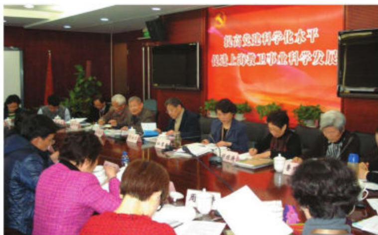
上海市教育系统关工委举行全体委员会议