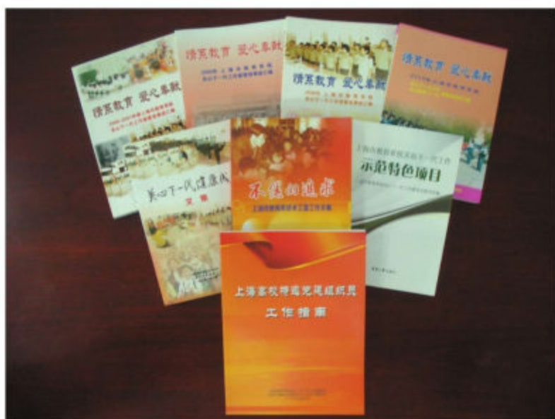
近年来上海市教育系统关工委工作成果和专著