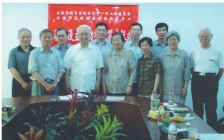
上海市教育系统关工委领导出席上海市高校浦东继续教育中心捐赠仪式