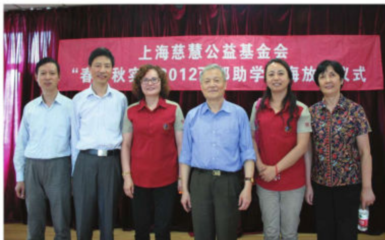
上海市教育系统关工委领导出席上海慈慧基金会帮困助学捐赠仪式