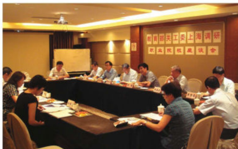
教育部关工委领导来沪调研指导工作