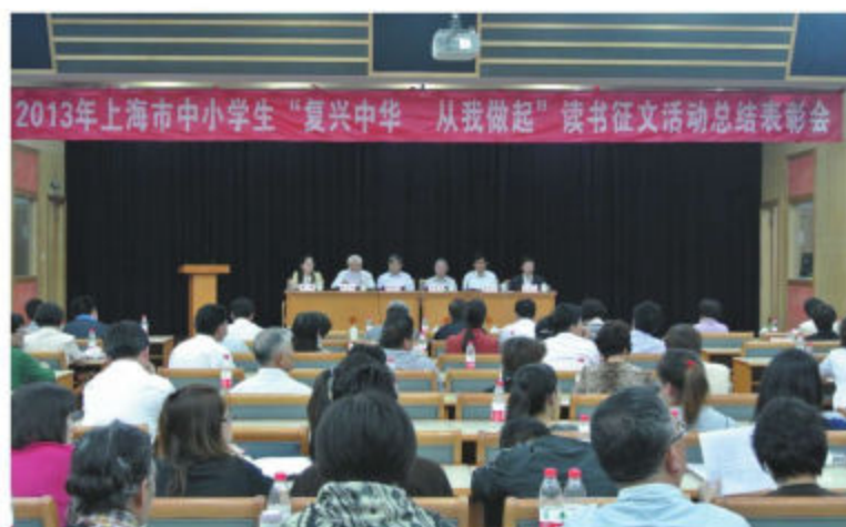
上海市教育系統關工委召開讀書徵文活動總結表彰會