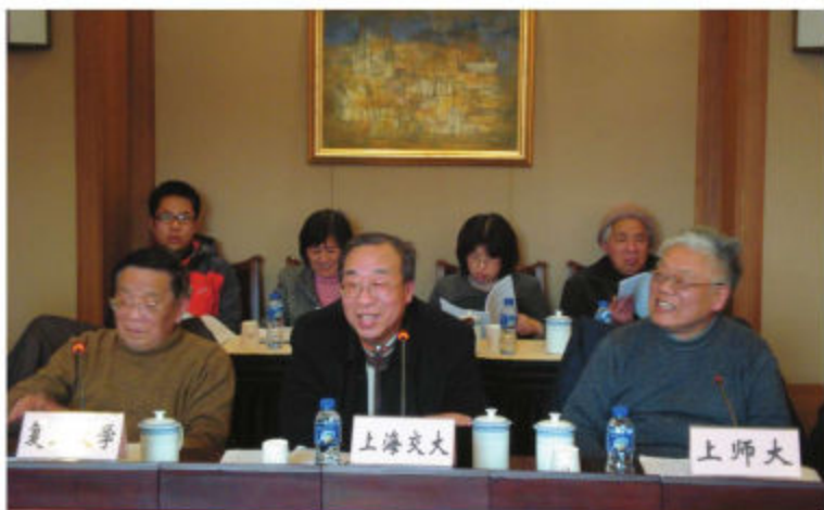
高校关工委老同志参 与大学生党建工作研 讨会