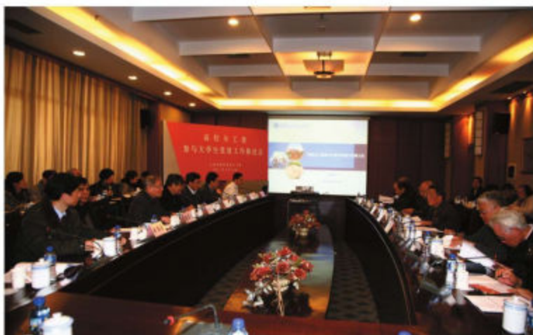
上海市教育系统关工委 召开全市高校关工委 参与大学生党建工作 座谈会