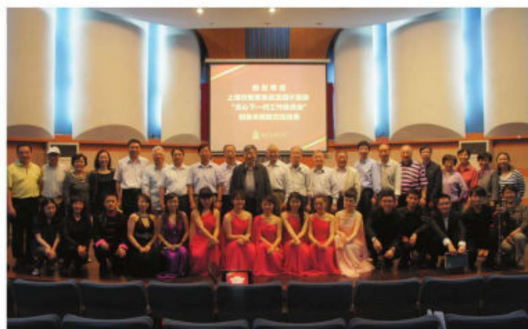
上海市教育系統關工委領導觀摩大學生匯報演出