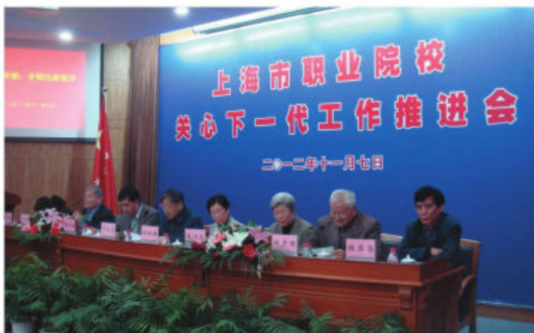
上海市教育系统关工委召开全市职业院校关心下一代工作推进会