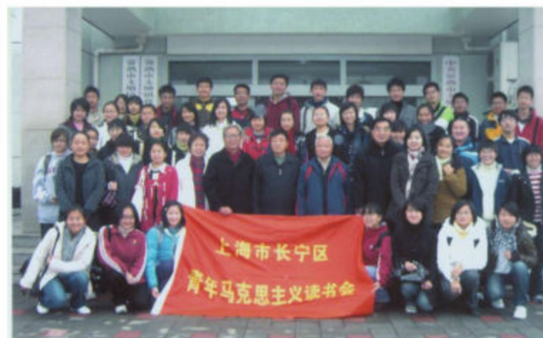
區縣教育系統關工委開展特色項目活動