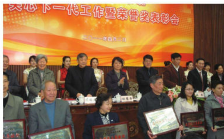
上海市教育系统关工委为关心下一代工作先进集体和个人颁发荣誉奖