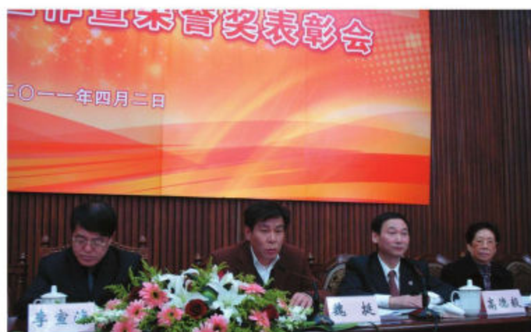
中共上海市委老干部局领导出席上海市教育系统关心下一代工作会议