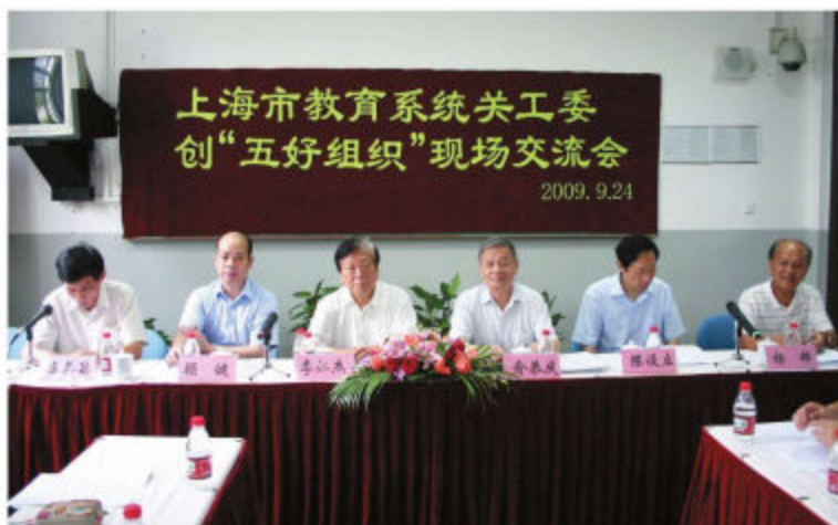
上海市教育系统关工委创“五好基层组织”现场交流会