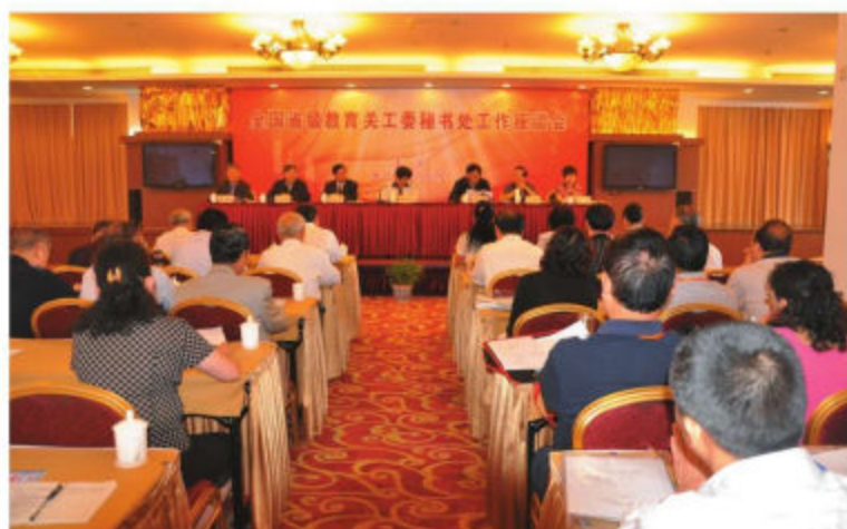
全国省级教育系统关工委秘书处工作会议在沪召开