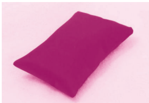
图 1-1-1 小沙袋