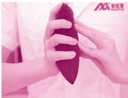
图 1-1-4 五指力训练