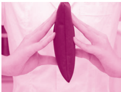
图 1-1-5 十指力训练