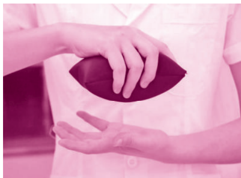
图 1-1-2 握力训练

(1) 握力训练：用五指抓起沙袋坚持 3 秒然后放下,再抓起。单手重复 50 次,再换另一只手做相同动作,如图 1-1-2。