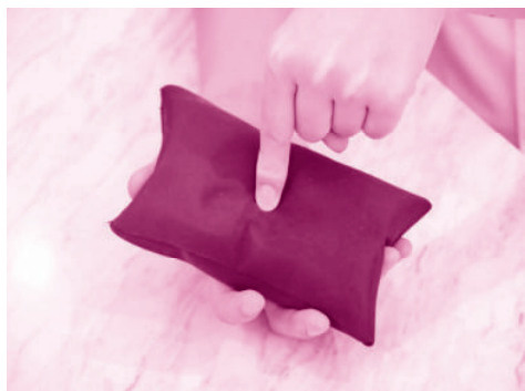
图 1-1-3 单指力训练

(2) 单指力训练：食指指腹按压沙袋,逐渐向下施力,到达沙袋下凹极限,再慢慢放松,如此重复 50 次,再换手做相同动作,如图 1-1-3。