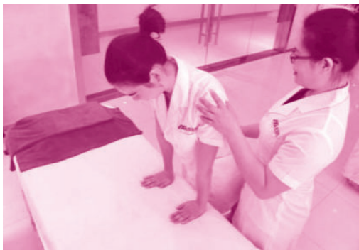
图 1-1-7 压腕训练