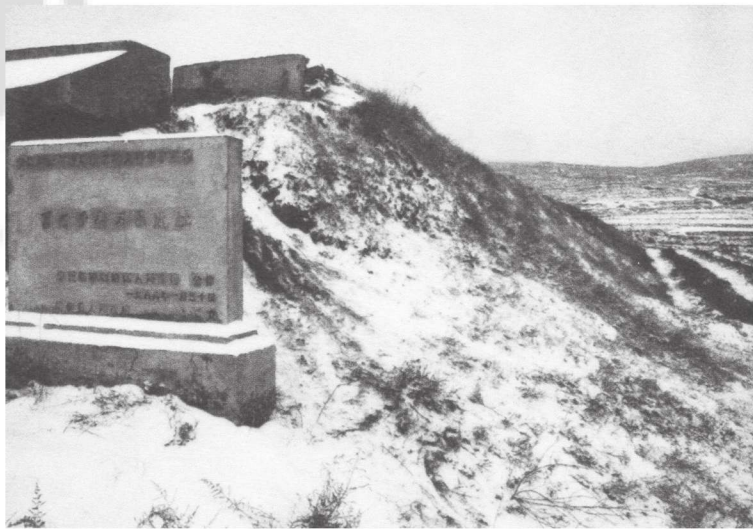
隆德页河子新石器遗址