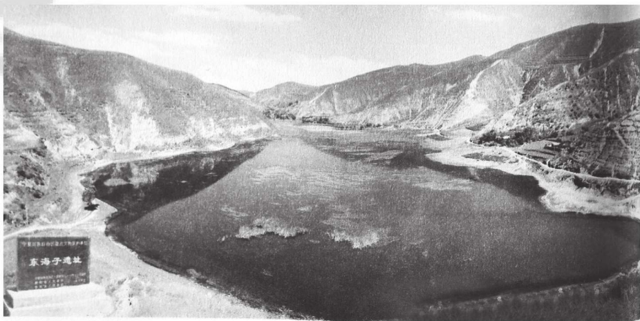
东海子（传说中的雷泽，华胥履足的地方）

大约在地质学第四纪之初，地球是冰河时期，在中国历史上正是传说中的九头十纪开天辟地的时代。当此之时，鸿蒙未辟，宇宙洪荒，整个世界都在混沌之中。当时的中国西南天气和暖，雨水充足，黄河以北则冰雪皑皑。特别是蒙古高原地处中国极北，首当冰河冲击，所以“有冻塞积水，雪雹霜霰，漂泊群众之野”。洪大的冰流从西伯利亚滚滚而来，