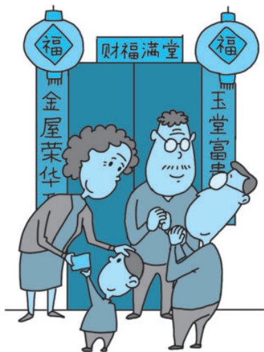
图 1-1 皮特和潘天给爷爷奶奶拜年