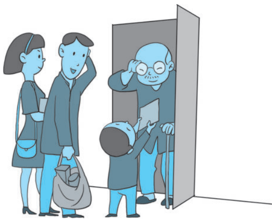
图 1-2 上门拜访送礼

招待客人时不能怠慢，每个客人都要招呼周全。和客人聊天，不谈悲哀事、伤心事；不去质疑对方；不要随便否定对方感兴趣的问题。