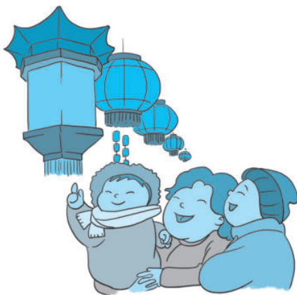
图 1-4 元宵节张灯结彩的景象

灯会在夜间举行，一般从正月初十开始就行动起来，人人动手，各家各户扎花灯、点花灯，特别是到了元宵节的晚上，家家户户举烛张灯，结彩为戏，供人观赏，所以元宵节又称“灯节”。