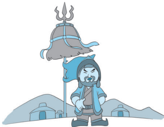
图 2-1 九旂白纛和成吉思汗

公元 1206 年春天，成吉思汗在斡难河畔举行建立蒙古汗国大会，在会上竖起了九旂白纛。据《蒙古秘史》载：成吉思汗“在斡难河源头，建九脚白旄纛做皇帝”。这是蒙古人历史上首次对九旂白纛的记载。从这时起，蒙古人每逢庆祝时都立九旂白纛，将其视为民族和国家兴旺的象征。