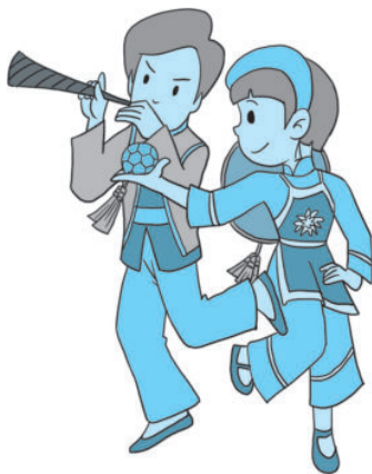
图 2-2 壮族

壮族是中国少数民族中人口最多的一个民族。壮锦与南京的云锦、成都的蜀锦、苏州的宋锦并称“中国四大名锦”。铜鼓是壮族人民最重要的乐器，它源