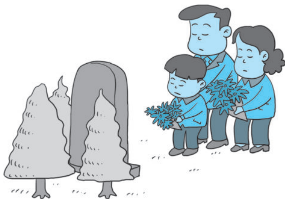
图 1-6 清明扫墓

清明节是最重要的祭祀节日，是祭祖和扫墓的日子。扫墓时，人们要携带酒食果品、纸钱等物品到墓地，将食物供祭在亲人墓前，再将纸钱焚化，为坟墓培上新土，折几枝嫩绿的新枝插在坟上，然后叩头行礼祭拜。