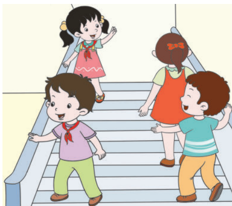
shàng xià lóu tī kào yòu xíng 上下楼梯靠右行

xià kè hòu wǒ men yīng zūn shǒu kè jiān guī zé 下课后，我们应遵守课间规则。