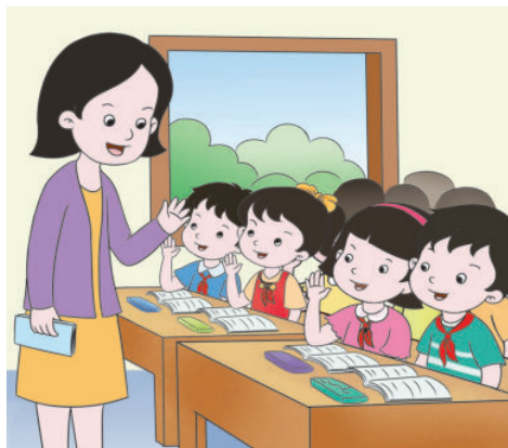
jǔ shǒu huí dá wèn tí 举手回答问题

xiǎo xué shēng rì cháng xíng wéi guī fàn guī dìng xiǎo xué shēng zài xué 《小学生日常行为规范》规定，小学生在学 xiào shàng kè shí yào kè qián zhǔn bèi hǎo xué xí yòng pǐn shàng kè zhuān xīn 校上课时“课前准备好学习用品，上课专心 tīng jiǎng jī jí sī kǎo dà dǎn tí wèn huí dá wèn tí shēng yīn qīng chǔ 听讲，积极思考，大胆提问，回答问题声音清楚”。