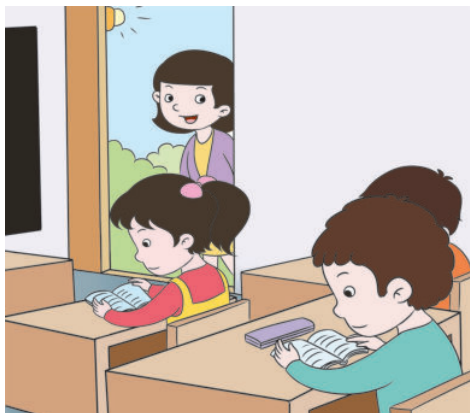
zuò hǎo kè qián yù xí 做好课前预习