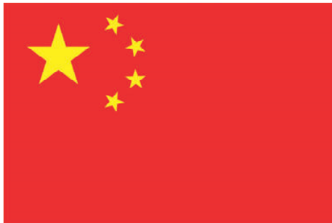
wǔ xīng hóng qí 五星红旗

wǔ xīng hóng qí de qí miàn wéi 五星红旗的旗面为 hóng sè xiàng zhēng gé mìng zuǒ shàng 红色，象征革命，左上 fāng zhuì huáng sè wǔ jiǎo xīng wǔ kē 方缀黄色五角星五颗。 qí zhōng dà wǔ jiǎo xīng dài biǎo zhōng 其中，大五角星代表中