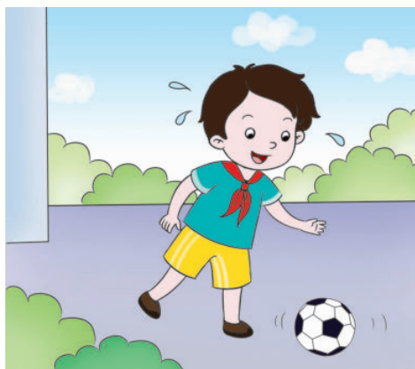
jìn xíng yǒu yì de kè jiān huó dòng 进行有益的课间活动