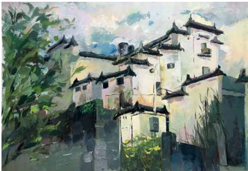
图1-4 徽派建筑色彩写生

色彩写生是绘画当中常见到的形式，是画家在创作过程中收集素材的一种方法，也是学习绘画必不可少的训练之一。通过色彩写生可以培养我们对事物敏锐的观察力和新鲜的感受。色彩写生是为了表现物体在一定条件下包括光线、时间、季节、环境等因素在内的色彩关系，并通过色彩的运用来表现它们的形体结构、空间和意境以及情趣等（图1-4、图1-5）。